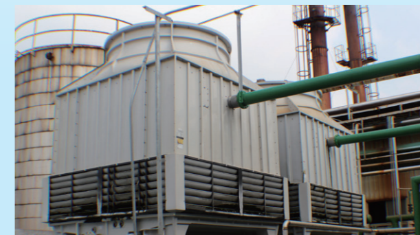
更新高效率冷卻水塔