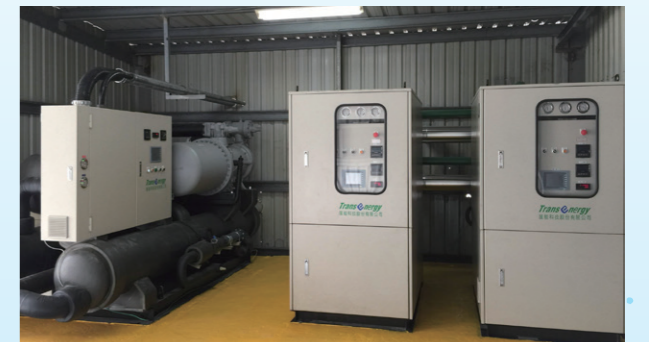
增設高溫熱泵取代蒸氣製造熱水