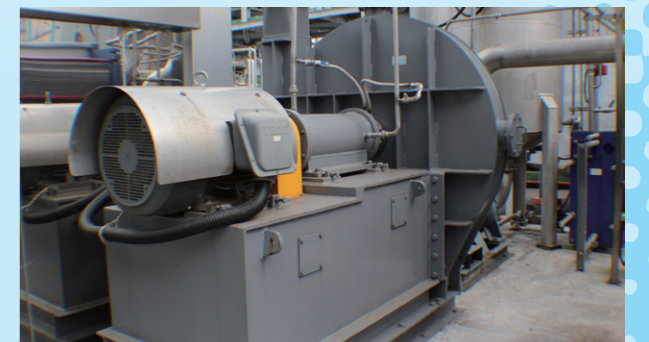
增設 MVR 提高蒸氣使用效率