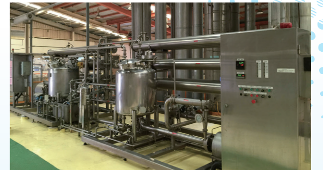
增設一台分子篩過濾系統 (UF) · 降低濃縮蒸氣用量