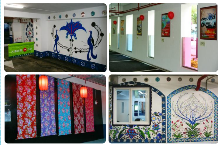
停車場佈設結合藝文與地方特色