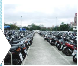
營運後 車輛停放井然有序