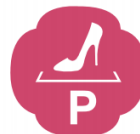
女士優先停車區 Reserved Parking for Women