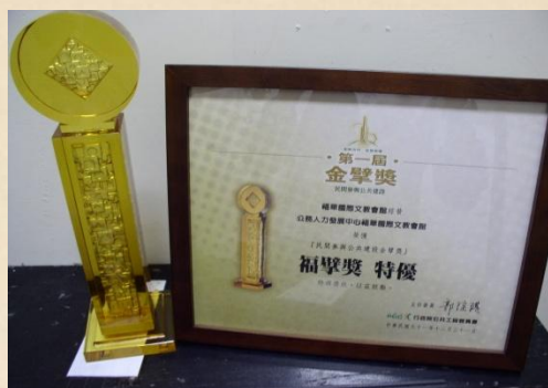
『第一屆金擘獎』 『福擘獎 特優』