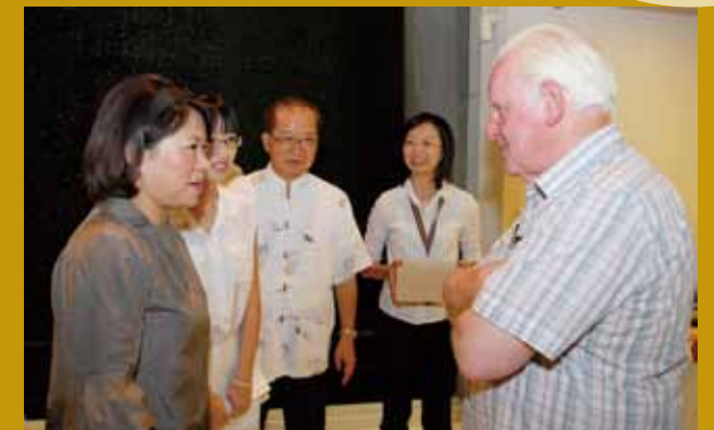
嘉義市長黃敏惠與副市長李錫津與外賓說明嘉義市一切準備就緒，歡迎所有音樂家蒞臨嘉義市。