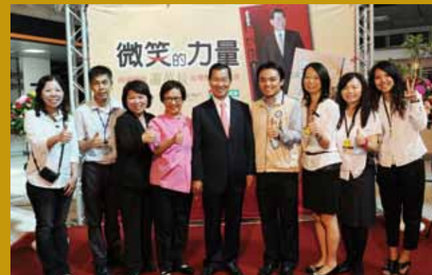
民國100年辦理《微笑的力量》贈書記者會，文化局工作伙伴與嘉義市長黃敏惠、蕭副總統伉儷合影（右三）。