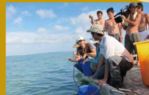
公共電視節目採訪放流活動。