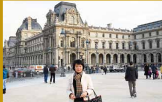
赴法研習期間，參訪羅浮宮，汲取文創產業經驗。