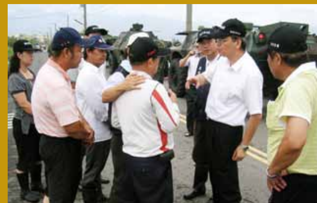
民國99年屏東地區災後清理（右二）。