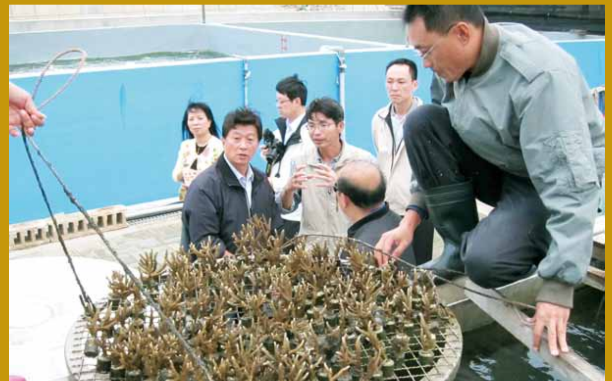
澎湖縣議會考察介紹場內珊瑚培育狀況（中）。