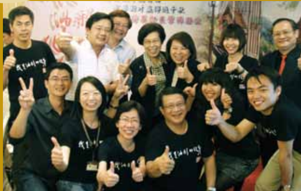
民國100年11月《我是油彩的化身》音樂劇演出結束後大家歡喜合影（下排左二）。