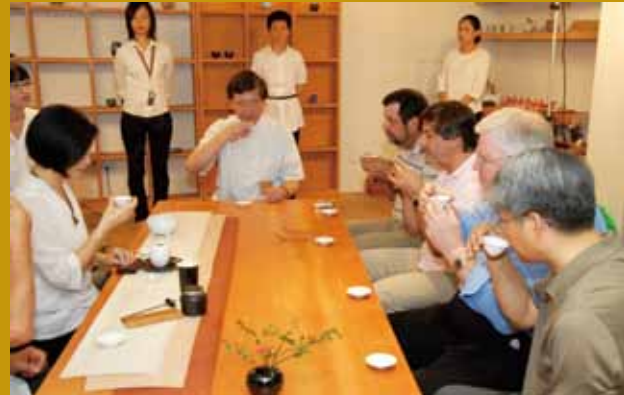
民國99年世界管樂協會代表場勘行程，安排至嘉義市泰郁美學堂體驗茶席之美（後排左一）。