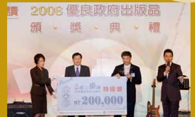
文資局出版之專書《鏗鏘已遠》獲得政府出版品特優獎，王局長代表領獎（右二）。