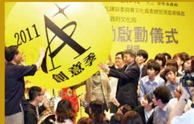
主持臺中國區「A+創意季活動」揭幕儀式。