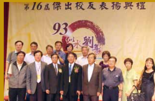
民國101年獲興大頒傑出校友與同學家人合影（前排左三）。