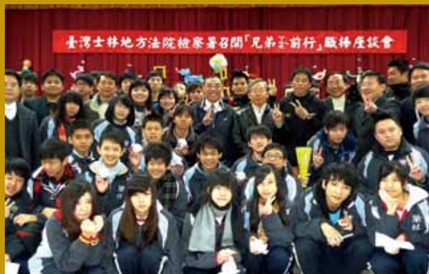
士林地檢署於校園召開反職棒簽賭座談會 (後排右四)。