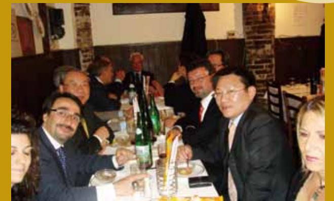
民國98年4月於Antico Falcone餐廳與義大利法界晚宴。