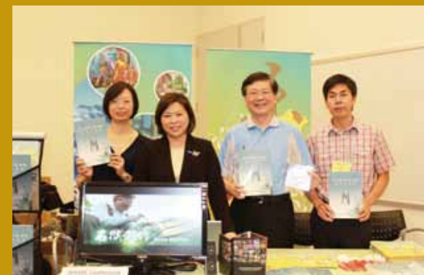
民國98年至美國辛辛那提市簽署主辦第15屆世界管樂年會契約書（左一）。