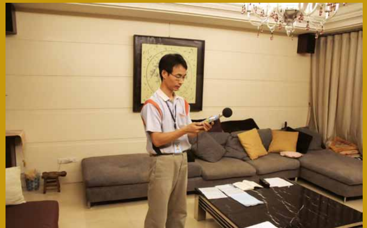
辦理噪音陳情案件稽查，於住戶家中進行低頻噪音量測。