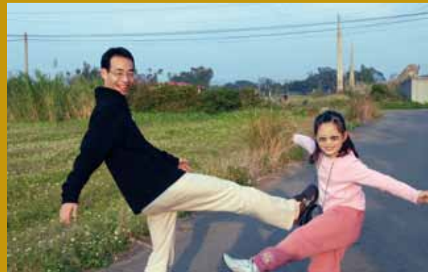
鄉間小路親子互踢（爸爸勝）。

都是我在工作上的絆腳石。深思後，我放下自己的好惡，提起民眾的期待，工作上的目標清楚了，方法正確了，一切事也就迎刃而解了。而能放下名利、苦難是我最大的資產，也是我最大的優勢。俗話說「人到無求，品自高」，放下後，讓我看穿迷霧，朝著目標勇往直前。