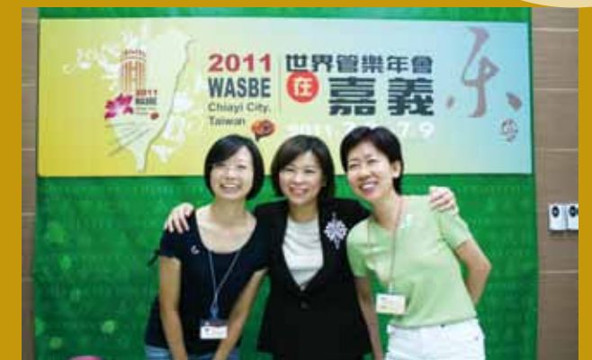
民國98年出席美國辛辛那提市第14屆世界管樂年會之行前記者會（左一）。