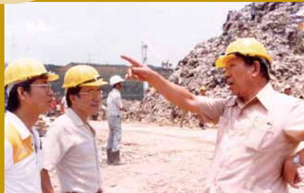
民國73年工作於內湖垃圾場（左一）。