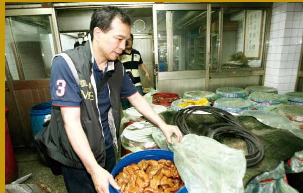
查緝金果王食品有限公司違反食品管理衛生法案件（塑化劑案）。