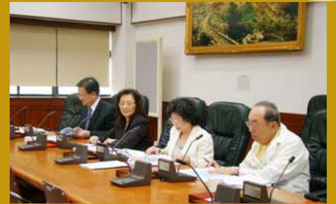
評審委員會第 2 次會議決議實況。

秀公務人員，並期許全體公務人員能效仿學習，銓敘部本年特別規劃「用你的 idea 述說傑出 style」標語投稿暨網路投票抽獎活動，並於本年 12 月 14 日表揚大會當日上午公布票選結果及公開抽獎。