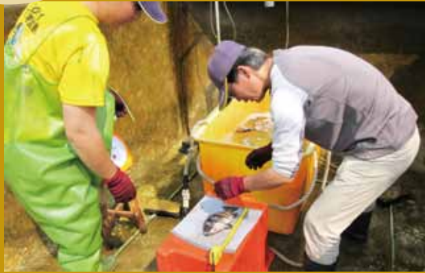
石鯛人工繁殖種魚量測。