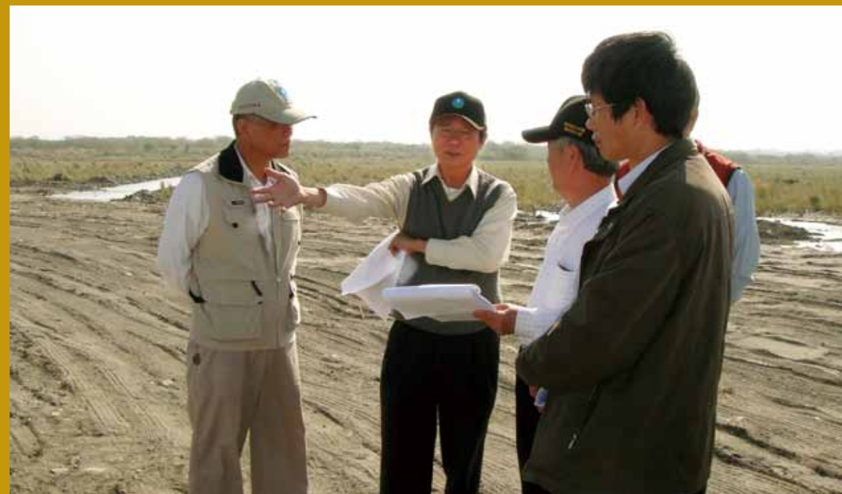
民國100年視察指導濁水溪地下水補注（左二）

淹水、缺水及颱風災害潛勢相對較高的國家，其中三種災害同時發生的區域高達 73%，二種災害同時發生的區域更高達 90%。伴隨著氣候變遷所帶來高頻率災害，臺灣面臨包括旱澇交替、土砂災害、海岸保護、地層下陷等問題，在防治工作上，必須有重建「適應未來與自然共生」的新思維，完善的國土規劃及流域綜合治水，才能確保國家永續發展。在執行面，推動跨域治理，如全方位地層下陷防治、流域整體規劃治理、水庫集水區整治、全民全國全面（三全運動）節水型社會的建立、多元化水資源及水回收再利用、都市防洪及建築物雨水貯蓄等策略，才能有效解決水的問題。水利團隊面對挑戰，也須提升機關整體效能，才能確保民眾生命財產安全。個人更自我期許，在逆境中飛颺，更用心，更虛心，結合團隊力量，為國家作出更多的貢獻。