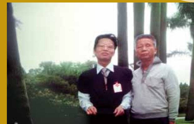
民國70年臺大研究所畢業與父親合影。