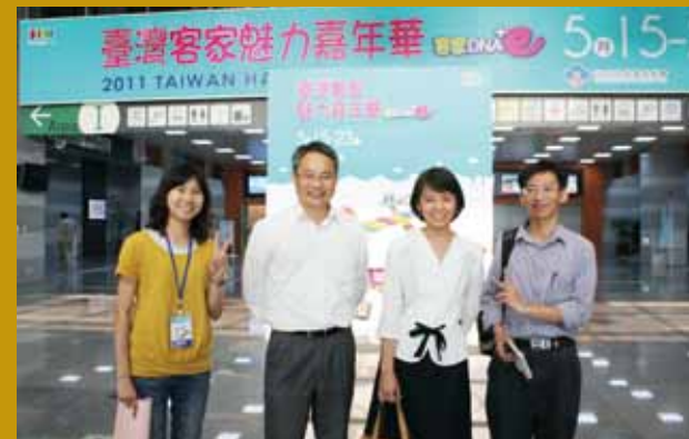
創意辦理「臺灣客家魅力嘉年華」，運用現代科技展現客庄文化魅力（右二）。