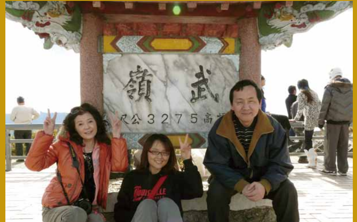
與家人旅遊至武嶺。