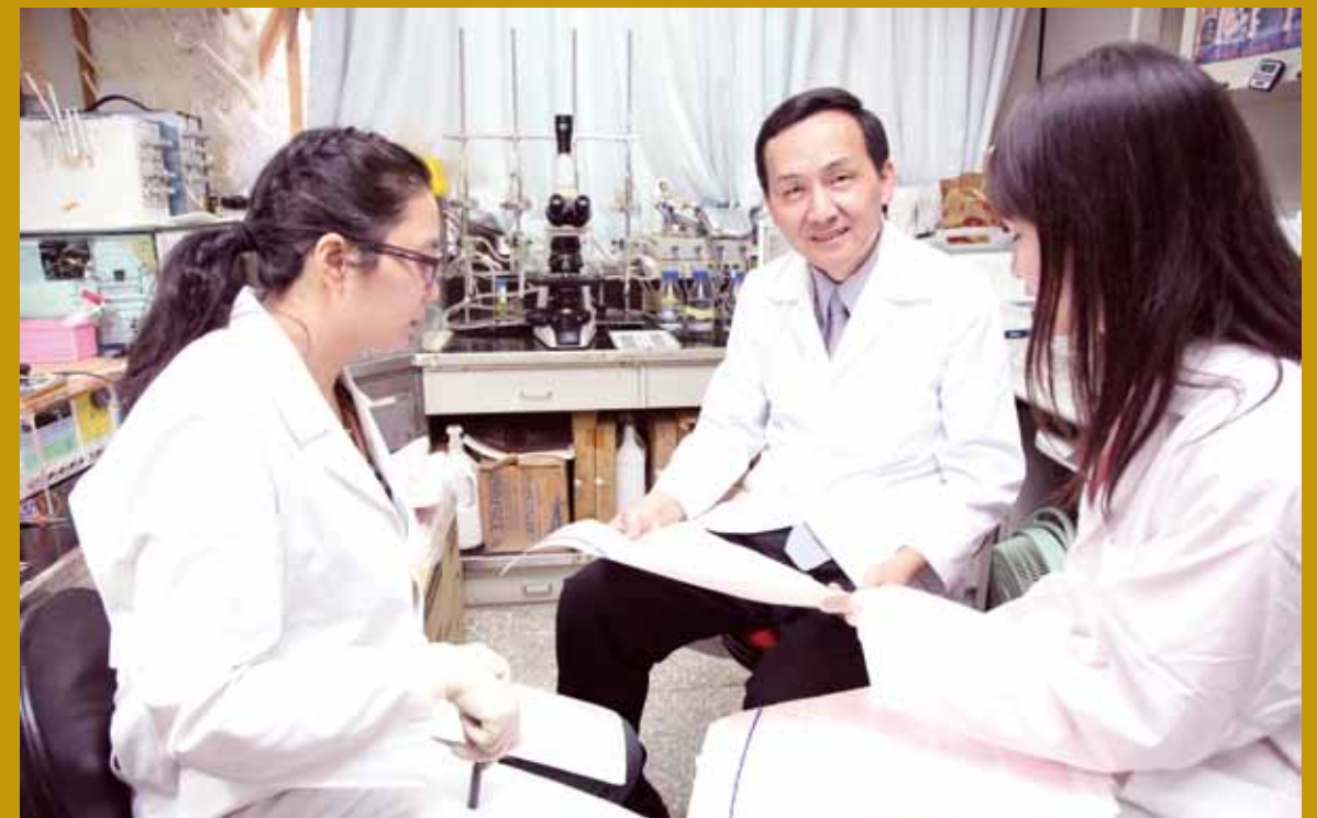
於實驗室與研究助理討論研究紀錄數據資料。