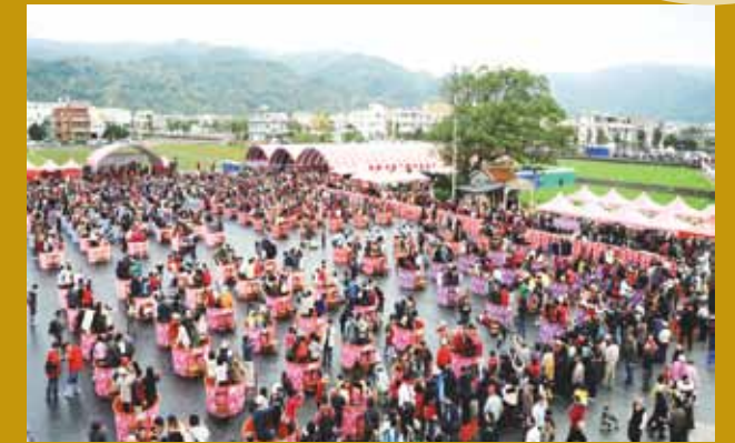
千人踏鹹菜的壯觀場面，大幅提升客家福菜知名度及售量。