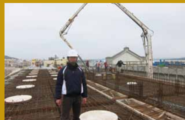
三期工程灌漿督工作業。