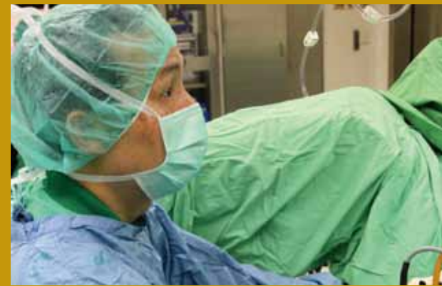
於手術室為病患施行手術。