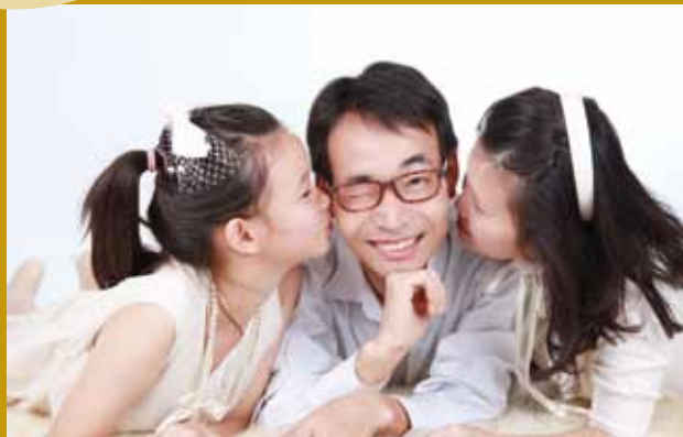
女兒10歲拍藝術照紀念。