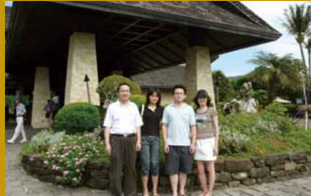
與家人至墾丁旅遊。

入臺北榮民總醫院經歷外科住院醫師、總醫師、主治醫師、科、部主任等各層級醫師，在工作時均秉持「盡己之心、克盡職責」之觀念。感謝臺北榮民總醫院提供的優質學習成長環境，在成長的過程中，受到老師及前輩醫師的訓練指導，工作同仁的鼓勵支持以及長官的愛護，使我在醫療服務、研究創新及臨床教學的工作上，能夠發揮最大之效能，得到較好之成果，我以身為「榮總人」為榮。