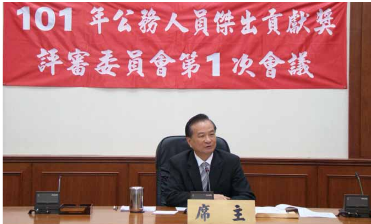
評審委員會第 1 次會議

銓敘部於本年 7 月 9 日以部管二字第 1013606120 號函請總統府、國家安全會議、五院、