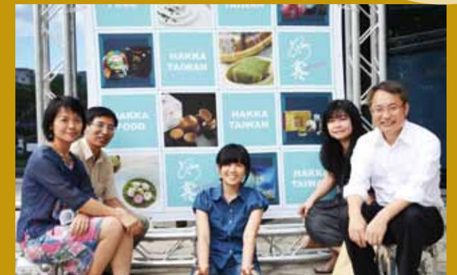
發表「HAKKA TAIWAN」及「客家美食HAKKA FOOD」雙品牌，以利客家產業永續發展（左一）。

一職。當時客委會屬草創初期，全會從主委到技工，不到 20 人，我那一科更是只有我一人，全會不分彼此，大家一起努力建立制度、擬訂施政計畫，而我不但自己承辦業務，每天踏著月色回家，假日更是加班趕辦公文。猶記得，有一天我剛滿周歲的兒子發燒，我只好把公事處理告一段落，下班後要趕回家帶他就醫，路上一直覺得哪裡不對勁，過了一段時間，才恍然大悟，原來是我已經好長一段日子沒有在天還亮時回家。而我並不是唯一個案，這是在客委會工作的普遍現象。