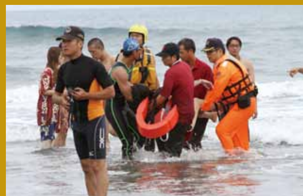
搶救海邊溺水遊客（左前）。