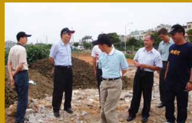
稽查非法棄置有害廢棄物場址（左二）。