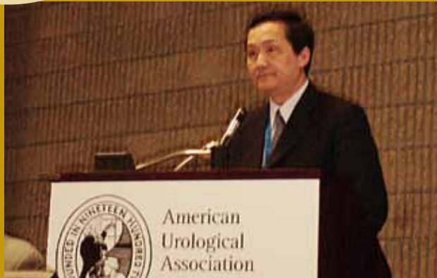
於美國泌尿科醫學會年會發表研究論文。