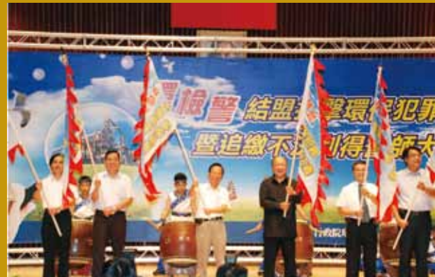
民國100年追繳不法利得誓師大會（左二）。