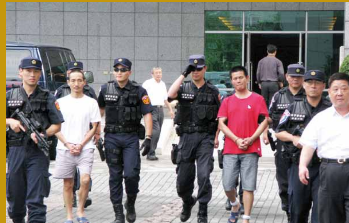
兩岸三地聯合打擊電信詐欺案。

面對兩岸交流所營造出的有力局勢，積極加強兩岸及跨境犯罪之偵辦，落實「海峽兩岸共同打擊犯罪及司法互助協議」，有效抵制跨境電信詐欺、毒品及重大刑事犯罪，是未來無可避免的工作目標。持續整合執法機關資源，強化培訓執法能力，落實精緻偵查，加強辦理排除民怨案件等，均是建立民眾對司法的信賴與政府信心必須廣續努力的目標。公務人員的本身並不單純是一份有保障的工作，它更有值得每一位公務人員努力追求、實現的價值—執行法律、實現正義、保障民眾。