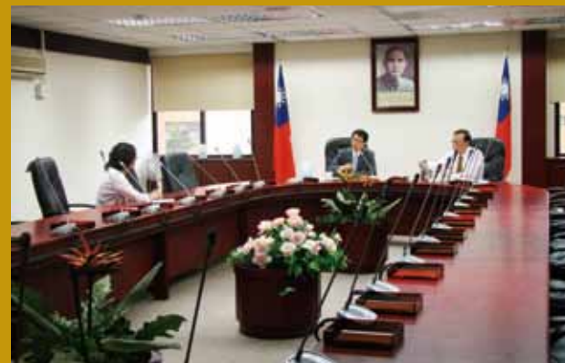
分組簡報審查情形。