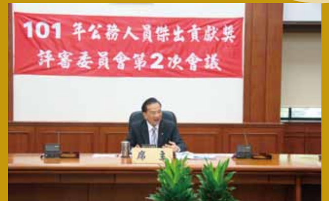
評審委員會第 2 次會議。

各部、會、處、局、署及同層級之機關、直轄市政府、縣（市）政府等選拔模範公務人員之主辦機關，依激勵辦法第 13 條規定，自歷年獲選之模範公務人員遴薦符合激勵辦法第 12 條規定具有傑出貢獻事蹟者，檢附具體事蹟簡介表及有關證明文件，函送銓敘部彙整。另為拔擢基層卓越人才及深化兩性平權觀念，並請各主辦機關推薦人選時除優先考量參選人之傑出具體卓越事蹟外，並審酌主管、非主管、各官等公務人員、兩性比例之平衡及獎從下起之獎勵原則，踴躍推薦人員參與選拔，以適度激勵基層公務人員士氣。