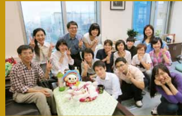
為同仁慶生，大家和樂如同兄弟姐妹（二排中間）。