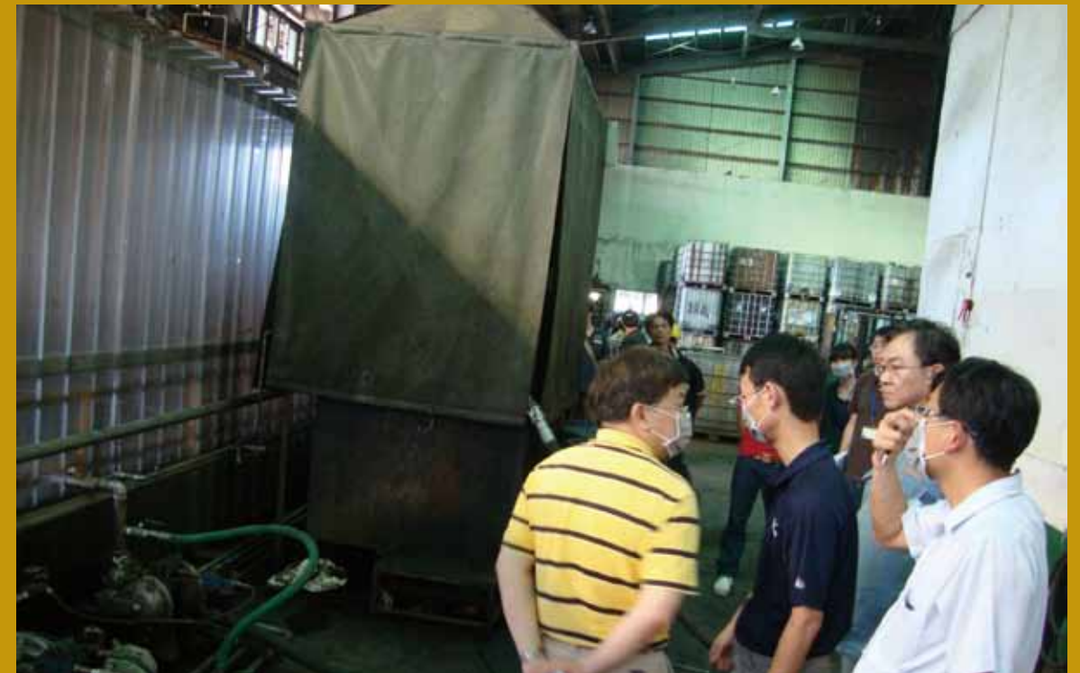
針對縣內的廢棄物處理廠，會同專家學者辦理現場查核作(左二)。

公務人員代替國家執行法令，公務人員更是國家安定與和諧的力量。所謂上樑不正，下樑歪，所以公務人員正，國家就正，希望由我做起，感動同仁，共同端正公務人員的形象，帶領社會邁向光明的未來。