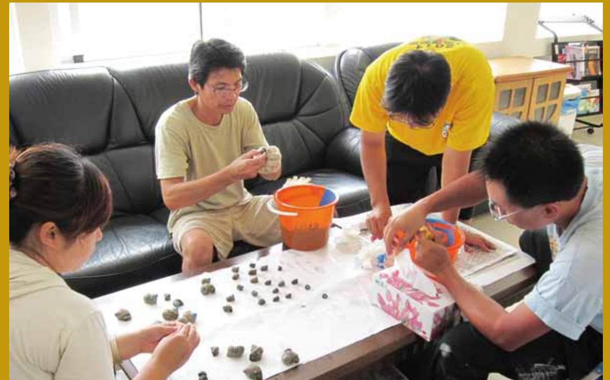
夜光蝶螺放流前上標誌作業。

不管幾歲，我對海洋的熱忱永遠不會消退。不管需要多久的時間，對於做對的事會永遠堅持。「願要大、志要堅、心要細、氣要柔」是我奉行的幾個字，就算當個傻瓜繼續在海底種樹（珊瑚）為海洋生物多樣性而努力亦永不後悔。