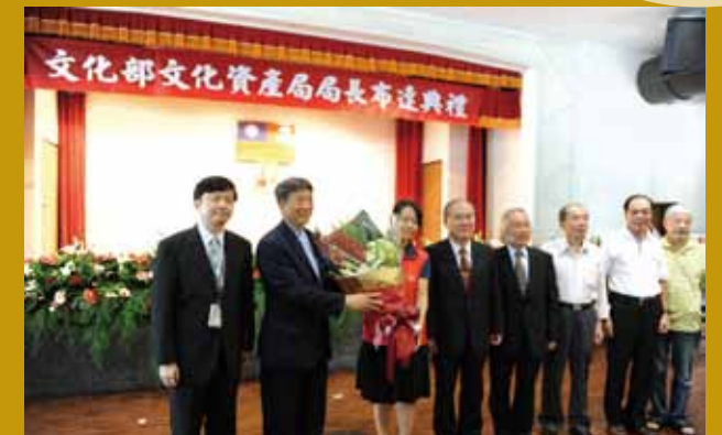
王局長在布達典禮上，接受同仁獻花。

大陸，我認為臺灣絕不可默不吭聲，因而舉辦了兩岸三地關係的研討會、總統中外記者會，深獲好評。