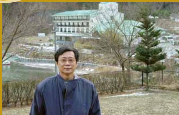
民國94年赴日本考察美和水库永續排砂。