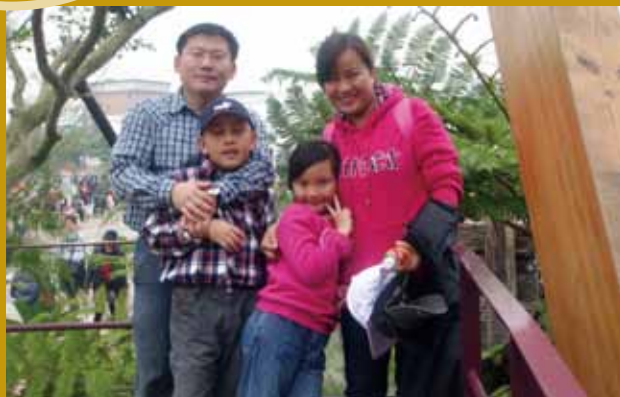
民國100年3月全家同遊花博。