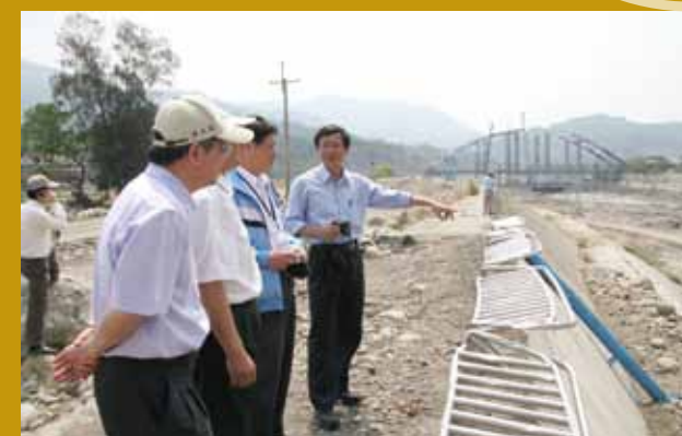
旗山溪莫拉克災後指導。

得獎，是殊榮！更是督促力量與責任的延續。在求學成長過程，特別感謝教會、烏日國小、衛道中學、臺中一中、中興大學校長及師長的用心教導與培育。畢業後自民國 72 年進入水利局八工處工作，從負責臺東海岸調查與卑南溪河堤的工程計畫第一線副工程司職務開始，負責推動中部地區大里溪防洪工程計畫，乃至於到成為水利署組長、主任秘書及副署長籌劃督導推動本次參獎具體事蹟項目：砂石採取新制度的創建、地層下陷多方位的防治及河川揚塵改善等計畫。至今，一路走來受到各級長官及水利署前輩的疼惜與指導不斷，更有幸參與近年水利署的重大計畫與蛻變。不同工作的歷練與挑戰，不同的長官與前輩、同儕的期許、鼓勵及支持，都成為人生歷程中最大的支持力量，謹藉此一隅表達由衷地感謝。