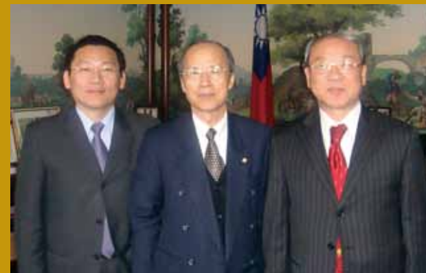
民國98年4月與駐法國呂慶龍大使合影（左一）。