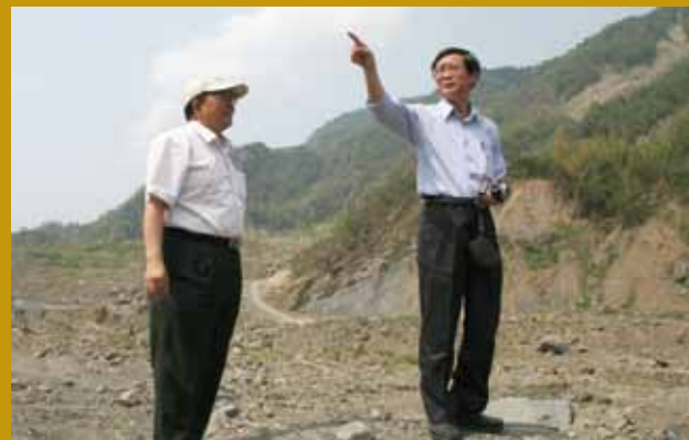
民國99年莫拉克後小林村災後處理。