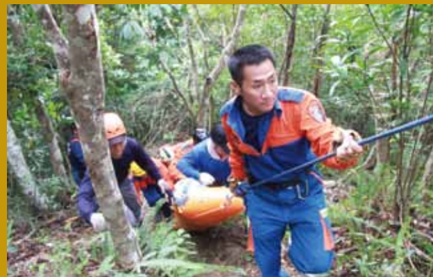
山難救援，運送傷患下山。