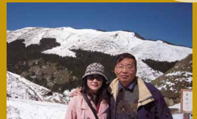
與夫人赴合歡山旅遊。