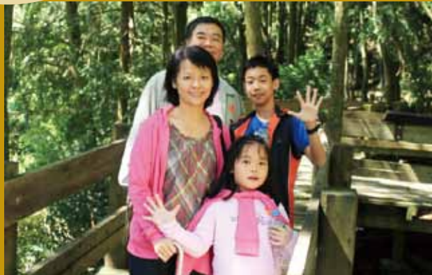
難得與家人享受戶外休閒生活—尋訪雪霸國家公園的神木。