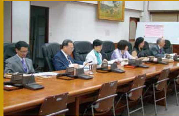
評審委員會第 2 次會議決議實況。