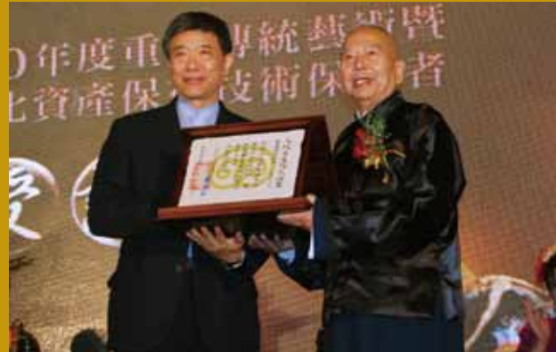
代表文化部，頒發人間國寶證書給吳兆南大師。