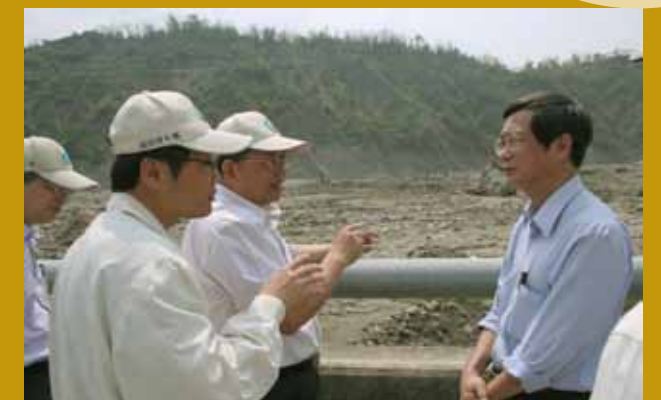
旗山溪疏濬現場（右）。