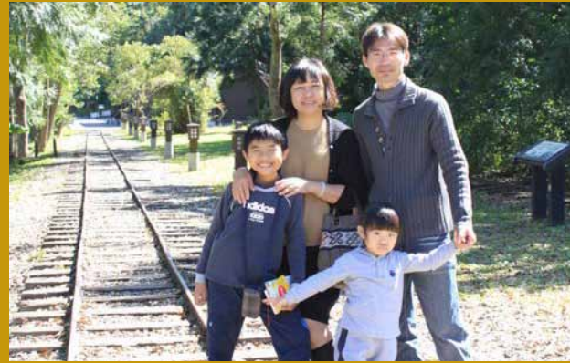
全家出遊於花蓮林田山。