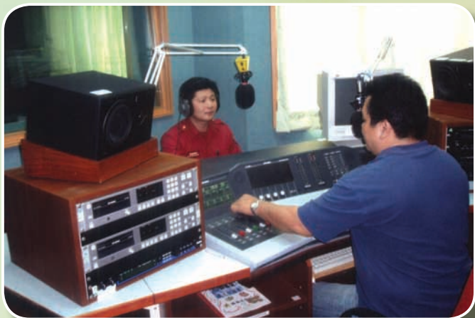
於高雄警察廣播電台宣導防火知識