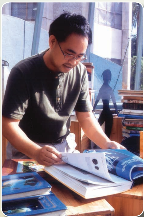
94年辦理「春天悅讀書展」會場佈展翻閱書籍之工作影像

具體實踐於圖書館實務上，如積極開辦與民間合作之大型書展，創組「天人菊故事媽媽說故事劇坊」，培訓說故事志工，催生「澎湖故事閱讀學會」，開發社會資源投入閱讀行列，有效提昇閱讀風氣，同時全面整備全縣公共圖書館閱讀環境與館藏設備等，建立館際書籍流通