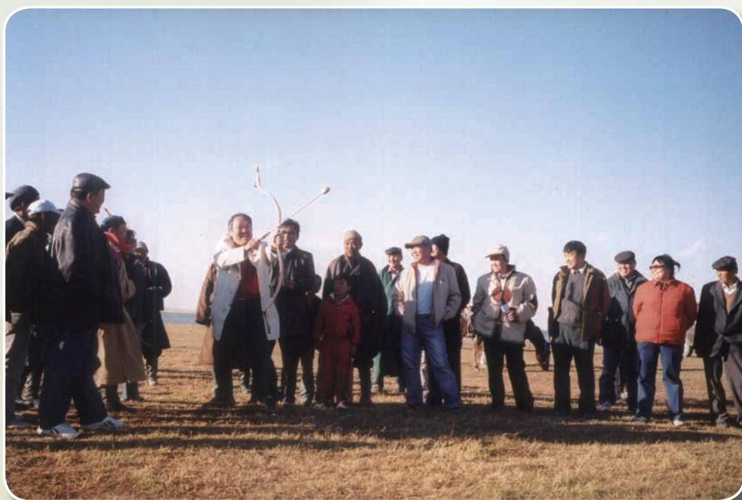
參加那達木大會蒙古男兒3藝的射箭比賽

另安排上述共和國醫生來台受訓及留學生來台學習，並捐贈電腦，以改善其國內各級學校資訊教育設備等。上述交流獲得各共和國朝野及人民的敬佩與感謝，更有助於提昇台灣的國家形象。