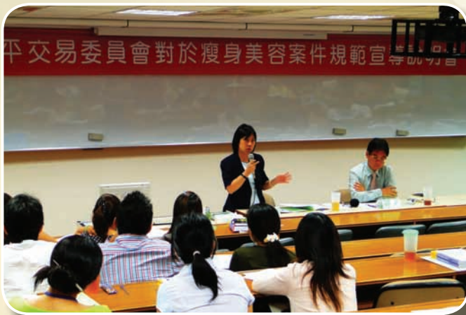
96年舉辦「行政院公平交易委員會對於瘦身美容案件規範宣導說明會」

此次榮獲公務人員傑出貢獻獎，代表多年來她個人及所屬單位同仁的工作成果受到肯定，她歸功於曾一起打拼努力的長官及同仁，也特別感謝家人的支持及所有指導、幫助過她的人。