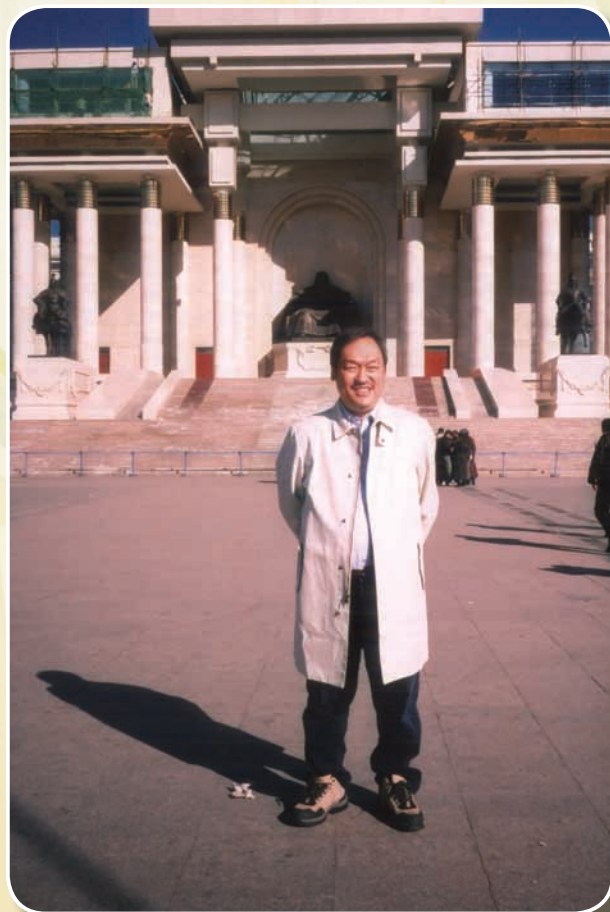
攝於蒙古首都烏蘭巴托市，成吉思汗紀念宮前

此次獲獎，肇始於許委員長對蒙古事務的宏觀視野，對屬下絕對信任及充分授權。再者是工作同仁發揮團隊作戰精神，永不放棄地向目標前進，其中有無數的挫折、淚水、歡笑與肯定的掌聲，謝謝您們！這些都將完全擁抱在生命記憶中。他謹將此次獲獎的榮耀，獻給過世的父母親，獲獎的喜悅將與妻子兒女在溫馨的家中細細品嚐。