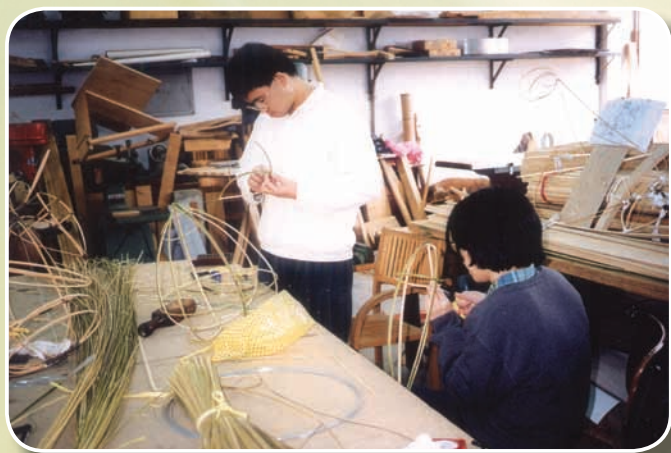
承辦「85年點燈祈福慶元宵」活動製作鼠年主題燈之工作情形

91年底他接任圖書資訊課課長，隨即完成「澎南圖書分館」開館營運之使命。並積極投入澎湖縣公共圖書館整體業務發展之研究，94年撰寫「澎湖縣公共圖書館發展研究」參加縣府自行研究報告獲評獎為甲等，並將研究結果