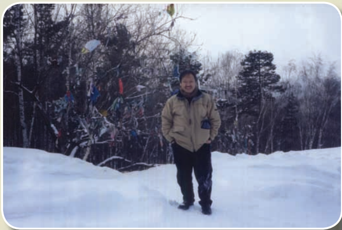
在薩彥嶺的薩滿圖騰，唐努烏梁海，圖瓦共和國

95年奉許委員長指示，規劃協調辦理陳水扁總統發起的「全球新興民主論壇」倡議大會之蒙古專案。96年1月26日陳總統親自主持大會，此次大會邀請到5位外國卸任元首參加，蒙古前總統奧其爾巴特先生是其中一位。陳水扁總統在接見奧其爾巴特先生夫婦及隨行團員時，親自口頭對蒙藏委員會許委員長率領團隊辦理此次蒙古專案圓滿成功給予嘉勉。另，國家安全會議邱義仁秘書