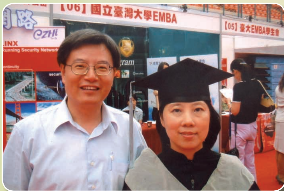
公餘進修有成，順利於94年取得國立台灣大學管理學院商學碩士學位（EMBA）後與夫婿合影

正因為看著公平交易法誕生，參與過每一個條文的孕育過程，當她於81年轉調公平會擔任科長，把以前僅止於文義瞭解之內容，運用於具體個案時，確增添幾許成就感，而她除了對新工作充滿熱忱外，也比別人更多一份對公平會的眷愛與關心，曾於第一處、第三處、法務處服務，累積了完整的限制競爭、不公平競爭及法制工作歷練，經長官拔擢，升任簡任視察、專門委員、副處長及處長。89年她被選派參加行政院中高階主管訓練赴美國受訓，在談到各國經濟發展的比較時，教授不斷提及美國這個超級經濟強國經濟發展過程中，其競爭政策及競爭法的建立是一個很重要因素，令她感到印象深刻，反觀我國競爭法的地位，尚待努力與提