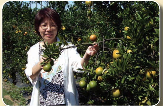
採果樂---吃水果要拜樹頭