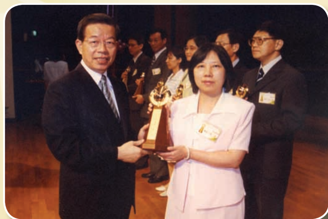
94年獲選為行政院模範公務人員

從小富有正義感的她，大學四年的法學教育，更培養出是非分明、嫉惡如仇的耿直性格。民國70年畢業當年通過高考考試，隔年初便開啟她的公務生涯。過去，大家對公務員的刻板印象是喝茶、看報及聊天，她從擔任公職的第一天，即期許自己要勇於任事，作一個有為有守的公務