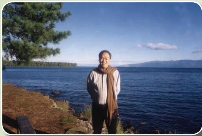
初夏的貝加爾湖，位於西伯利亞的布里雅特共和國

在規劃推動台蒙兩國衛生醫療交流工作，成功的於94年3月協助行政院衛生署與蒙古國衛生部簽署兩國衛生醫療合作協定，此舉亦屬我國與非邦交國之間，以政府對政府方式簽署協定的良好模式。依該協定，蒙藏委員會協助衛生署及相關醫療機構，除了向蒙古提供醫療器材外，每年並協助安排6位蒙古醫師來台接受6個月訓練，另協助安排台灣醫療團赴蒙古進行醫療公衛講習及醫技交流的義診活動，此舉獲得蒙古朝野及人民極大的回響，也促使蒙