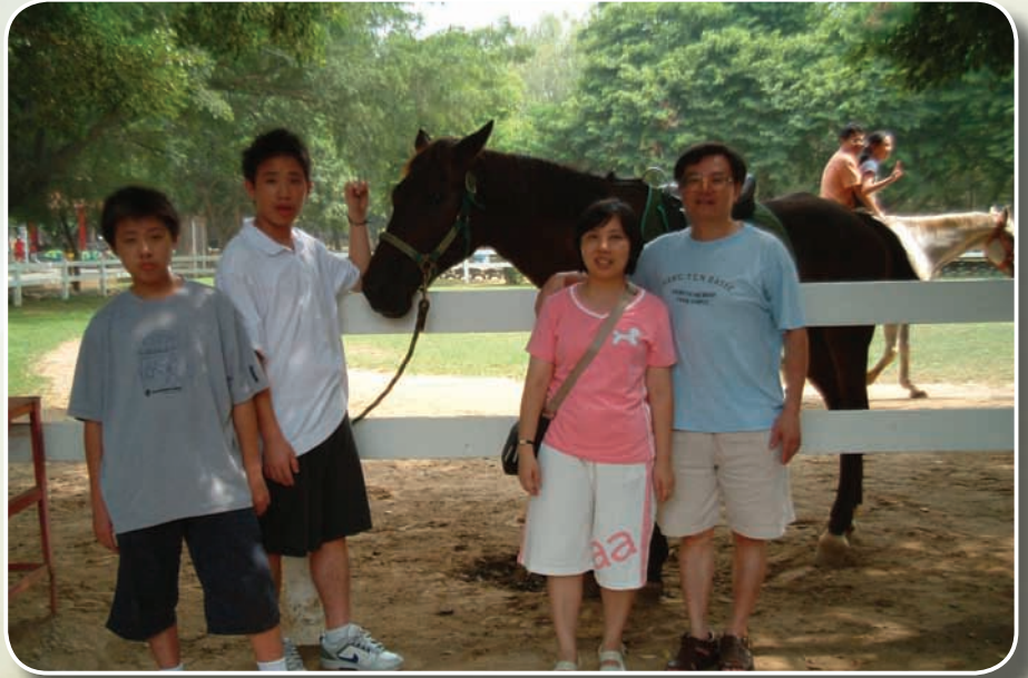
全家福同遊后里馬場，共度午後悠閒時光

昇，而她身為公平會的一員，更感責無旁貸。15年來她致力解除管制及法規鬆綁，促進市場自由化，確立公平交易法為經濟基本法的地位；增修訂公平交易法、相關子法及案件處理原則，增進執法透明化、標準化；建立公平交易行政程序法制，提昇行政效能；執行註釋公平交易法，為我國第一部行政實體法之法律註釋；完成多層次傳銷專法立法之法制作業，健全多層次傳銷之管理；建構知識管理，宣揚公平交易理念，編譯國外競爭法法規，型塑國家競爭願景；推動產業自律，促成公平會由管制型政府轉型為服務型及知識型政府，獲頒第一屆至第五屆法制再造工作圈評選金斧獎、銀斧獎及入選獎，年年獲獎，屢獲肯定；整合產官學資源，創新機關合作模式，有效查處不實廣告，打擊不法多層次傳銷，連續10年榮獲行政院消費者保護委員會消費者服務工作績效考評優等及良等，對於維護競爭秩序及消費者權益，功不可沒。而她個人也因不凡的工作表現，先後獲選為公平會成立週年工作績優人員、公平會85年模範公務人