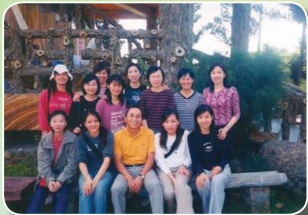
92年南科籌備處員工自強活動，與女性員工合影留念

幾年來，管理局每年都引進20家以上的新投資事業，其中的光電產業聚落是全球最完整的聚落之一。依他保守估計，園區5年內可達成營業額1兆、就業人口10萬人的目標。不過，10年前開始開發南科的時候，沒有人敢做如此樂觀的預估，因為在開發初期，確實有過一段困頓的日子。