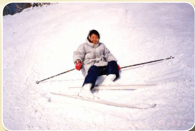
練習滑雪——體驗哪裡跌倒哪裡爬起

她從事農業研究生涯至今20餘年，這次能榮獲公務人員傑出貢獻獎，她把榮耀歸功於所有提攜與信賴她的師長、一起合作奮鬥的同事、一路相互扶持的朋友與關愛她的家人。她希望今後能盡所學，為更多的農民及消費者服務，為國內稻米品質業務之發展更盡一份心力，繼續推動台灣稻米品質的提昇，讓大家安心地吃到安全、營養、又香又Q的好米，以報父母養育之恩，師長教誨之情及國家栽培的恩典。