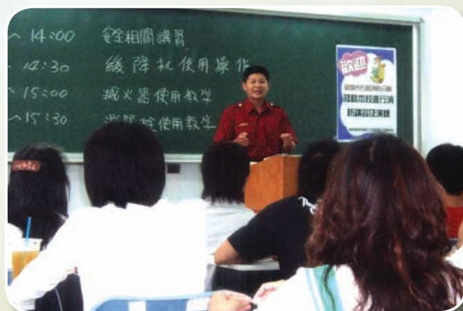
96年擔任高雄大學CPR及防火宣導講師

他秉持盡心盡力，犧牲休假，積極參與，表現優異有目共睹，讓生命更有意義的方法，莫過於對需要幫助的人伸出援手，為民服務的