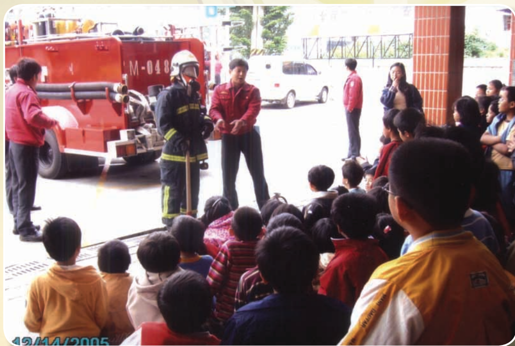
94年擔任防火宣導講師

感覺充實，使生命更有意義，施比受更有福的道理，消防是一生無悔的選擇。此次獲獎，他把榮耀歸功於所有提攜與肯定他的長官、一起對消防打拚出生入死的打火兄弟「警義消、婦宣隊及救難團體」、體諒與支持他的家人，工作的動力來自幸福美滿的家庭，父母、妻子與兒子是他的精神支柱，家庭和樂安康，讓他可以安心投入最愛的消防工作，由於他們的支持與鼓勵在此一併致謝，並期望與消防同仁一起努力，早日達到消防零災害的最高期待，使所有民眾永享地秀水醇的風采。