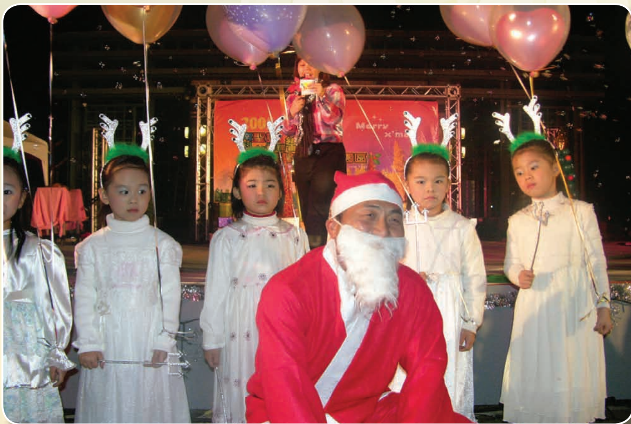
94年耶誕節晚會與表演小朋友一起上台表演

這10年，南科管理局克服了文化遺址、水患和高鐵震動等嚴厲的挑戰，化危機為轉機，將南科塑造成南台灣的科技產業重鎮，響應當年鄉親對南科的熱烈歡呼，也開創了新的園區開發模式，這些努力，能被大家認同而獲獎，全然該歸功於陳局長親愛的傑出團隊，並慶幸能和這傑出的團隊，並肩站在南部產業的轉捩點上貢獻我們的心力和熱忱，這些共舞的日子，成為其一生的驕傲。