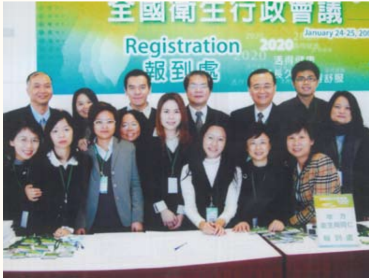
民國97年督辦全國衛生行政會議與工作之同仁合影（後排右三）