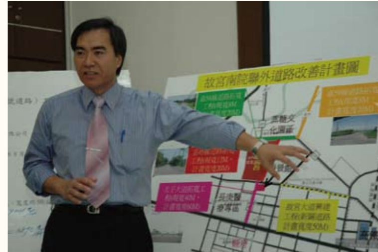
故宮南院聯外道路說明記者會

訓，戮力從公，先後獲兩次模範公務人員表揚肯定，如今又獲得公務人員傑出貢獻獎，對他而言，是榮譽、也是責任。尤其在84年回到故鄉服務，先後爭取及完成垃圾焚化廠及長庚醫療專用區等兩項重大工程，對家鄉的貢獻令他感到光榮與驕傲，而又在因緣際會下，加入紅十字會的公益行列，幫助弱勢家庭，讓自己的生活充滿快樂與精采。他常告訴朋友，如此人生，夫復何求？更期待在退休之後，能成為全職的紅十字會志工。另一方面，其公職生涯由城市到地方，從歷經藍色執政到綠色執政，感受自屬不同，民意更是南轅北轍。他常感嘆，這幾年來政治環