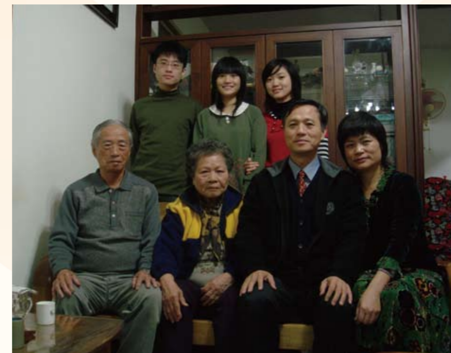
2008年新年全家福合影（前排右二）

由於具有成癮戒治的經驗與專業知識，並汲取國外最新的治療理念，以及擁有一個具執行力的成癮治療專業團隊，使得草屯療養院在過去數年中，陸續提供各項成癮治療