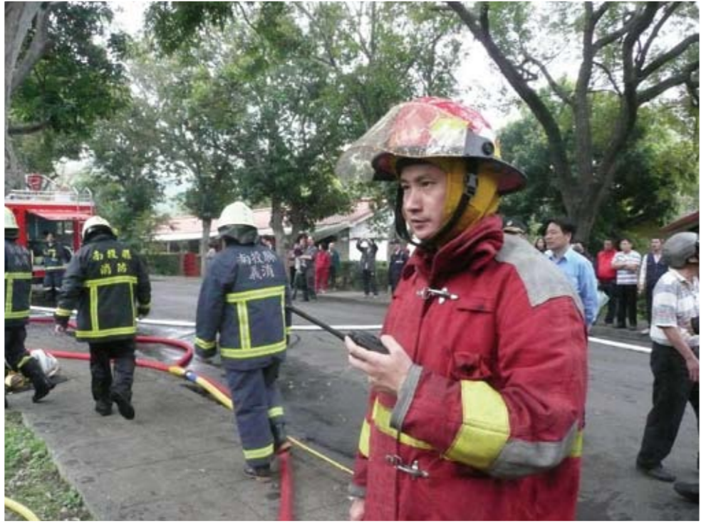
第一時間趕赴火災現場指揮搶救情形