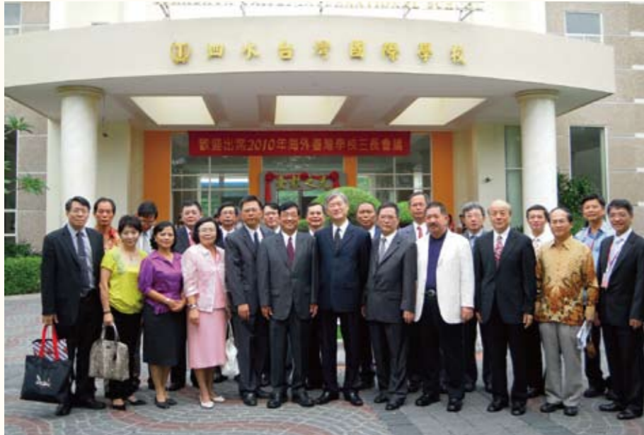
99年第11屆海外臺灣學校董事長校長家長會長聯席會議（前排左四）

執行工業教育、醫事教育、家政教育等專案規劃，使她接觸到各學門之學者專家、學校工作者與教育行政人員，自此打開她的工作視野，也培養她獨立思考、尊重專業，協調合作的工作態度。