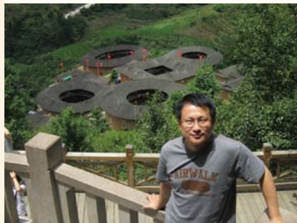
2010年8月16日與檢察官協會參訪福建省檢察院在福建省南靖縣土樓留念

萬元生活費，自行摸索到輔仁大學就學，當時一天三餐只吃學校最便宜的簡餐，每天只花費60元，就這樣第一學期只花了所帶的1萬元。又因家裡經濟來源只有務農，無力繳納每學期幾萬元的學費，只好從大一第二學期開始，以助學貸款方式來繳納學費，並在學校宿舍擔任清掃廁所及接聽電話的工作，每個月可賺取4千多元，再加上領取一些獎學金及姊姊過年給的壓歲錢，每月在省吃儉用下，完成大學學業。而在大學四年期間，每天放學都是留在宿舍唸書到深夜，所以畢業前成績還算不錯，但至畢業前夕感於家中經濟情況，恐無法負擔唸研究所的學費和生活費，為使能延長考國家考試的時間，毅然決定放棄研究所考試而去準備服役時能領取較高薪水的預官考試，並順利考取。大學畢業後便隻身至高雄縣鳳山市的陸軍步兵學校報到，接受為期4個月的基礎訓，並於81年11月底搭了20幾個小時的船至金門擔任少尉排長。