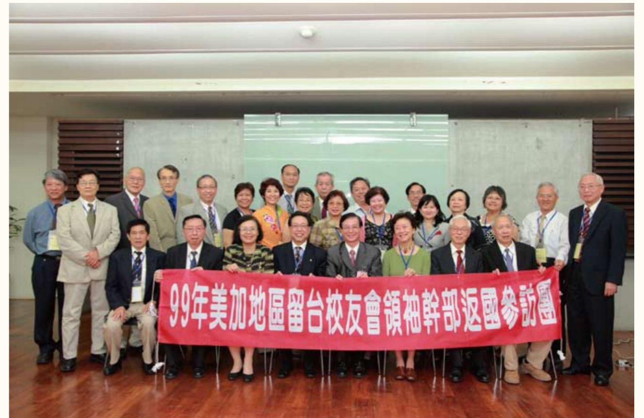
99年美加地區留台校友會領袖幹部返國參訪團到教育部拜會吳清基部長（前排左三）

業；督導921震災災後復建；督導防治SARS相關事宜；擔任1999年全國教育改革檢討會議議事組副組長，及協辦全國教育發展會議等工作，因辛勞得力，績效良好，多次獲得記功或嘉獎的嘉勉。5年3個月的副司長職務，使她對教育行政的運作有更深刻的體驗，並從歷任主管身上學到不同的領導風格、待人處世的方法及溝通協調的能力。