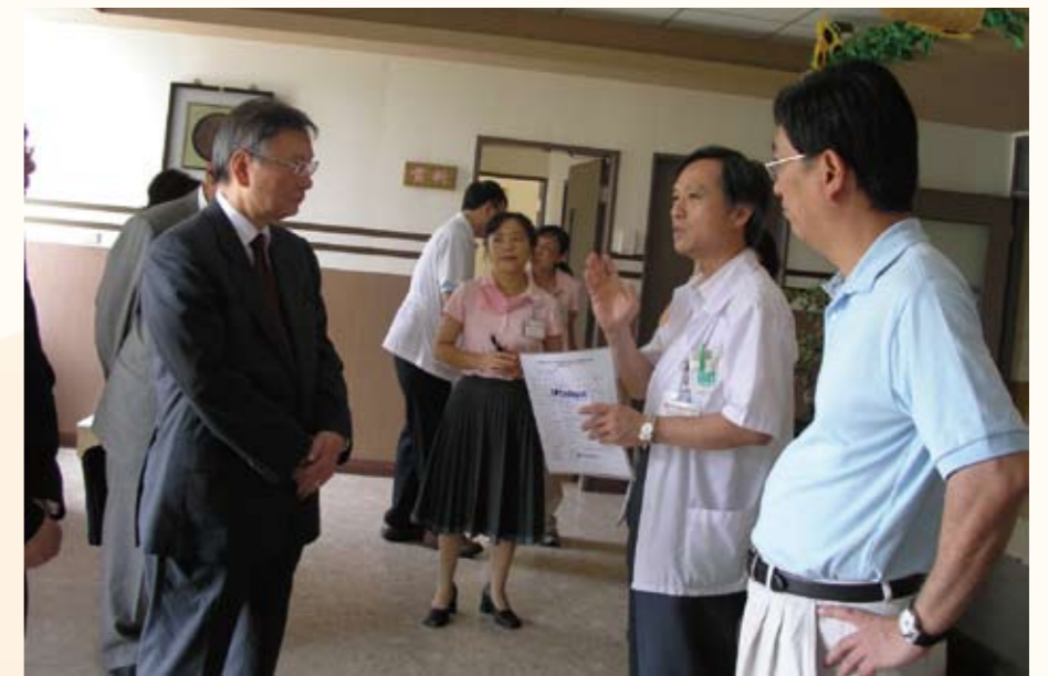
為參訪茄荖山莊貴賓解說（右二）

模式。民國95年4月17日接受衛生署長的指示，由草屯療養院成癮治療團隊進入臺中戒治所，提供司法體系內的醫療處遇模式，開啟了司法與醫療合作，並於監所內提供『毒品戒治醫療處遇本土模式』。民國95年9月31日草屯療養院開始提供美沙冬替代療法，為中部地區第一家提供美沙冬替代療法的醫院，更於96年2月在法務部與衛生署合作下，開辦國內醫療機構中唯一的物質濫用