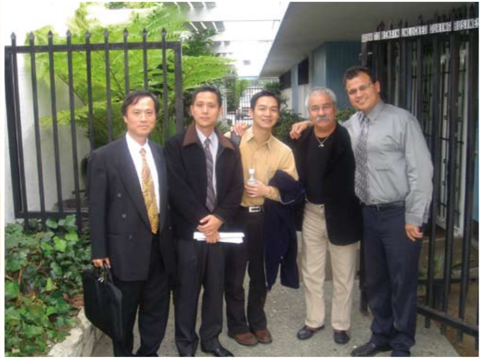
美國成癮治療參訪 (左一)