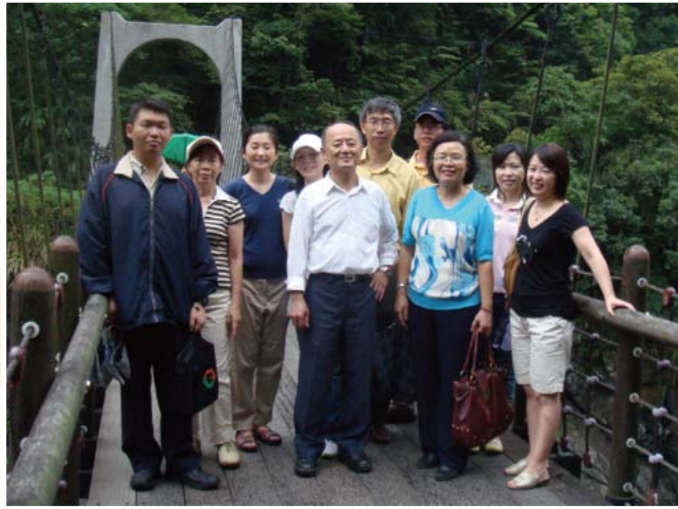
98年僑教會同仁小型郊遊於烏來合影（右三）