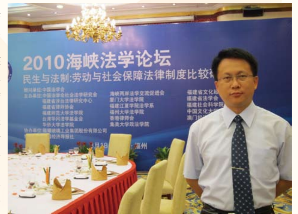
2010年8月17日至福建省福州市參加海峽兩岸法學論壇會議

「將相本無種、英雄不怕出生低」，每人要出生在富有或貧困家庭都是命中注定，是無法去改變的，但只要肯努力，縱使起跑點落後別人，也可迎頭趕上，而且所獲取的果實是更加甜美。「身在衙門好修行」，當一位檢察官其價值性並不是在於能承辦多少受矚目的案件來成名，而是在於能做多少對社會有貢獻的事，堅持自己理念，做自己該做的事，那你就是一位盡責的檢察官。