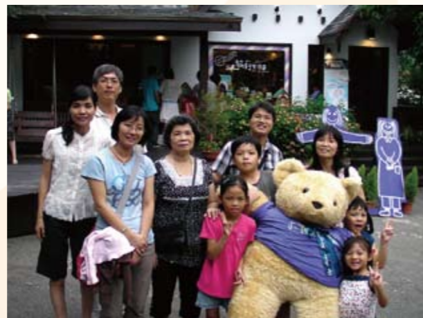
家族於薰衣草花園合影（後排右二）

能，自95年起開始構思開發【高雄縣道路挖掘管理系統】，期望透過導入GIS資訊化管理系統，全面掌握道路管道挖掘（申請、核可、施工、稽核、竣工、保固）等各階段之施工動態，並透過即時網路平台，受理道路挖掘申請，達成挖掘流程標準化、無紙化之效益。系統在96年1月1日開發完成正式受理網路申挖後，大幅提昇了高雄縣政府管道挖掘申請管理效能，挖掘許可平均日數從未資訊化前約7天，到98年度平均天數降低為1.58天，行政效能大幅提昇78%。96~98年度陸續整合仁武、鳳山、大寮、岡山與大社等5公所，大幅提昇鄉鎮公所管理道路效能。97年度主動拜會公路總局第三區養護工程處，成功促成縣府與公路總局合作共同建構【高雄縣公路挖掘資訊網】，是全國首創整合（省道、縣道、鄉道、市區道路）道路挖掘作業，涵蓋縣府、公路總局、鄉鎮市等中央到地方跨機關整合的單一窗口平台。