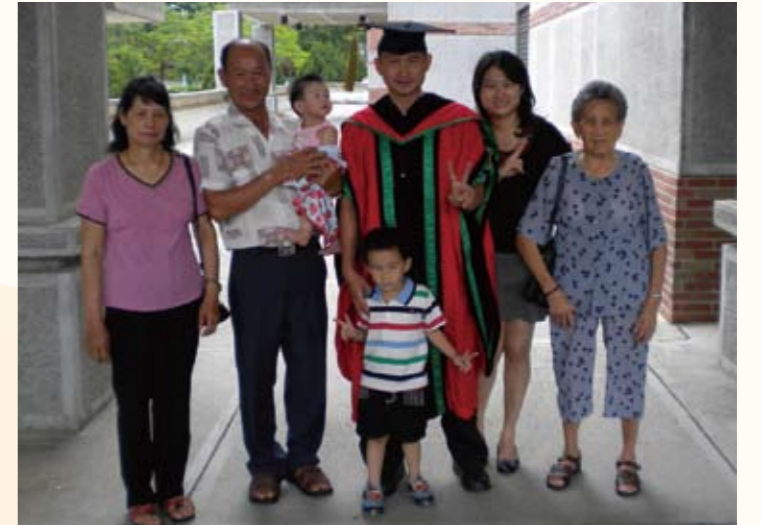
2010年取得國立中正大學犯罪學博士學位之畢業典禮全家福合照情形（右三）

也因為由於任職期間個人工作态度認真及表現優異，更獲機關推薦甄試獲選國際扶輪社3460地區2006-2007年GSE（Group Study Exchange）訪問團代表（與美國北密西根及威斯康辛州6220地區交換訪問一個月），後又經南投縣政府推薦榮獲96年度行政院全國模範公務人員（全國60位）殊榮及99年度全國青年獎章殊榮（全國12位）。今