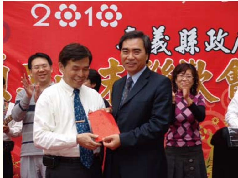
縣府歲末聯歡活動頒獎（右二）

麼，像什麼」的做事原則及善心人士支持與志工無私奉獻下，這幾年來業務不斷擴展。尤其為幫助弱勢學童順利求學，吳秘書長於