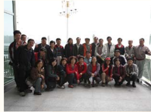
與同仁合影（後排右八）

繼往開來，保訓會組織法的修正及國家文官學院的成立，只是一個建構未來我國完整公務人員培訓制度與體系發展的開端。21世紀是知識經濟的世紀，在知識快速更新下，人類面臨的環境更形複雜，政府管理的廣度及深度空前擴展，出現許多新的公共議題。現代化政府於回應內外環境變遷之際，必須積極培訓公務人員，以提高人力素質。我國在推動公務人員法制及培訓政策與業務方面，邱處長認為，必須秉持「積極前瞻、追求卓越」的理念，進一步健全公務人員培