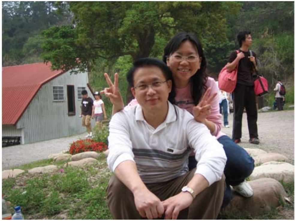
於苗栗縣飛牛牧場與夫人合照