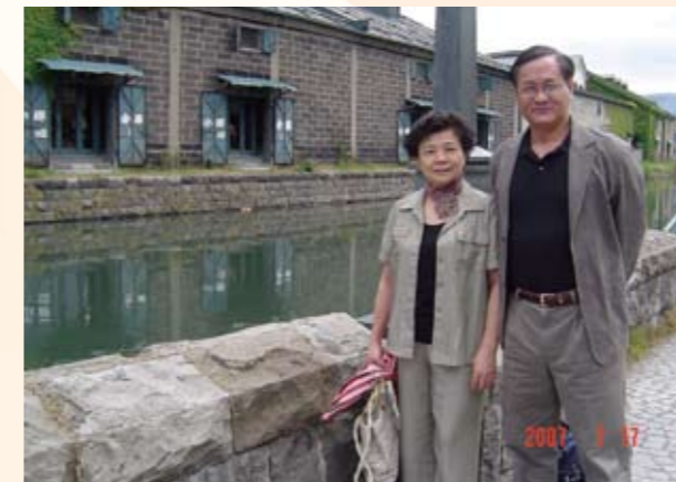
年度休假與妻赴日本旅遊陶冶身心，留影於北海道小樽運河（右一）

自民國82年開始的8年期間，在計畫團隊同仁竭智盡力的團結合作之下，其推動應用先進系統整合科技，並有效考察、吸收先