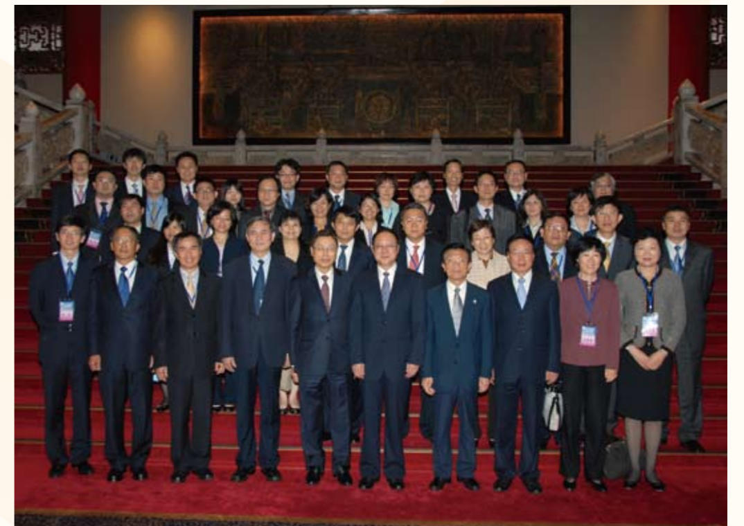
圓山飯店第一次預備性協商（第三排右五）

她從事公職迄今18年，辦理兩岸經貿業務，未來更面臨ECFA的執行與後續4項協議的協商業務。ECFA已經在今年9月12日生效，當務之急就是要籌組「兩岸經濟合作委員會」，落實早期收穫的效益，藉由ECFA的實際成效，爭取國內民眾對政府兩岸政策的支持。馬總統曾將ECFA比喻為前菜，主菜是後續的投資保障、爭端解決、貨品貿易及服務貿易等四項協議。ECFA依規定要在生效後的六個月內，展開後續四項協議的協商。這些工作雖然相當艱難，但她仍以兩岸ECFA協商人員經常用來彼此鼓勵的一句話自許：「以從事這件兩岸歷史的大事為榮」，希望在未