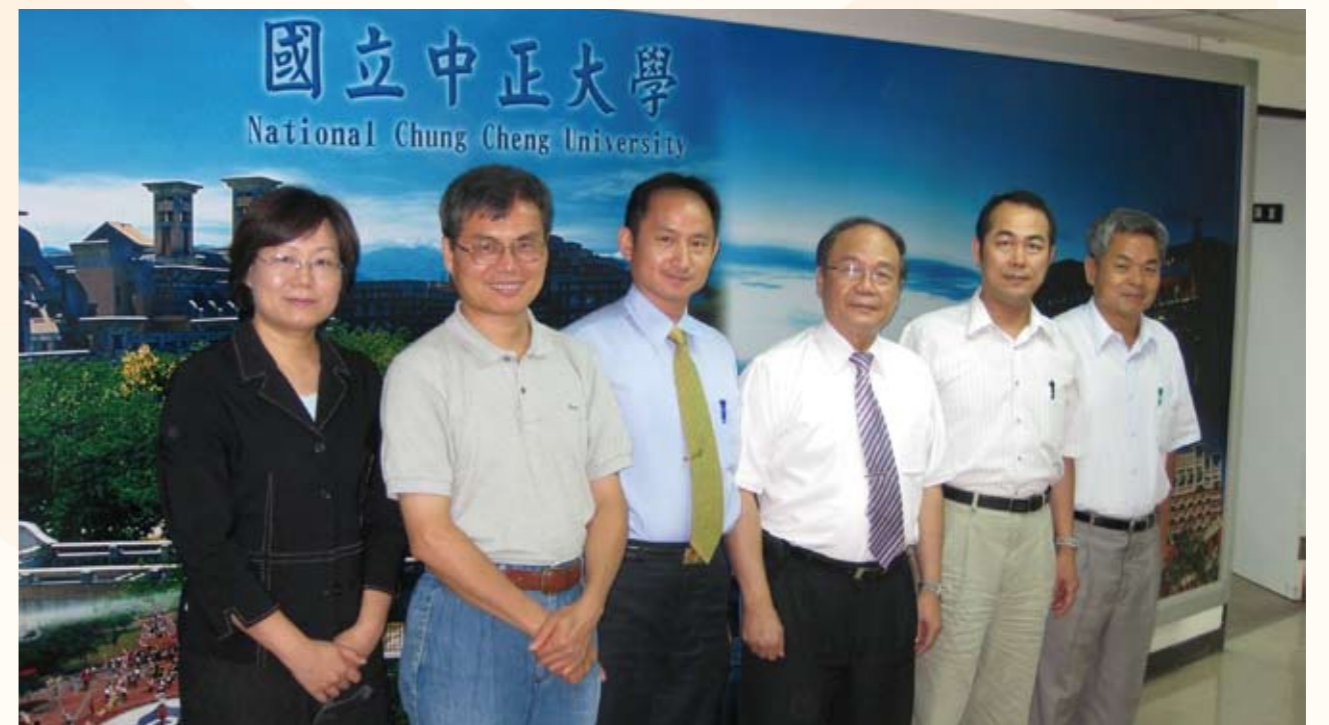
2010年通過國立中正大學犯罪防治研究所博士學位口試與全體委員合影情形（左三）

日的獲獎亦讓他更加認定這份「鳳凰情，天使心」的神聖工作是非常值得，雖然消防工作是屬於「水裡來，火裡去」的工作，往往是民眾愈想脫離的危險處境，卻是我消防人員必須愈深入搶救的前進目標，如今他能獲獎，僅是代表消防人員身份獲頒這個獎項，亦象徵社會大眾對消防工作的肯定與鼓舞，最後，僅以最誠摯的心將此公務人員最高榮譽獻給無時無刻為社會大眾默默付出的全國消防人員。