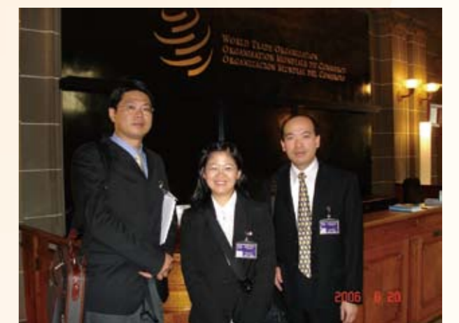
出席毛中案諮商—WTO（中）

慮。此時，她在長官帶領下，積極瞭解WTO的法規與實務運作，並進一步研析中國大陸的入會承諾以及履行承諾的情形，對國內民眾及廠商提供兩岸入會的商機與影響等資訊，包括：入會後兩岸經貿政策調整規劃、辦理兩岸經貿安全預警制度的貿易監測系統業務、持續關注大陸入會執行承諾情形，參與WTO檢視中國大陸執行入會承諾的過渡性檢討機制工作等，進一步瞭解中國大陸經貿體制與國際經貿法規的關係。這一段時期的研究與宣導活動，使她有機會走遍全省，針對個別廠商的切身問題，提供政府的協