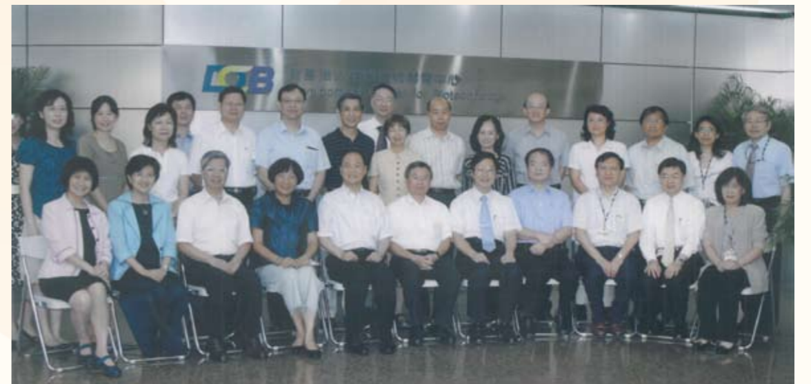
民國99年前往汐止生技中心參加衛生機關聯繫會議（前排右四）