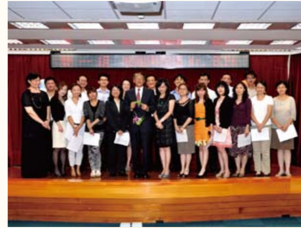
國貿局雙邊貿易一組歡送黃前局長（前排左五）

考。兩岸經貿業務內容與時俱進，不斷充實專業職能，已經變成勝任工作的必要條件之一。在這方面，她不斷參與陸委會辦理的兩岸政策研習、貿易局委託中華經濟研究院、中華民國全國工業總會等專業機構的研究案及各種宣導活動，從參與過程中吸收了許多專業知識。而兩岸經貿業務內容繁雜，涉及的政府部門包括貿易局、陸委會、工業局、財政部關政司、農委會等貨品貿易相關機關；服務貿易更涉及全國各部會40多個司處局，業務聯繫網路相當重要。她作為幕僚單位成員之一，從以往的業務聯繫到ECFA的協