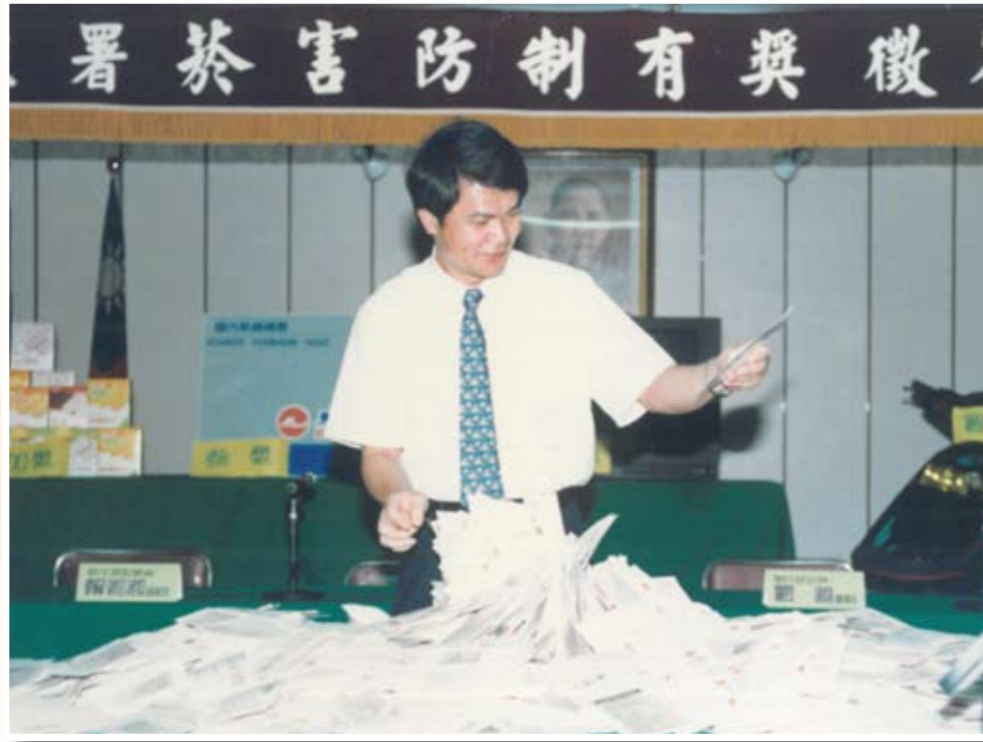
民國82年主持衛生署之菸害防制有獎徵答抽獎活動