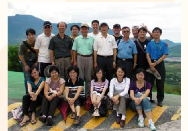
重建會聯席會議成員合影（後排右二）

成功大學畢業後，進入臺灣大學土木工程研究所碩士班攻讀大地工程。在臺灣大學的求學過程讓他信心大幅躍升，臺大有濃厚的學院風氣，系上教授給予的繁重課業壓力，還有優秀的同學互相比較與激勵。其中最關鍵的是，指導教授 吳偉特教授的論文指導。吳教授不是直接指定題目，而是指導他去探索找出想要深入研究的方向與題目。臺大這種對自我嚴格要求與負責的壓力氛圍，和互相激勵學習的環境，塑造了他日後在工作上自我要求，不以現狀為滿足，並隨時構思在現況中尋求突破的工作哲學。在研究所時期，努力地壓縮自己時間，以更有效率的時間分配，來兼顧多方面的工作挑戰。民國八十五年，以榜示第一名的成績考取【大地工程技師】執照，並以全班論文成績第五名成績畢業。