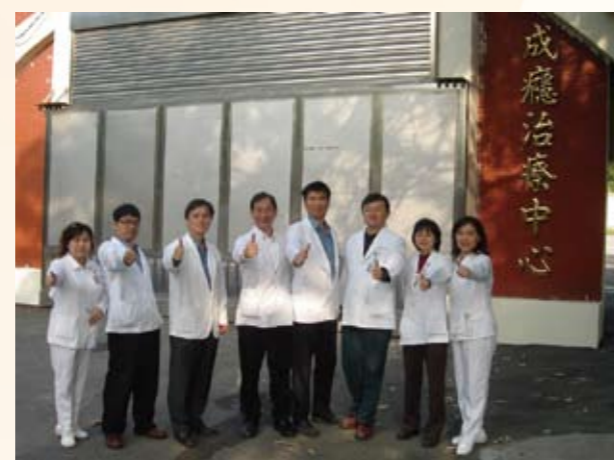
成癮治療團隊（左三）