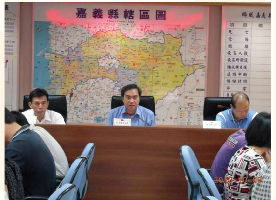
主持地震演習協調會議（左二）

之人是負債。而用人亦應有宏觀格局，期能廣納百川，為民造福。他也發現基層公務人員的熱忱似乎在遞減當中，年輕人進入政府部門為民服務已不再是興趣與抱負，反而只是糊口的工作而已。這種危機與隱憂是我們必須去正視的，而如何喚起並激發公務人員工作的熱情與理想，更是不容忽視的嚴肅課題。