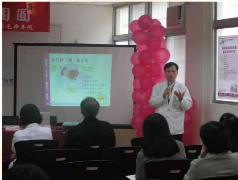
藥癮個案回娘家（茄荖山莊）活動

雖然民國82年政府提倡『向毒品宣戰』的政策，醫院也提供治療服務，但當時法律要求煙毒犯至醫療院所接受治療須取得『斷癮證明書』，方可在司法判決上獲得減免刑期。因此，當時到醫院治療的煙毒犯其目的在於取得醫院開立的『斷癮證明書』，而非真正想接受治療。於是，在想拿到『斷癮證