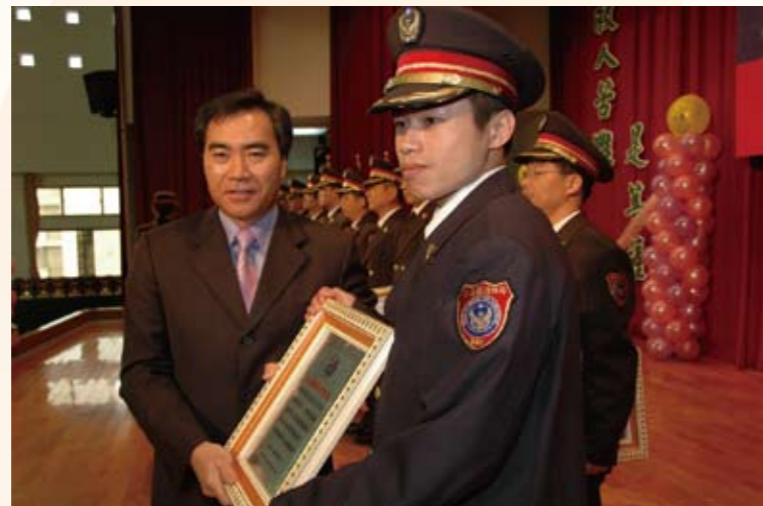
消防節表揚大會（左一）