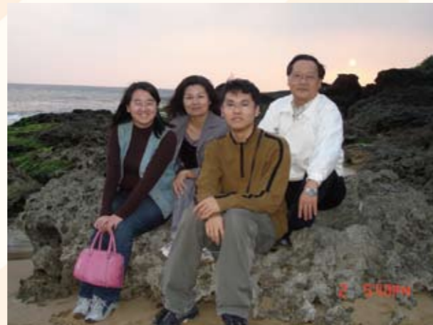
與家人海濱合影（右一）

六、建置公務人員考試錄取人員線上申辦及查詢作業系統等業務，落實服務便民理念，針對考試錄取人員辦理保留受訓資格、補訓、重新訓練等申請案，除了傳統郵寄書面資料仍予維持外，新增e化申辦管道，申請人可隨時線上鍵入相關資料提出申請，並可即時進度查詢，迅速得知申辦進度及核准情形，提昇機關專業形象。