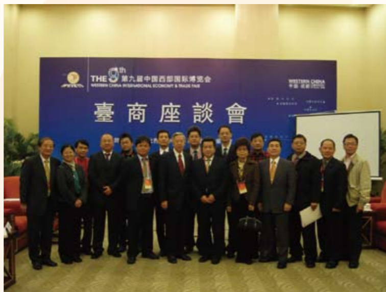
大陸台商座談（左二）

自97年下半年中國大陸爆發毒奶粉事件以來，有感於臺灣食品具有安全、美味、健康等優質因素，在長官指導下，洽請外貿協會儘速籌組優質食品拓銷團赴中國大陸北京、上海等地促銷我優良食品，且於98年推廣至二級城市，在全球金融危機的不利局