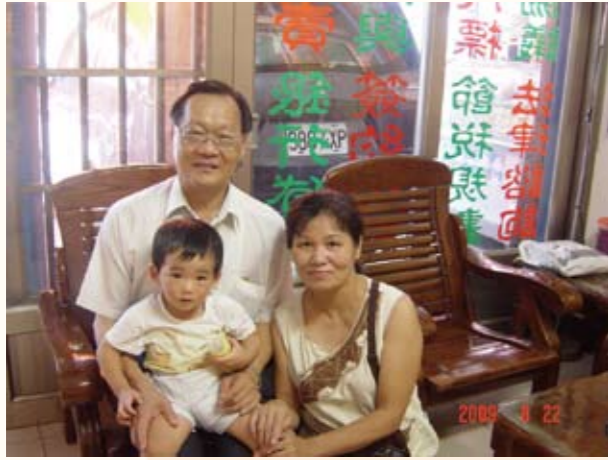
走訪親友合影（左一）

建立公務人員生涯學習體系、兼顧區域教學平衡等任務。對我國公務人員培訓制度及國際化的推動，具有實質且深遠的影響。