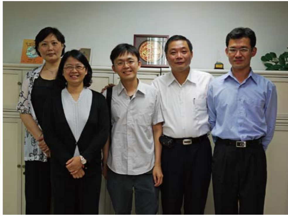
歡送國貿局內服務之替代役人員退伍（左二）