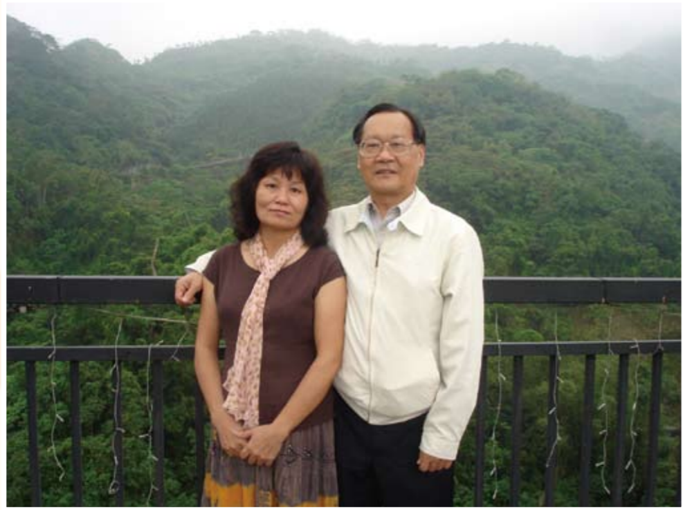
與太太於關子嶺合影（右一）