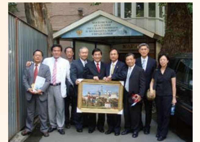
考試院考銓業務俄羅斯聯邦考察團於莫斯科公務訓練學院（左一）