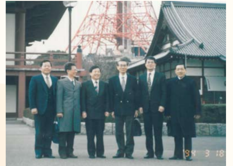
民國83年隨團赴日考察該國醫事人員人事任用制度（右二）

做一個公務人員，他覺得很榮幸，因為古人曾說過，人在公門好修行，他曾經很認真的想過，企業家蓋醫院想要救人生命，但民眾沒有錢依然無法就醫，慈善家捐鉅款想要幫助別人，但受惠的民眾總是相當有限。公務人員就不一樣，規劃開辦全民健康保險，一下子解決了2千3百多萬民眾無錢就醫問題，努力落實傳染病的防治，全面推廣癌症篩檢工作，受惠民眾，成千上萬。所以說要修行、積功德、做好事，公務人員最容易，大家應該知所珍惜，凝聚智慧奉獻心力！