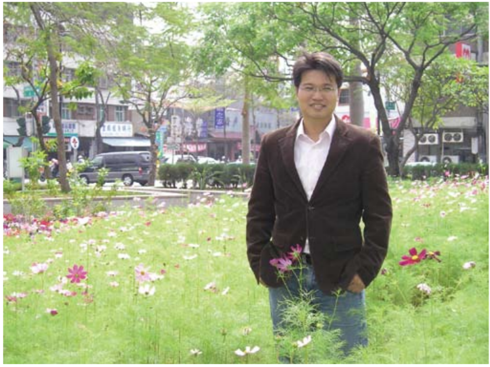
於高雄縣政府前留影