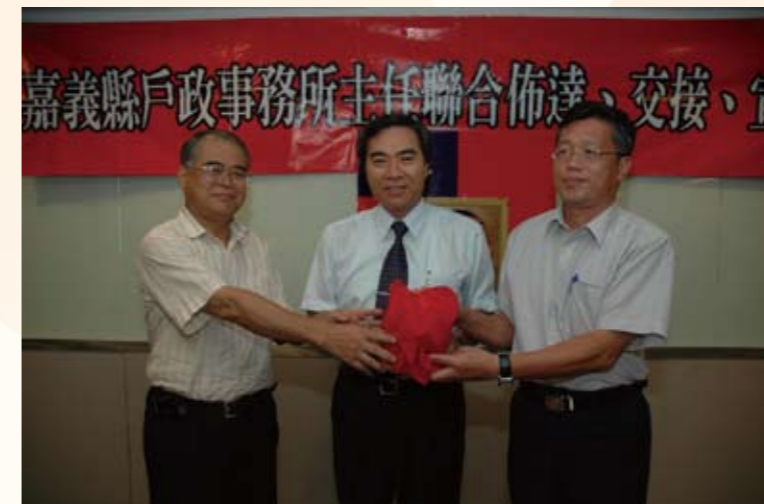
主持戶政所主任交接典禮(右二)

另外，在人生際遇中，最令他感到慶幸與感恩的是，在89年底接到中華民國紅十字總會陳長文會長及秘書長陳豐義先生（現任監察院秘書長）電話，邀請籌組該會嘉義縣支會。基於紅十字會博愛、人道、志願服務的宗旨暨考量公益慈善服務與公務並無衝突，又可相輔相成下，欣然答應。支會於90年3月成立，並擔任支會會長，迄今已近十年。在秉持「做什