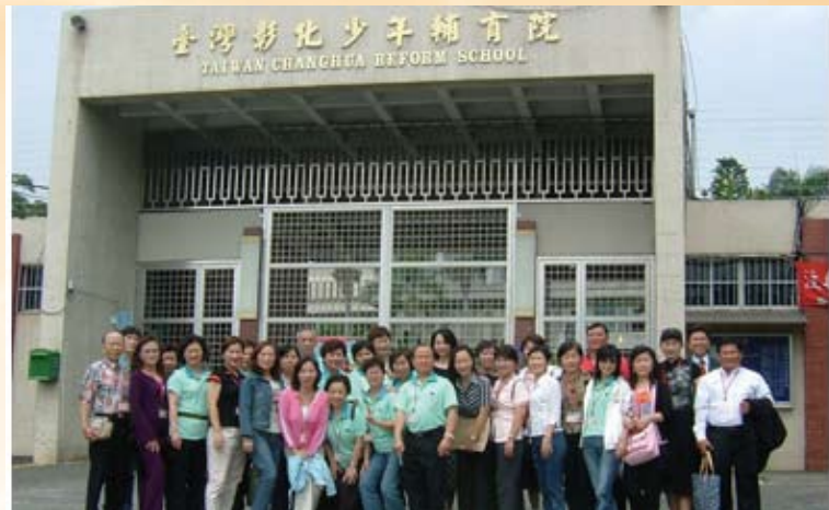
少年輔育院關懷內部成員團體照。

長久以來，洪理事長將「做事要用心，做人憑良心」這句話奉為圭臬，並身體力行以達到拋磚引玉的目的。