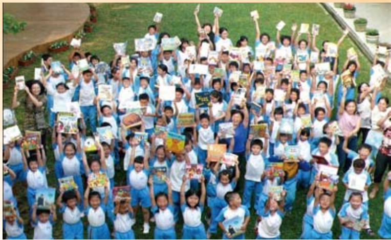
七年來，「希望閱讀」計劃累計捐贈超過130,000冊的新書。

1982年，《天下雜誌》創刊的第一年，即提出「人力即國力」的主題，呼籲各界在關注國家競爭力之際，更要重視未來人才的培養。1996年開始，《天下雜誌》製作《海闊天空》教育特刊，每年根據國際趨勢與臺灣需要，企劃製作教育專題，持續為臺灣教育提出新觀點與新視野，全面深度探索教育體系的運作與管理，為臺灣的希望工程開啟一扇世界的窗。