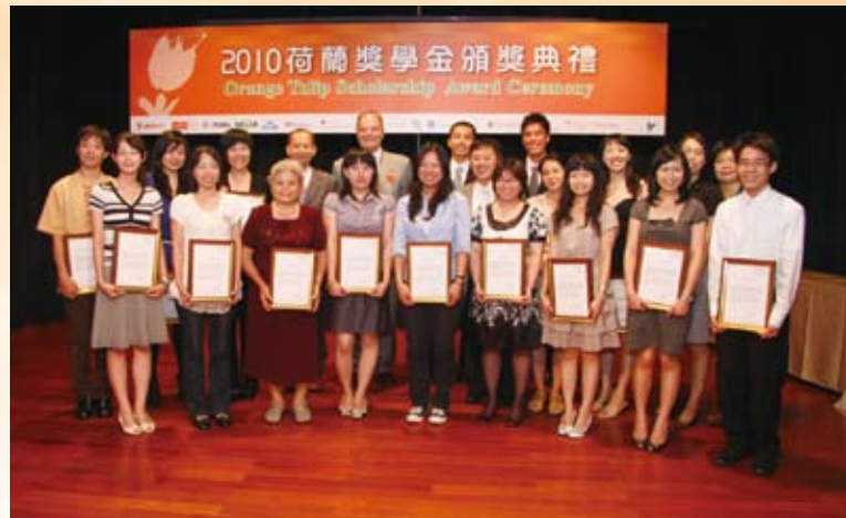
台達環境獎學金（NTIO/BTCO）自2005年起，已有40名學生受基金會贊助，前往英、荷等地修習環境相關碩士學位，陸續回國貢獻所長，並成為國內綠領人才的生力軍。

在人才培養方面，基金會已經與荷蘭以及英國兩國在臺辦事處合作推出環境獎學金，鼓勵優秀青年赴歐洲汲取先進的環保觀念以及策略。