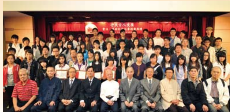
行天宮人文獎頒獎典禮（得獎者與評審教授合影）

基金會不遺餘力推展新知識的學習，但也注意到在社會急速發展過程中，身心靈健康的重要性，因此本會於民國97年開始著手推展「行天宮精神醫學」計畫，舉辦一系列講座、失智症家屬情緒管理研習課程，出版銀