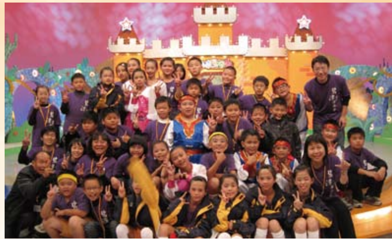
99.11.30公視「台灣囡仔讚」錄影錄影

該校以「碧竹修園師德育才俊、潭深月明博愛啟鴻學」為學校經營及發展之圭臬，希望形塑「健康謙卑」（碧竹）之學子，建置「綠色永續」（修園）之校園，重視教師及學生之專業發展（師德），發展特色課程（育才俊），包括現代媒體及傳統車鼓課程，並努力深耕社區（潭深），重