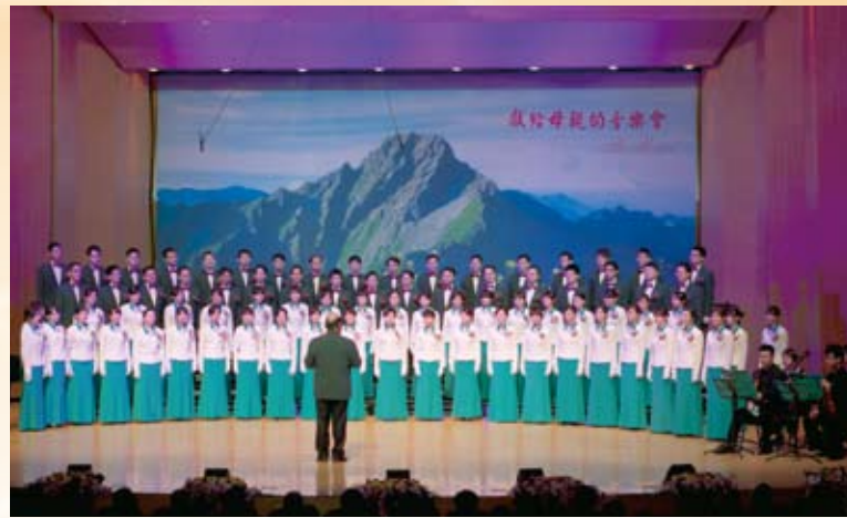
母親節前夕，玉山舉辦For Mother～獻給母親的音樂會，歌詠母愛的慈暉。

除了推動閱讀之外，在深耕學術方面，為積極協助並提升國內管理領域研究水準，玉山文教基金會亦與玉山銀行共同捐贈設立「玉山學術獎」，鼓勵國內臺灣大學管理學院教授於國際一流TOP3期刊發表學術論文，提升國內優秀管理學術水準，為國家社會注入正面積極的力量；在體育活動方面，為培育更多的棒球好手在球場上發光、發熱，玉山文教基金會並參與玉山盃全國青