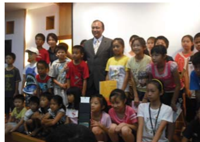
1.辦理教育部夜光天使點燈專案計畫，國小夜光天使學童有25名。99.12.20，縣長夫人、校長蒞臨參加慶生會活動合照。 2.100.07.10羅東鎮100年犀利暑期藝文活動，鎮長前來關懷學童，與學童合影。 3.100.07.21萌萌小記者30人至宜蘭縣政府訪問縣長林聰賢。採訪活動結束，學童與縣長合影。