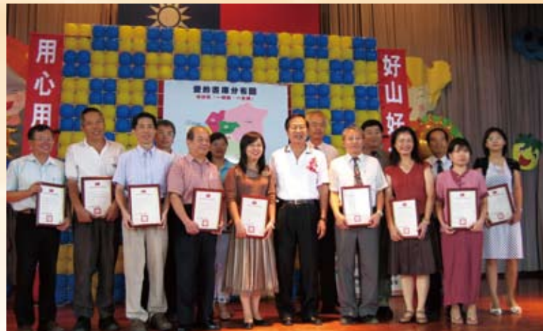
2007年10月，南投縣率先完成「一鄉鎮一書庫」設置規劃。

5. 閱讀教學觀摩影片下載：拍攝閱讀教學觀摩影片，將教學現場真實狀態，供閱讀教學教師參考。