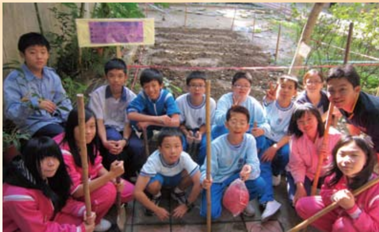
螢橋國中一百荷花復育植栽。

財團法人法鼓山文教基金會（網站www.ddm.org.tw），成立於民國81年3月17日，依循創辦人聖嚴法師之理念，在現任董事長果東法師的領導下，以佛法的社會教育為宗旨，以提昇人的品質、建設人間淨土為職志。佛法的教育，是一種全人的教育，能帶給人們智慧與慈悲，能使人間成為健康、和平、和諧的社會。