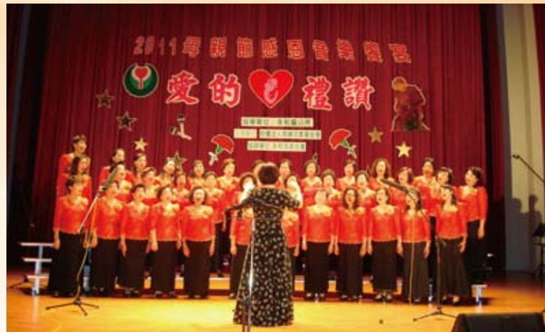
愛的禮讚母親節感恩音樂饗宴

過去該會的努力廣受政府與地方各界人士的肯定，而如今慈暉散播愛心、關懷社會的使命依然保持當初創立的熱忱前進著，希望結合慈暉志工團隊、前仆後繼的社會熱心人士們以及十幾載的努力經驗，將慈暉關心社會的心情，深入全國各大鄉鎮市區，將溫暖散布到社會上每一個人的心中，使大家真正關心周遭的人、事、物，伸出雙手給需要幫助的朋友。