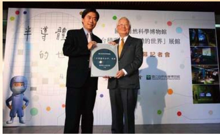
2011 台積捐贈全新「半導體的世界」展館予臺中科博館。

為提昇國人精神生活，台積長期推廣藝文。基金會成立之初，即開啟企業大規模贊助藝文的嶄新模式，協助「雲門舞集」等藝文團隊永續發展，使國內藝術與企業的合作更為蓬勃多元；積極投入文化資產保護，如捐贈修復「前美國駐臺北領事館」為「台北光點」，引發各界對古蹟活化再生的高度關注。同時持續贊助國內藝文團隊，提供揮灑舞臺外，更邀請世界級展演如「柏林愛樂管弦樂團」、「古希臘人體之美—大英博物館珍藏