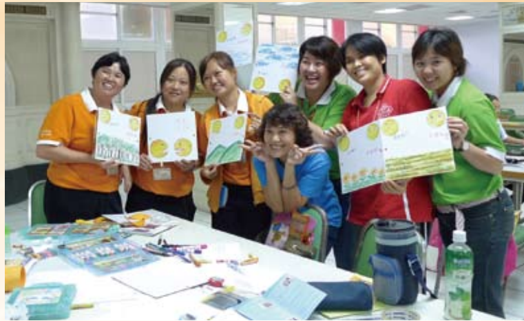
承辦生命教育兒童班義工老師知能成長營—兒童繪本研習。

財團法人人間文教基金會於1998年8月5日完成設立登記，以推動興建「佛陀紀念館」，發揚「人間精神」，將慈悲、智慧、道德融入社會大眾生活之中，推廣心靈建設，促進人際和諧，提昇人格教育及生活品質為宗旨。