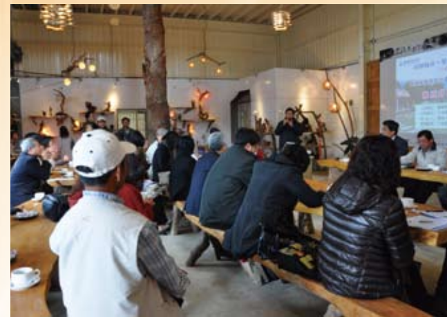
1.向教育部社教司柯司長正峯及各縣市執行團隊簡報分享執行經驗。

賴校長認為學校與社區是生命共同體亦是學校經營的夥伴關係，同時學校也肩負著社區社會教育的責任與功能，期盼學校能成為社區發展的燈塔，協助社區永續發展共存共榮！