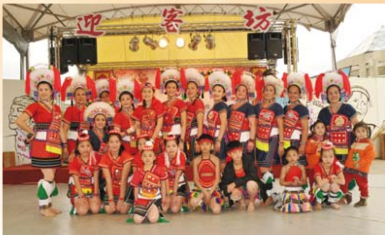
100花博—文化團隊演出。

在這急速變遷的大環境，居住於原鄉部落花蓮、臺東的阿美族族人因為就學、就業，甚至是異族通婚，不得已遠離家鄉，大量移居至都會區生活，致使下一代疏離了自己部落的母文化，無法流利地說出族語、甚至根本不了解自己的文化及來自何方，不由得令人心生揮之不去的憂慮……。