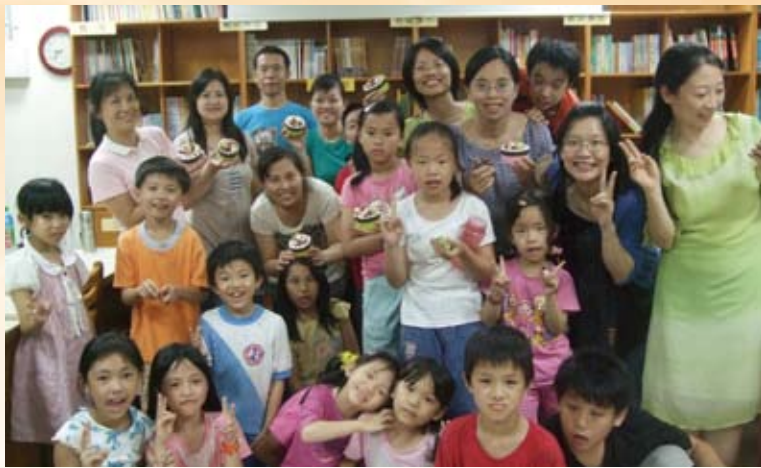
安排一系列體驗課程凝聚弱勢親子關係，圖為創意奶油土DIY。

民義國小位於三峽區白雞行修宮附近，地處偏遠資源不足、經濟不利之弱勢學區，學校整合校內、引介校外之人事財物資源，成功營造出學校教育各項特色，積極推動各種社會教育活動，帶動社區的發展，營造溫馨善良的社會風氣。