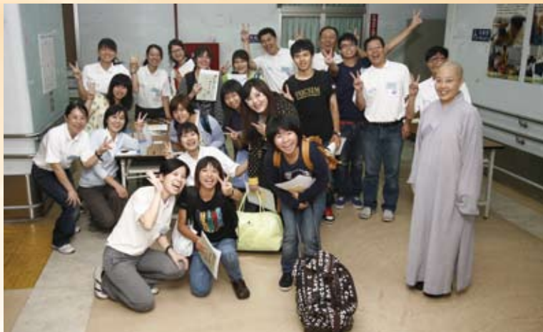
重視大專青年生命教育及志工培訓。

成 長在天主教家庭的大愚法師從小在宗教關懷洗禮下，服務、奉獻的情操深植心底。入佛門後更以「文化、教育、關懷」的理念入世行腳，並於2001年12月30日以35,000元和無私奉獻的服務熱忱創立「社團法人中華民國雲水蘭若文教協會」。