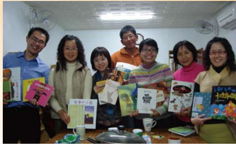
愛鄰協會志工讀書會—分享閱讀繪本的喜悅。

服務，然而卻無法持續於同一地點長期服務，為了彌補行動圖書館無法時時定點服務的限制，讓孩童課後依舊提供圖書閱覽服務，結合愛鄰協會五個據點（線西鄉、伸港鄉、二林鎮、秀水鄉、北斗鎮）的弱勢課輔班資源，募集圖書增設「社區圓夢圖書室」，讓悅讀的種子遍地開花。