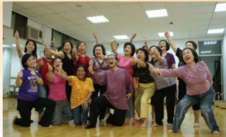
親自帶領一輩子劇坊學員上戲劇課，大家都說讚啦！

學習，而有機會展現課程方案企劃與志工組織運作的能力；並在規劃執行及實踐體驗的服務歷程中，有歷任校長與同仁的鼓勵支持，以及來自於樂齡志工與學員的成長回饋，促成其個人生命在創意的激盪中亦不斷的成長，並且有所體悟：