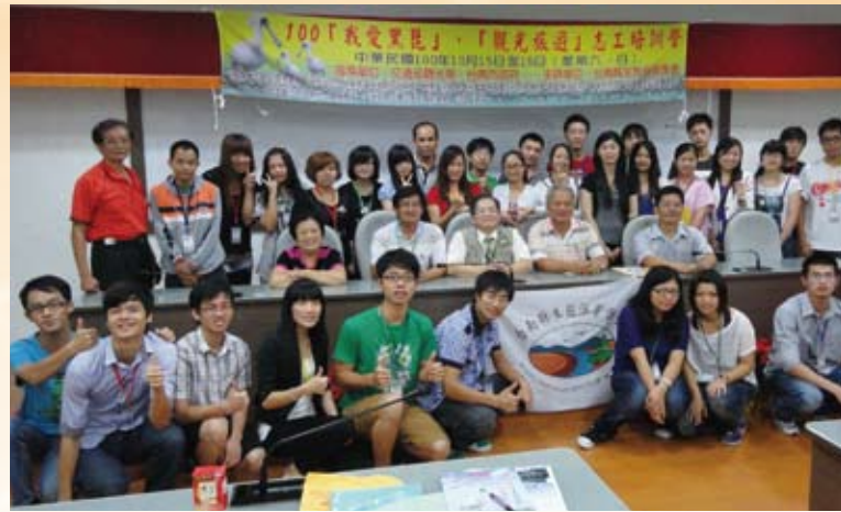
100年我愛黑琵觀光旅遊志工培訓營。

八八水災外，連續4年舉辦的「臺南縣鳥水雉之美寫生比賽」，每場次均吸引7、800位親子參與，喚起臺灣人落實生態保育、生態旅遊及環境教育的聯結機制，達成「生產、生活、生態」三生合一的目標，不但增加親子關係，更重要的是落實生態環境保育知識，進而加強民眾對環境及生態保育的重視與維護，讓生態保育觀念深入每個家庭及學校。