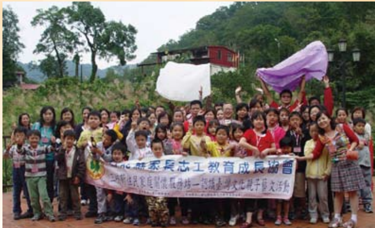
親子活動認識祈福天燈—成功讓自己願望實現

新 北市家長志工教育成長協會自96年開始服務新住民及其家庭，為關懷新住民陸續辦理及協助辦理新住民關懷服務活動，並自96年起至今，與新北市政府合作辦理三峽、鶯歌及新店等3地區之新住民家庭關懷服務站，持續提供新住民及其家庭社會關懷服務。