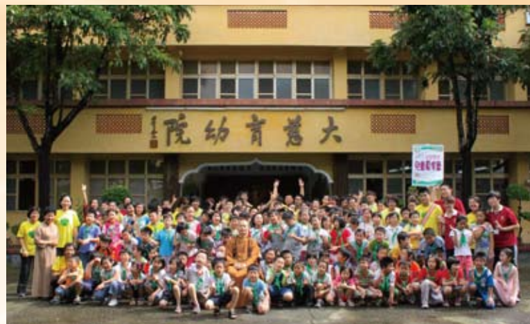
為生命教育兒童夏令營開營。

秉持佛光山四大宗旨—「以文化弘揚佛法，以教育培養人才，以慈善福利社會，以共修淨化人心」弘法十方，擅長講經說法的心培和尚，除在臺灣各地弘法講演數百場次外，亦前往世界各地廣宣佛法淨化人心，提