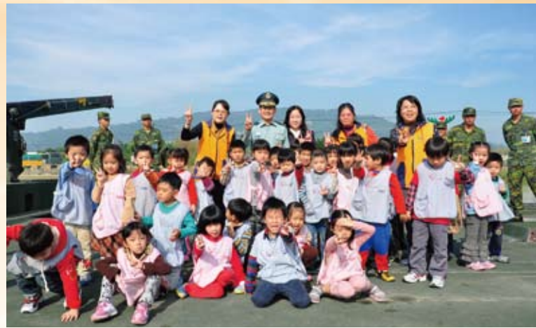
關懷幼兒—邀請校園參訪體驗。

吳孟武將軍民國49年生於新北市貢寮區一個寧靜又純樸的漁村，自幼受到雙親「慈悲善念」薰陶，養成了日後「寬柔愛人、無私愛即富」之人格特質；初中畢業即報考中正國防幹部預備學校，民國72年畢業於陸軍軍官學校，期間敦品勵學、成績斐然，以服務社會、報效國家為職志。