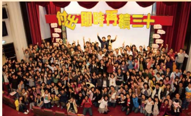
付出即時再續30大合照

林口長庚大專志工隊是源自王創辦人永慶先生於民國70年成立的大專志工隊，是臺灣第一個醫院學生志工隊，也是長庚志願服務的起點，並開創醫學中心招收學生志工先河。志工隊號召熱心的大學生和社會人士，提供每位病人從入院到出院的協助，在門診區製作造型氣球贈送給候診的孩子，換得一個燦爛笑容；在病房區提供病童及家屬書籍借閱，規劃遊戲室陪伴小朋友；每逢耶誕節和兒童節，更有「幸運草兒童劇團」精裝大戲隆重登場。走過四分之一個世紀，目前林口長庚大專志工隊已經壯大為擁有兩百多位成員的大家庭。