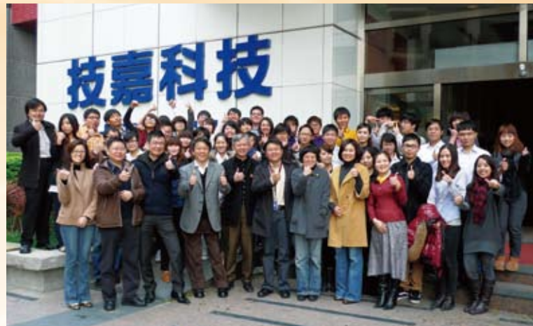
2011奇想設計大賽所有入圍得獎學生和評審們合影留念。

92年開辦G-design奇想設計大賽至今，近年有近千組作品及一千多位學生參加此競賽，希望對臺灣校園設計領域的年輕人作播種、扎根的工作，以培養臺灣優秀的工業設計人才，讓臺灣的設計美學能蓬勃發展。