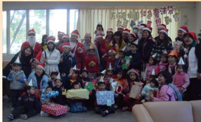
邀請幼稚園學童之家長及老師共同關懷弱勢兒童，一圓他們的學習夢。

而為協助弱勢家庭早日脫貧，秉持著「給他們魚吃，也要教他們釣魚」的信念，為弱勢家庭創造就業機會，以充權增能理念與企業合作，營造包容與接納的就業環境，提供弱勢家庭及安置少年有更多學習與被教育