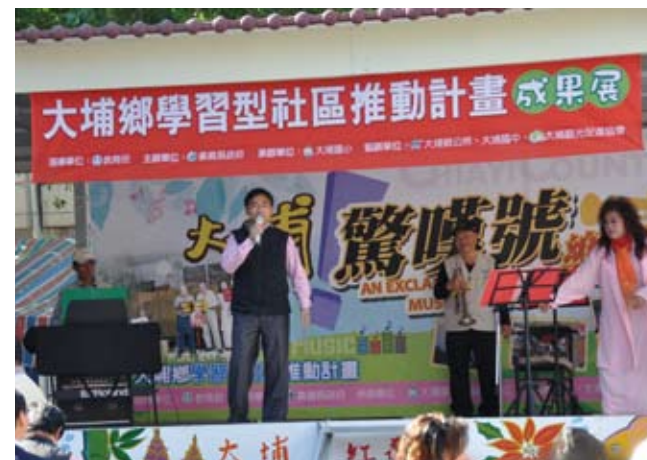
3.辦理99年度學習型社區成果展。