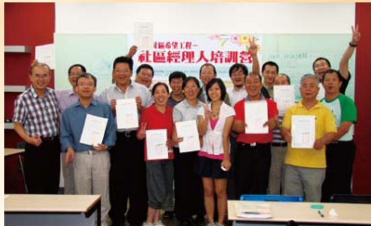
打造社區希望工程—社區經理人培訓營。

2003年復蒙臺北市教育局評選委託，承辦南港社區大學，推動社區的終身教育。承辦之初，即許下「啟動真愛、營造南港、走出黑鄉、迎向明珠」的諾言，期望深耕南港，進而轉化南港成為健康安全的永續社區。因此，特別以「真愛」作為學程發展核心，從個人、家庭、社區、到城市，將南港的特色學群與臺北的共同學程整合，建立了整體課程規劃架構，不僅成為提供居民一處可時時學習、處處學習的優良場所，期以公民培力強化社區自治精神、維護在地資產提升社區美學、以及從事社區關懷帶出幸福人生的實踐，不僅創新社區營造