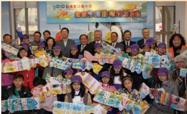
基隆童話藝術節活動—祈福魚旗記者會。

陽明海運公司為提升全民對海洋文化之體認及善盡企業社會責任，將一棟座落在基隆火車站前，原竣工於1915年5月4日的歷史建築，重新修繕整建，命名為「陽明海洋文化藝術館」，並於2004年12月28日開館啟用；更為了永續推動海洋人文藝術教育工作，復於2005年5月13日設立「財團法人陽明海運文化基金會」。另與高雄市政府海洋局合作，在旗津地區設立「陽明高雄海洋探索館」，於2007年12月28日啟用。