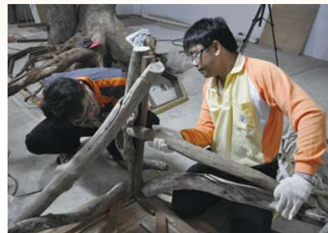
2.與社區志工齊力建置漂流木工作室。