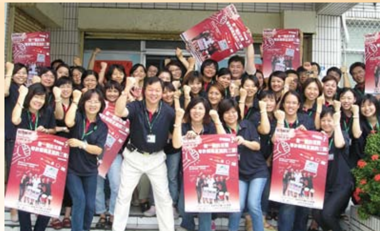
全體同工一日抗貧活動。

從民國55年，除提供一般單親弱勢家庭的經濟扶助服務之外，一直以來，本中心均是披荊斬棘，積極擴展服務，創新方案。75年發展「寄養業務」；79年設立「兒童保護專線038232085」，組織「兒童保護委員會」，當時首要工作是積極協助花蓮縣內無戶籍兒童取得戶籍、拯救雛妓；84年接受政府委託，為兒童之施虐者進行「強制性親職教育」；85年配合「兒童及少年性交易防治條例」之推動，設置「不幸兒童少年關懷中心」及「緊急暨短期收容中心」；90年推展「社區保母支持系統」，強化社區保母照顧嬰幼兒功能；93年接辦政府委託「家庭處遇服務方案」，為受虐兒家庭維繫盡一分力，期待受虐兒都能返回原生家庭，重享天倫之樂。更進一步進行「心理創傷復原服務」，提供受虐兒或施虐者心理諮商服務；94年推展「脫貧方案」，分別為「家庭生活發展帳戶」、「青年自立釣竿計畫」、「幼兒