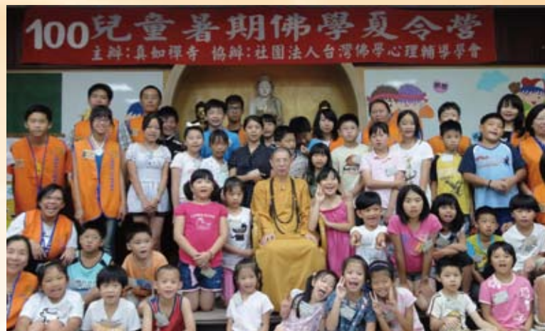
認知生命兒童夏令營—引領孩子們從小建立正確的價值觀

這幾年來，真如禪寺了空無雲和尚帶領著專業的志願服務團隊—台灣佛學心理輔導學會，深入中南部各矯正機關積極進行各類別的教化，諸如：愛滋毒癮收容人生命教育、收容人戒毒專班—認知行為生命教育、感化教育非行少年特別輔導等等；更盡力提供經費贊助機關教化、藝術、技訓發展等活動，讓收容人在正向的學習當中，自我肯定，重新找回自信。超越傳統教化與被教化者二元分立的模式，透過情境教育，引發自身生命認知上的盲點，讓深層潛意識的偏差認知，浮到「意識覺知」的檯面上，這樣的自我覺察、自我感動的力量，來療癒自身、修正自身的行為；讓自己成為自己生命中的醫生。