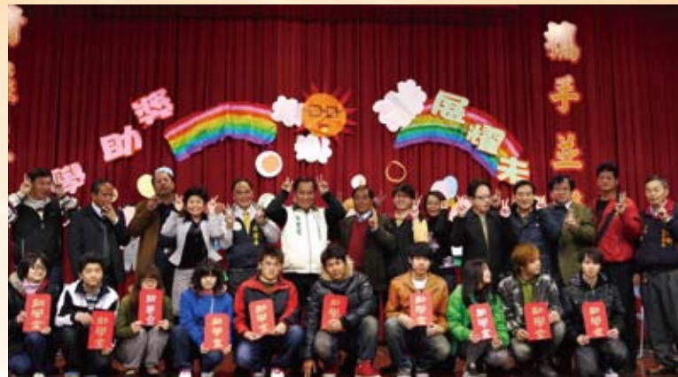
每年兩次頒發「大專獎助學金」讓家扶學子能順利完成學業。

該中心相信，教育是推動社會改變的開始，因此，積極結合企業推動各項教育服務發揮推動社會教育的功能與意義，包含「幼兒啟蒙服務方案」，指導及陪伴偏遠地區家長親子學習親職教育、與孩子互動的技巧，並