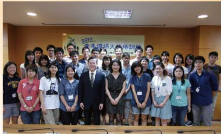
「2010青年氣候領袖培訓營」來自全國大專院校之30名優秀青年爭取「青年環保大使」資格，以參與聯合國氣候變遷會議。

身為臺灣永續能源基金會的董事長，簡又新博士深切感受到環保教育向下扎根的重要性，於是針對不同年齡層次的對象群，舉辦不同的創意競賽，以提升民眾的參與度，包括97~99年連續三年舉辦的全國高中職電腦網路競賽「捍衛地球大作戰」，不僅是國內有史以來參與人數最多，遍及本島外島同時舉行的大型比賽，更是目前世界少見的以電腦連線形式進行的無紙e化獨特創舉，締造Google Analytics網頁檢示高達124萬次的點擊率。如何將氣候變遷議題深入各對象群，簡又新博士