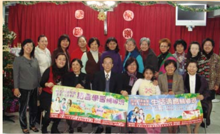
弱勢外籍配偶新住民生活適應課程。

目前，該會在臺灣設有35多所教會、佈道所、工作站，從事心靈改造、社會教化、婦女與青少年教育及社會關懷等事工。還有陽明山衛理福音園提供體驗教育、休閒營地、7所附設衛理幼稚園、衛理神學研究院栽培傳道人的搖籃及衛理協談中心提供高水準專業的協談諮商與心理輔導，也協助有需要的家庭做婚姻危機處理、婚姻調解、情緒管理課程、婚姻溝通技巧及親子教育、青少年及兒童相關輔導課程；成立高雄衛理學生中心，照顧出外求學的高中以上青年學子予優良高品質的住宿與身心靈的輔導；竹山二一心靈重建工作站仍繼續開展多元社會教育與社區服務，每年均獲得內政部績優宗教團體獎；並於98年八八水災後於屏東縣成立佳冬心靈重建