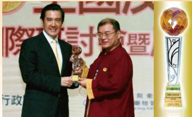
馬總統英九先生親自頒發全國反毒有功獎座，由世界和平聯盟創會主席吳錫銘博士教授代表受獎。

穩定提供三餐不濟的貧困兒童愛心早餐與營養食品，補充孩子成長與學習所需的營養，讓他們有足夠的體力與精神好好學習，進而達到脫貧的目的。99年該會共照顧994個個案，服務70,427人次。