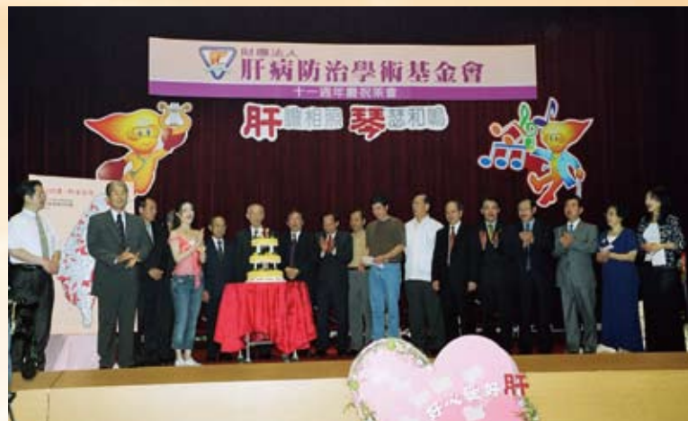
肝基會11週年慶董事長宋瑞樓教授與貴賓合影。

宋教授界定B型肝炎經由體液、血液傳染的途徑；並建議將GOT與GPT納入捐血篩檢項目，大幅降低輸血後感染病毒性肝炎；另外，發現本土B肝病人多是經由B肝帶原的母親垂直傳染給嬰兒，並與其學生中研院院士的陳定信教授等人，大力推動新生兒B型肝炎疫苗大規模接種，使得臺灣於民國73年7月1日創全球首例，開始推行為B肝帶原者母親的新生兒施打B肝疫苗；民國75年7月起更廣及全國新生兒全面施打；這項政策，使得臺灣年輕一代的B肝帶原率從15%遽減到1%，臺灣的B肝獲得控制。