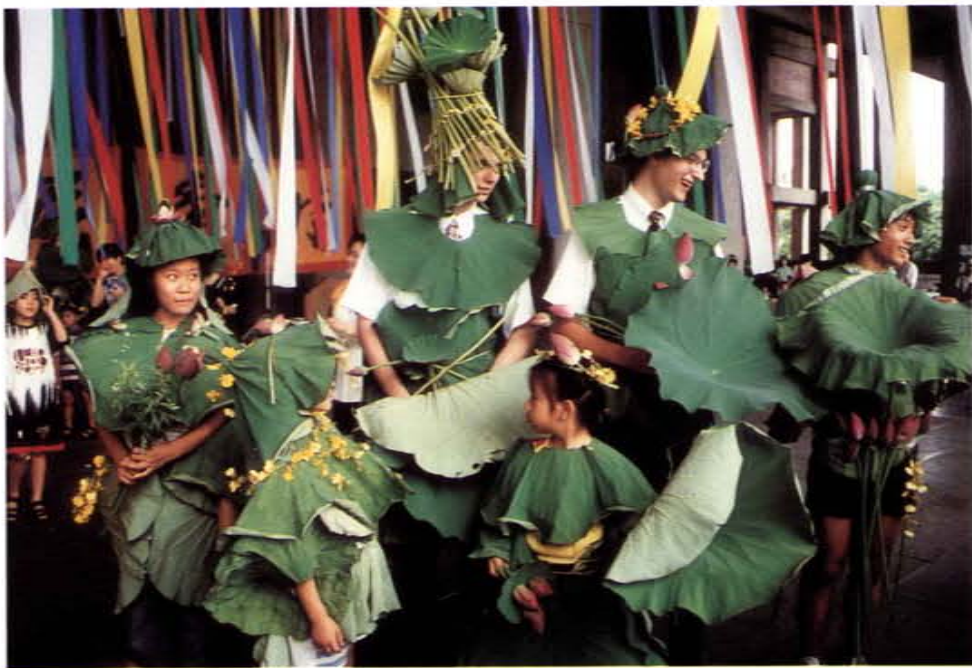
穿上荷葉荷花的外國朋友和兒童共享屈原故事

四、創辦「高雄市古典詩學研究會」九年，有義工數百人，運用其在中山大學任教之專長與心得，以「古典詩現代化」為宗旨，舉辦大中小型社會藝術教育活動，遍及高雄市、高