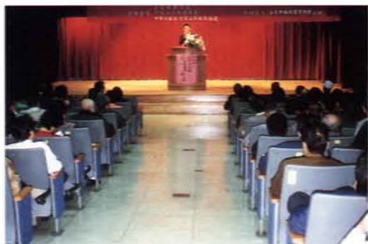
旅遊常識宣導說明會在嘉義市立文化中心舉行

，和處理突發狀況，該會編印品保手冊，免費供旅遊羣眾索取，並利用旅遊展分送入場參觀民眾。