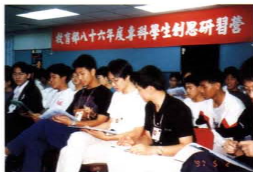
贊助教育部八十六年度「專科學生創思研習營」，在淡水楓丹白露舉行

臺灣東電化公司這種回饋社會、嘉惠學子的作法，實為我國各工商企業之典範，值得效法及學習。該公司歷年對提升我國科學教育之水準不遺餘力，在全國中小學科學展覽會中設置獎項，帶動國內公私立企業團體於該展覽會中設獎，對於培養我國中小學生科學研究之興趣，鼓勵中小學師