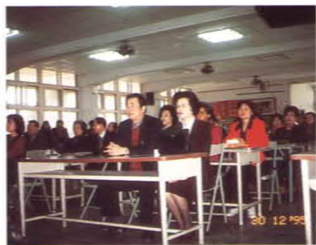
與大甲長青學苑學員一齊上課

五、舉辦社區名人講座：為培養正當休閒活動，結合社區名人舉辦講座，如聘請專家介紹正當的休閒、創業事蹟、成功事例等，以提高生活品質，提升社區層次。