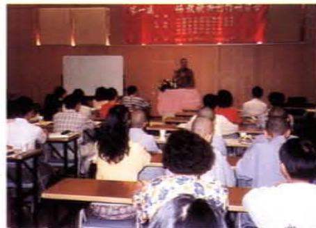
中華佛教音樂協會第一屆佛教歌曲創作研習營