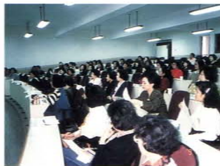
「心韻父母成長班」在敦化國中演講廳上課