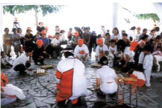
「點亮希望的後山」活動——木琴表演