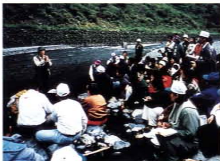
實地推展愛護水資源與節約用水教育