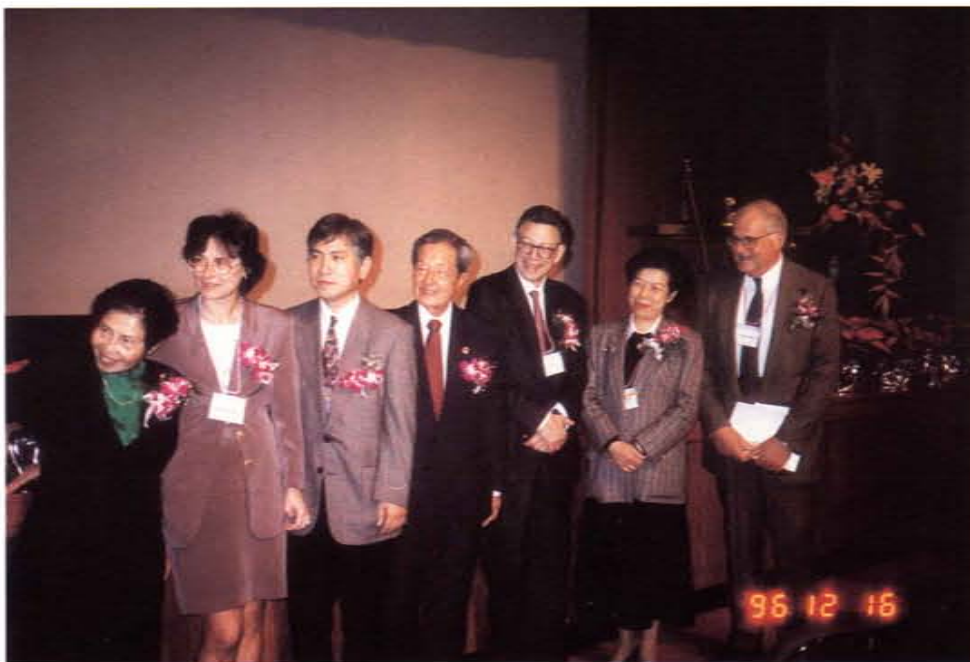
一九九六台北國際研討會開幕式（右二為時任行政院衛生署張博雅署長）

的方式進行。包括：(一)、繼續教育工作坊：分為各種工作坊，如家庭治療工作坊，兒童、青少年性傷害工作坊，團體動力工作坊，心理劇導演訓練工作坊，「長大真好」成長工作坊，結構派家族治療工作坊等。(二)、研討會：舉辦校園自殺防治研討會、一九九六台北心理衛生研討會。(三)、座談