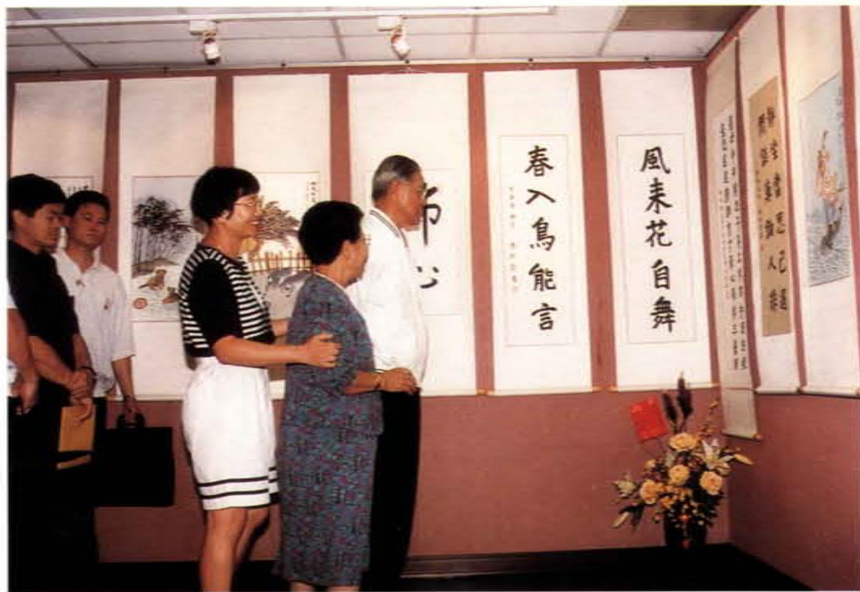
李總統登輝先生參觀社區藝文展出

四、地方史蹟源流資料之蒐集及研究：對民族文化之源流、寶貴資料之蒐集及探討頗具貢獻，如參與台中港開發史、台中縣音樂發展史、民族英雄「王芬」鄉土教材之蒐集；沙鹿鎮誌「藝文」篇之編著；及對台中縣