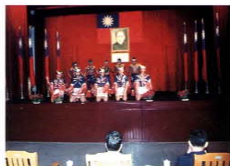
團康活動受刑人自編自舞

計有：拔河、大隊接力、小型康樂、蜈蚣競走、各種棋類、壁報等競賽，強化心性之陶冶，對發揮團隊精神助益甚大。