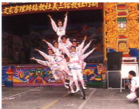
客家文化活動的精彩演出