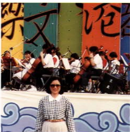
帶領管弦樂團學生參加高雄市各項藝文活動演出