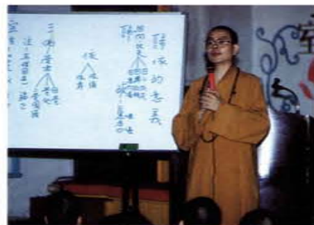
邀請淨耀法師蒞監演講