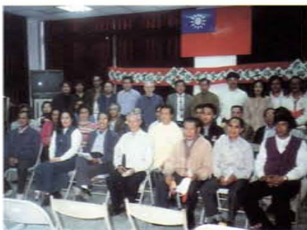
「母語種子班」全影學員合影