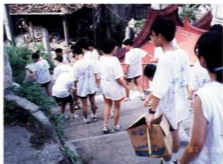
馬中學生淨山活動及社區清潔服務