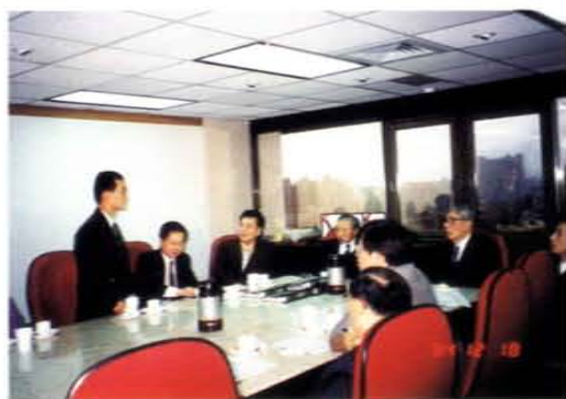
接待八十四年參加國際科學展覽之學生代表