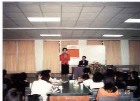
主持心韻父母效能班課程