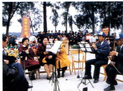
「假日文化廣場」青岐南管演唱