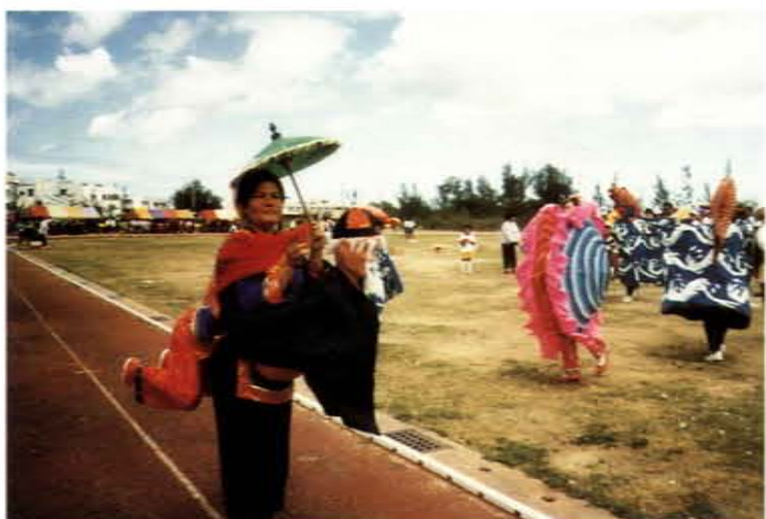
藝文活動在車城國中舉行