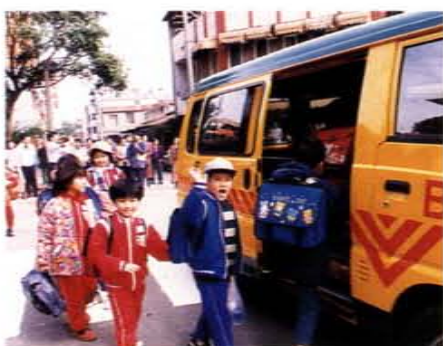
交通安全教育觀摩研習