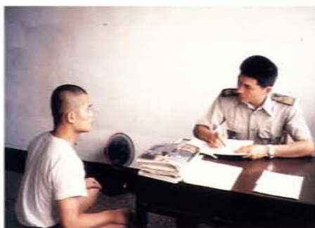
對受刑人實施個別約談教誨