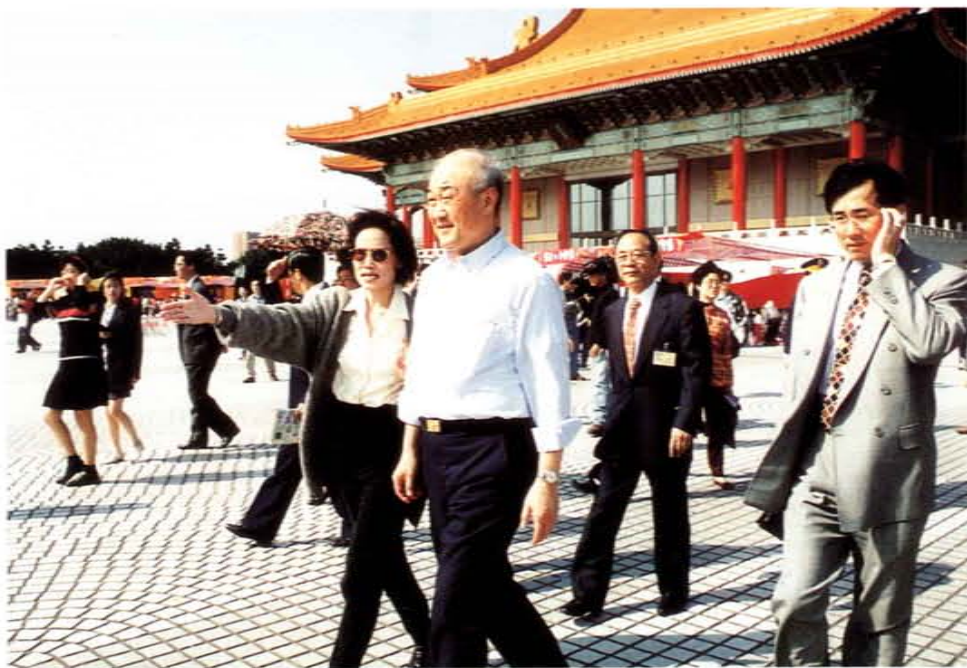
向教育部吳京部長說明「真心・真愛・我的家」親子假日廣場活動情況