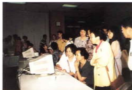
台北市分區青少年輔導網路座談會電腦上網研習情形