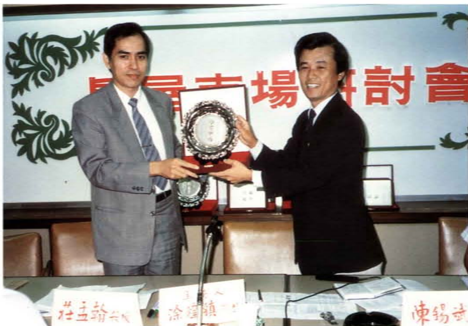
參加房屋市場研討會接受紀念盃