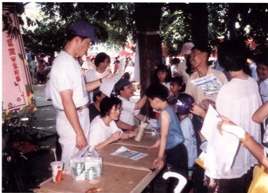
與警廣交通台合辦交通安全教育宣導活動