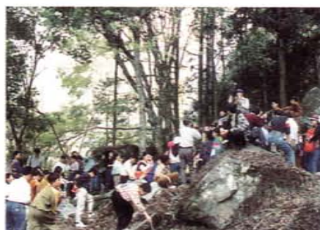
「科學之旅」帶領大家奔向自然尋真探秘