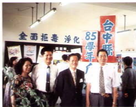
辦理台中縣反毒活動教育局長（右二）蒞臨參觀

師是心靈改革的工程師，王先生全面推行社區心靈改革工作，博得社區的肯定，尤其印發心靈改革叢書「晨鐘」，廣為推動，更獲得民衆的讚譽。