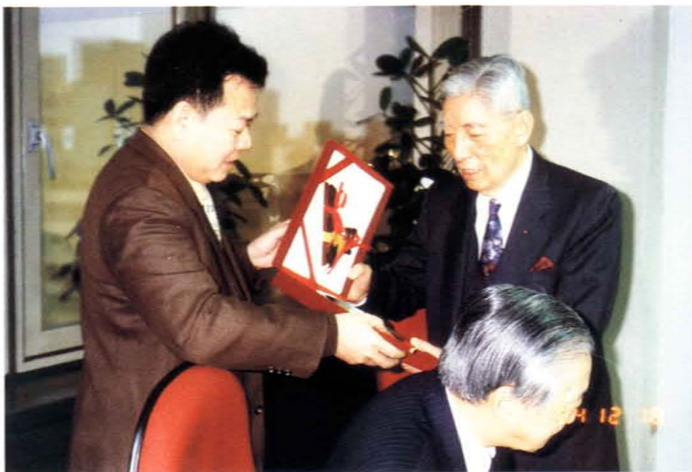
八十三年李國鼎資政（右）獲國立台灣科學教育館顏啓麟館長頒贈感謝狀