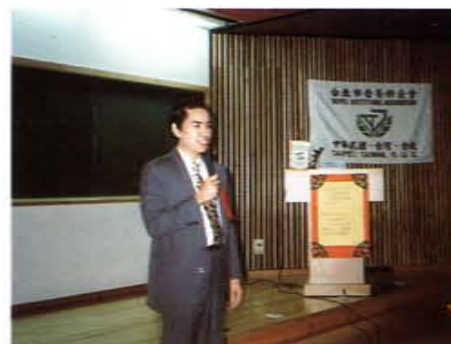
應台北市營養師公會邀請演講