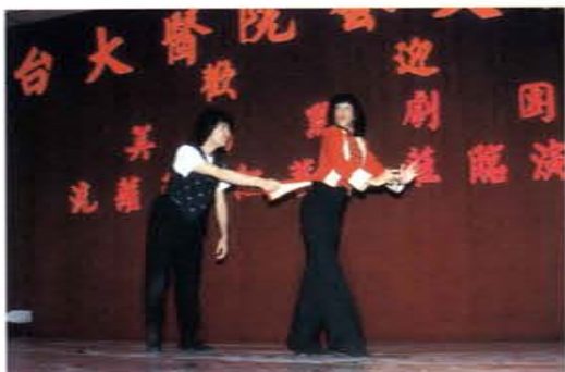
美國「洗蘿蔔與紅蕃茄」默劇團演出