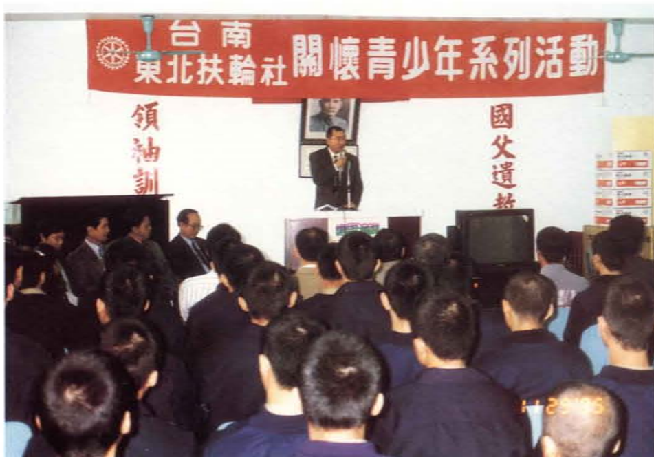
拜訪少年觀護所宣傳反毒