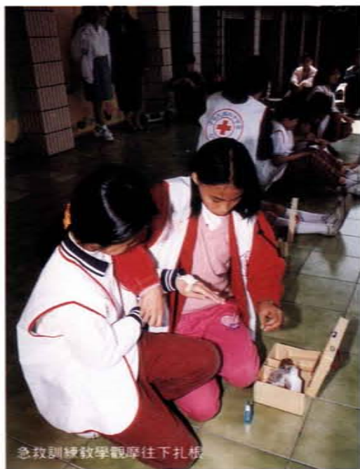
急救訓練教學觀摩往下扎橋