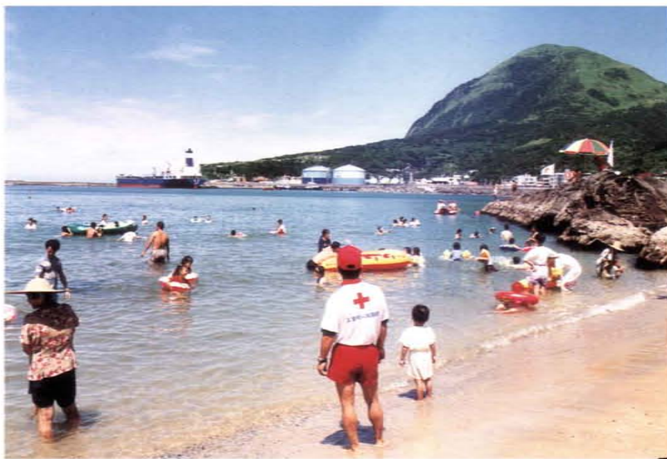
每年夏季在溪流海域執行安全維護

。自六〇年代以後，社會因經濟成長而轉型，醫療政策及技術改進，該分會前期業務經開創更新，以老人服務配合高齡化時代之來臨，以保健中心之服務達到預防疾病、增進健康之目的，並以急救、水上安全等訓練來減免災難，以家庭保健來因應在宅療養之需求。自八〇年代起工作可分為十