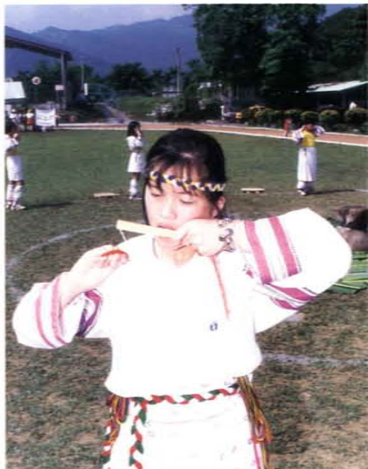
民俗才藝競賽——口簧琴吹奏

生活力無限，以體能、知識、娛樂、藝術性為主，辦理愛鄉杯籃球賽、社教杯桌球賽、健行活動、育樂營、青少年反毒籃球賽及各項運動大會，積極培訓原住民體育人才。