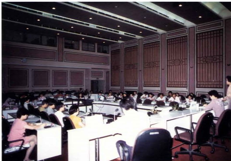
台北市分區青少年輔導網路座談會在台北市立圖書館總館舉行

能研習講座，與國小校園行政系統運作研習班講座。(三)、自民國七十八年至八十六年長期擔任伯大尼育幼院愛心義務督導。(四)、暑假在伯大尼育幼院督導中與大學、東吳大學、東海大學社會工作系學生。(五)、擔任宇宙光輔導人員義工，並參與輔導研習班輔導講座。