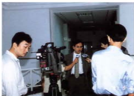
推動交通安全教育接受媒體採訪

部外傷為台灣騎士最大之殘障原因及死因，而全力推動安全帽立法，並獲立法院通過執行，獲致具體成果，堪為社會教育之表率。