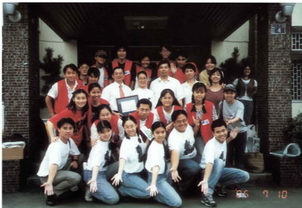
率領實踐基訓團同學赴台北少年觀護所舉辦少年成長營