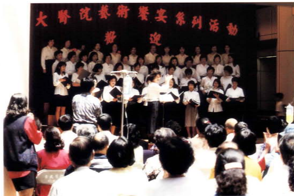
八十五年為鼓勵外僑關心台灣社會公益活動安排日僑「椰子三寶」合唱團演出