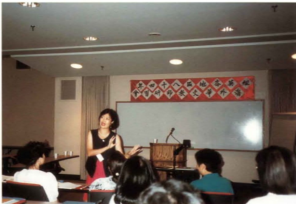
赴美、加各城市巡迴講授中國語文

及演出，一直到最後資料之整理，一概全程親自處理。兩屆之演出台北市社教館均全場爆滿，觀眾及各媒體讚賞不已，造成吟詩誦詞之熱烈風潮。她並將節目精華剪輯成「詩歌吟唱教學示例」，分送各級學校及社教單位甚至海外各僑區，以收推廣之效，影響至海內外。六年來她走遍南北在美