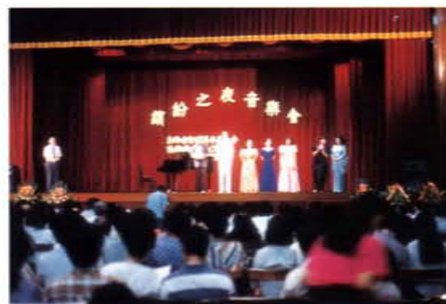
「繽紛之夜音樂會」在楊梅舉行