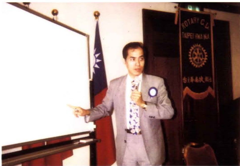
應台北華南扶輪社邀請主講不動產投資與理財方法