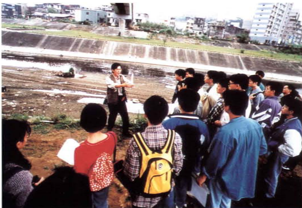
河川環境教育課程仔細聆聽的學子

生態保育教材幻燈片資料庫，協助社會環境教育媒體教材之編製與觀念之推廣；且編製愛水教育視聽教材，包括錄影帶、幻燈片等，以推動愛護水資源教育。此外汪先生長期協助民間團體推動自然生態保育工作，或受邀演講，或主持自然保育計畫，對我國社會環境教育之推廣著有貢獻。