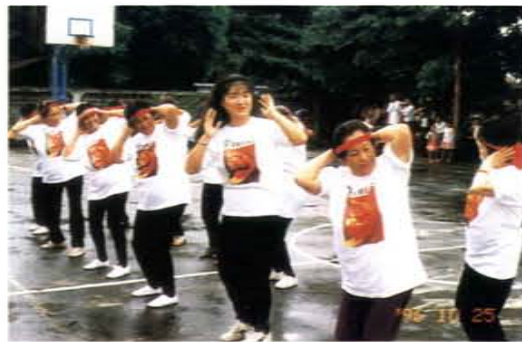
讀書會婦女參與愛鄉盃籃球賽表演大會舞