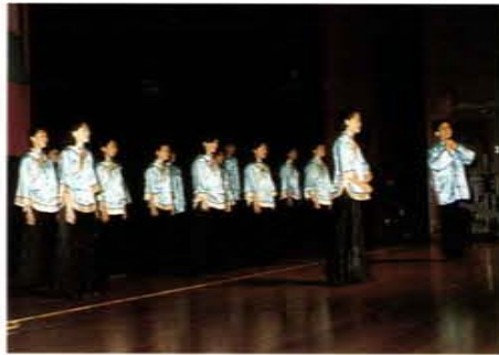
台北市「古調·新詞·有情台北」詩歌吟唱大會節目之一

洲、澳洲、紐西蘭、東南亞各國宣揚中華文化，受到僑界肯定。此外，她並參與教育部編寫母語教材「河洛語」課本及教師手冊工作；主編「教師天地」等。她對推展傳統藝術、母語教學、詩歌吟唱績效卓著，對振奮人心，改革社會風氣貢獻良多。