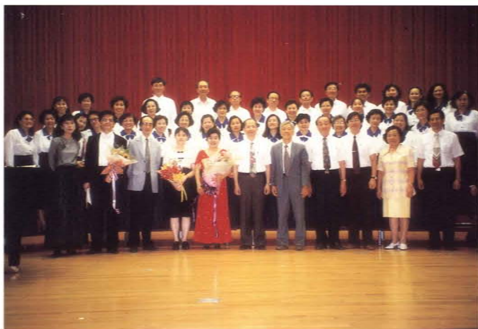
「長恨歌」清唱戲演出後合影於高雄市立文化中心至善廳

九、建立社會教育網路，協助高雄市立圖書館辦理推廣書香系列教學活動，積極熱心，工作認真。