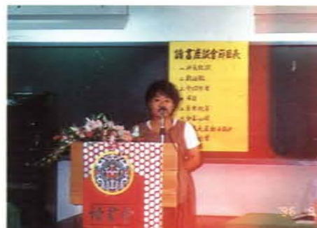
「讓高牆倒下吧」讀書會介紹講座主講人