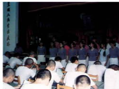
團康活動邀請社會人士參與