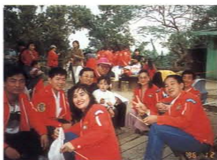
義工伙伴年會於澄清湖舉行