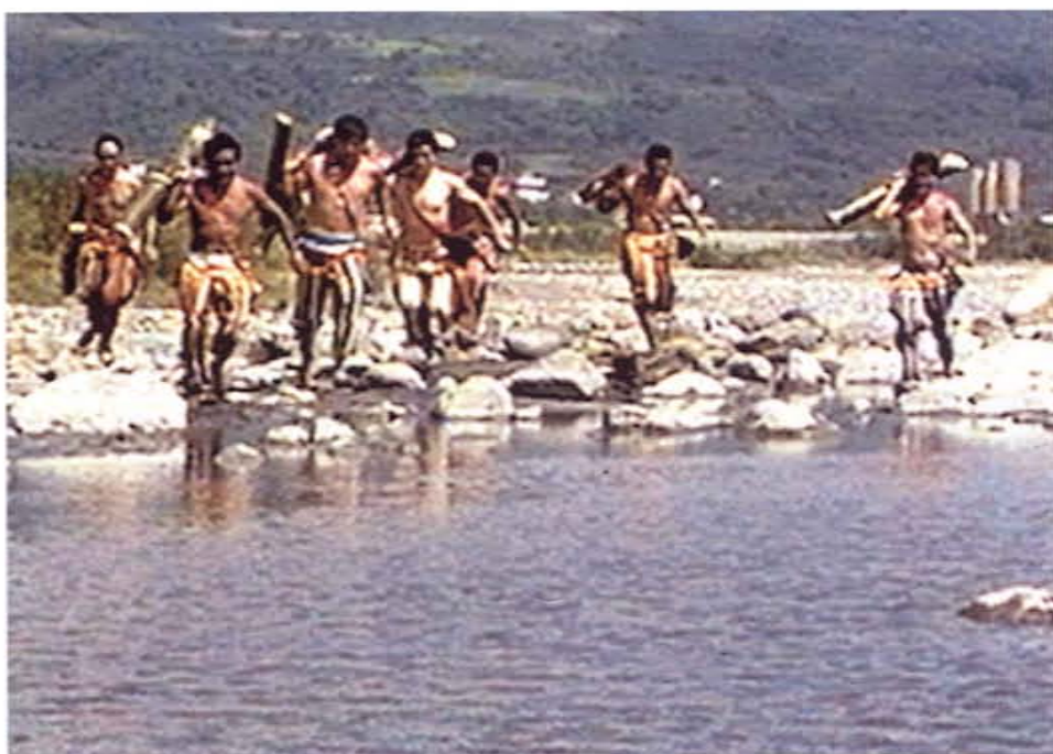
卯足全勁為贏得取水賽跑的阿美族青年