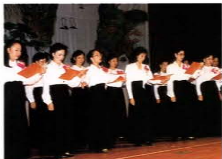
指導台北市民生社區媽媽讀書會參加台北市第二屆「詩歌吟唱大會」