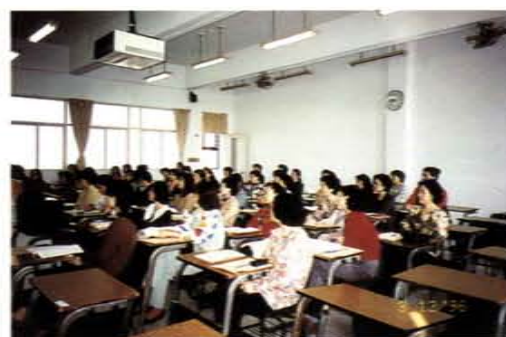
「婦女學苑」上課情形

理學院辦理社會教育雖未及二年，但回饋頗佳，今後該校將再努力，與社會需求相結合，辦理更好、更完善的社會教育。