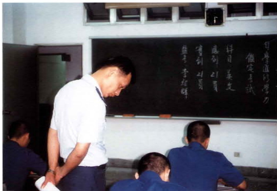
推行監獄附設補校教育，擔任學力鑑定考試監考官