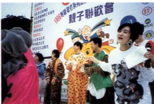
大象林旺七十九歲生日慶生活動之一

四、經費補助：補助動物園人員出國參與國際性學術研討會、補助國內大學院校舉辦論文發表研討會，以培養國內優秀人才有機會參與國際性及國內專業研討會議。如：補助動物園出席國際金剛會議、動物園園長聯盟會議、國際教育者年會，另外每年固定補助國內大學動物相關科系活動經費，舉辦動物行為研討會及論文發表會。