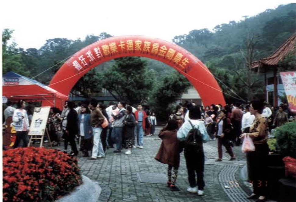
小金剛寶賀慶生活動

三、國際交流：舉辦國際性學術交流活動，以促進國際間動物園之交流，並提升我國國際保育形象，如舉辦國際瀕臨絕種動物保育研討會、第五屆東南亞動物園協會年會、海峽兩