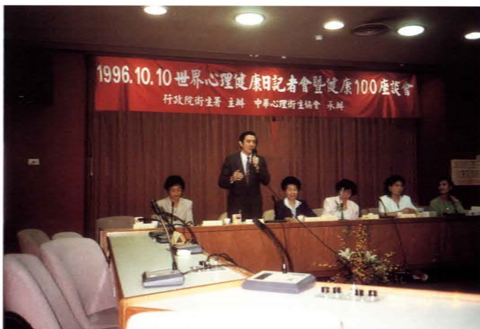
「世界心理健康日」記者會暨健康100座談會

四、透過舉辦國際性研討會，達到國民外交與對我國社區民衆教育的目的：中華心理衛生協會是世界心理衛生聯盟(WMHF)的會員。該協會爭取到世界心理衛生聯盟西太平洋研討會在台舉辦，透過媒體與同步翻譯的方式，使專業人員和社區民衆共同參與為期三天的研討會和論文發表，成果豐碩並獲得廣大的迴響。