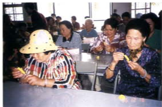
銀髮族捏黏土製作研習班上課情形