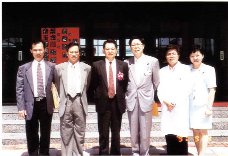
「中美腦外傷研討會」會後工作人員與詹啟賢署長（左三）合影（左二為邱文達先生）

八、民國八十六年三月參加法鼓山文教基金會舉辦之「八十六年人間淨土年健康關懷疾病防治園遊會」活動，應邀作外傷防治演講，並參與相關活動。