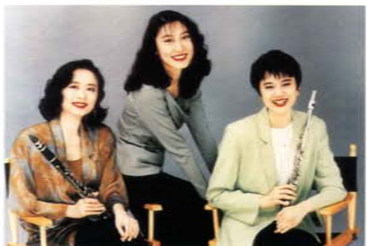
「知心樂坊三重奏」在該中心舉行音樂會

練「交大藝術季」所需的專業性劇場技術工作人員及其他人員，以圓滿達成任務。包括：舞台、燈光、成音等劇場技術及水電、空調、消防安全等工作。