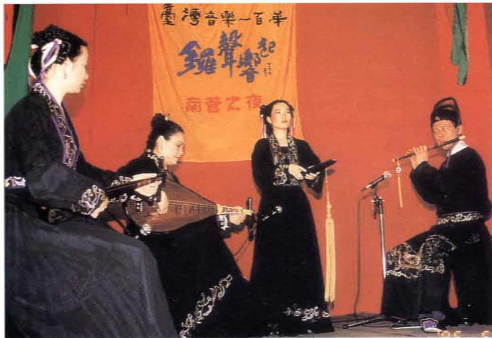
「台灣音樂一百年」鑼聲響起——南管之夜（漢唐樂府於大稻埕慈聖宮前的演出）