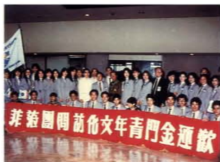
擔任金門文化訪問團指導老師赴菲律賓宣慰僑胞