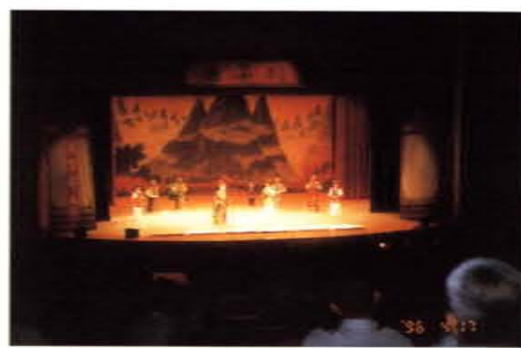
藝文活動之一明華團歌仔戲