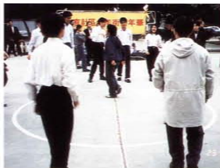
策辦「大直社區青少年街嘉年華」活動

六、於八十三至八十六年度擔任實踐學院基信團指導老師，出錢出力積極輔導大學生定期從事台北少年觀護所少年成長營輔導活動，及定期探訪聖安娜之家進行服務工作，成效優異。