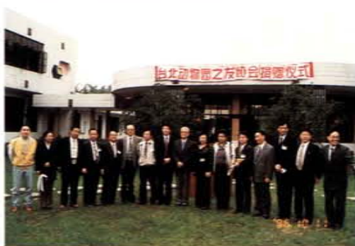
赴大陸參加海峽兩岸野生動物保育交流活動