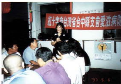
愛滋病防治推廣教育