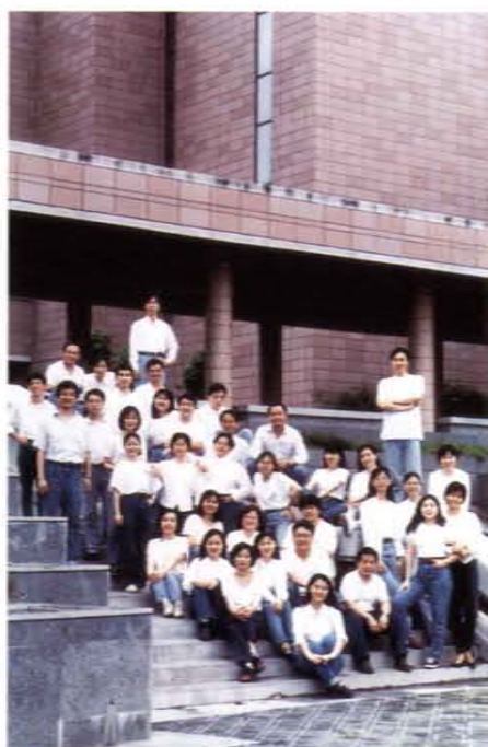
受邀演出的「福爾摩沙合唱團」成員