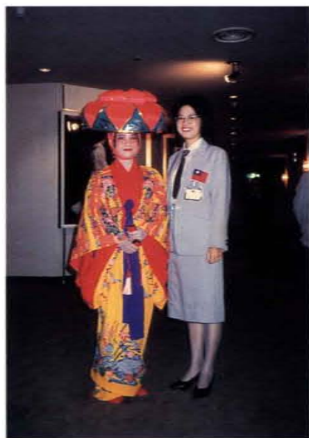
擔任金門文化訪問團指導老師赴琉球宣慰僑胞