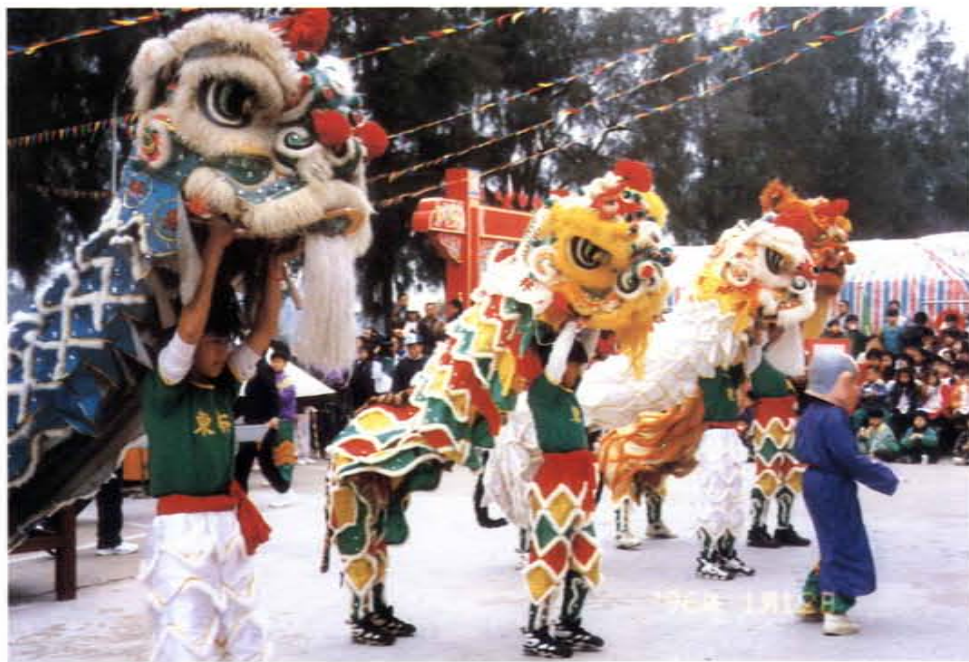
「假日文化廣場」東林醒獅團表演

三、推廣家庭、社區文化教育，舉辦青少年法律、婚姻暨兩性教育講座，導正青少年偏差觀念，績效優異。輔導地區烈嶼國中、卓環國小、上歧國小分別舉辦推展親子互動之親職教育活動，增進家長對親職教育之認識及學習良好之親子溝通與互動方法