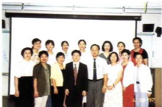
推廣教育非學分班「醫管研究班」結業式