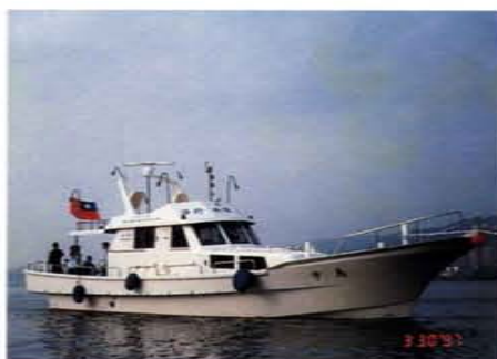
興建「馬中號」實驗教學船，提供學生實習及改善漁民謀生知能