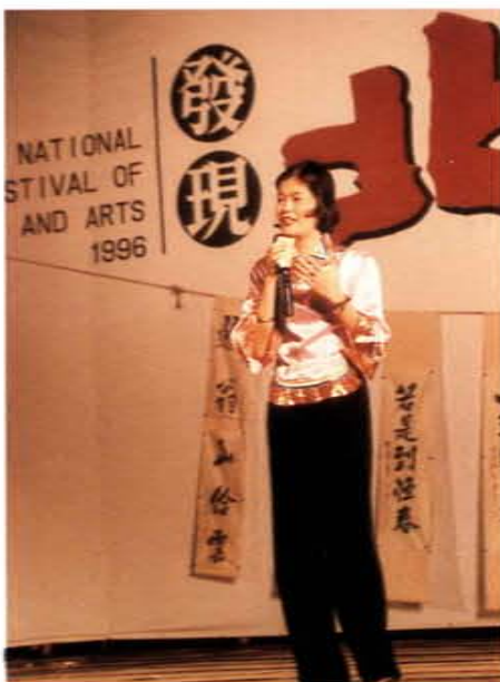
主持全國文藝季台南「發現北汕尾」活動

洲、澳洲、紐西蘭、東南亞各國宣揚中華文化，受到僑界肯定。此外，她並參與教育部編寫母語教材「河洛語」課本及教師手冊工作；主編「教師天地」等。她對推展傳統藝術、母語教學、詩歌吟唱績效卓著，對振奮人心，改革社會風氣貢獻良多。