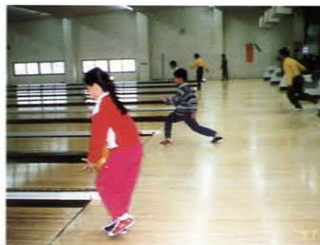
社區親子保齡球比賽