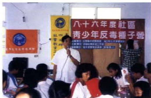
社區青少年反毒種子營