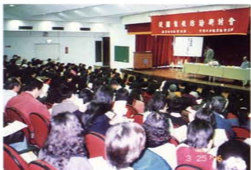
校園自殺防治研討會在師大舉行