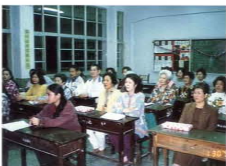
補校學生上課情形