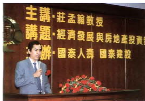
應邀主講經濟發展與房地產投資策略