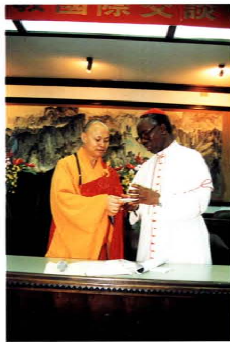
八十四年在佛光山召開「第一屆天主教與佛教國際交談會議」