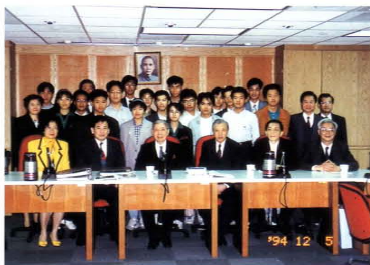
八十三年參加國際科學展覽之學生代表拜會李國鼎科技發展基金會