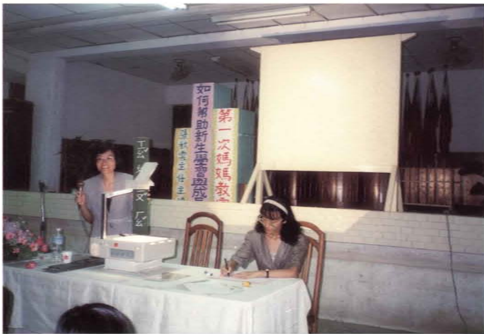
在「第一次媽媽教室」主講如何幫助新生學習與成長