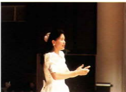
參加在香港文化中心舉行的「華夏童聲頌友誼」指揮高雄市兒童合唱團