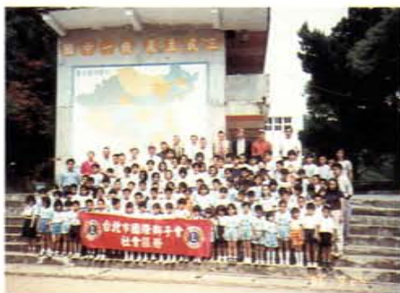
台北市國際獅子會赴五峯國小服務