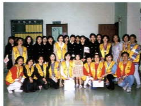
中正紀念堂「尋寶之旅」活動的導覽人員及義工羣