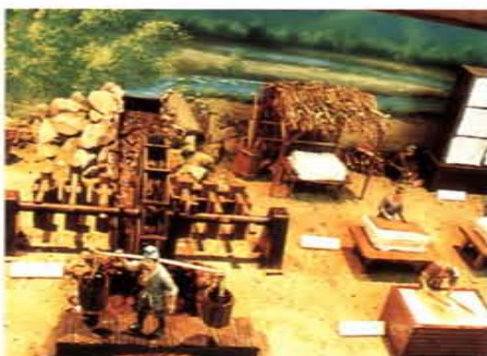
中國古代科技展一隅