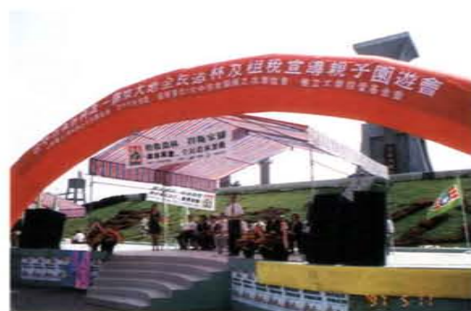
關懷大地全民造林及租稅宣導親子園遊會

四、創設「社會研究院」推動成人終身教育。以「前瞻、創意、務實、篤行」及「學習、成長、關懷、奉獻」之服務理念，應社會發展之需求，加強高層次成人社會教育，並提升人力品質，對帶動社會學術研究及各種學習風氣具有積極影響。