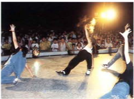
「與嫦娥共舞」颯舞活動中山大學勁舞社的表演