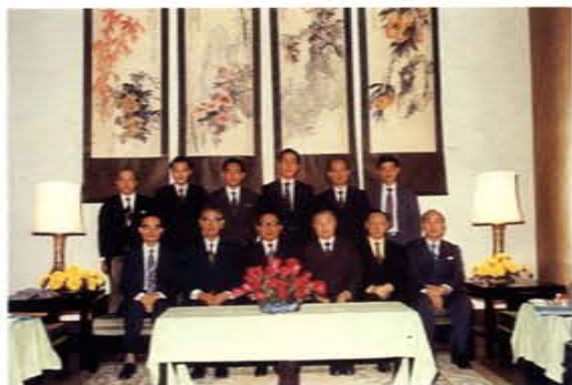
民國六十二年基金會成立時攝於廬山飯店 (前排右三為時任教育部部長朱匯森先生、右四為時任內政部部长林金生先生)

年十二月改為「文教基金會」，經營策略亦隨之改變。前面所提五項獎金除保留「留日獎學金」及「中小學科學展獎金」外，其餘獎金不再補助，而改為贊助由教育部主辦之「全國專科學校創思設計與製作競賽——挑戰創造力，機械人大戰」，金額高達柒佰萬元。