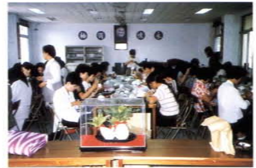
婦女家事經理進階研習班上課情形

四、為發揮社會教育功能，爭取經費，八十三年七月於該鄉圖書館設立多媒體簡報室；八十五年四月編印「愛吾烈嶼」簡報手冊；八十四年元月編印「為民服務手冊」；八十六年元月創刊發行「烈嶼鄉訊」季刊等。內容涵蓋政事宣導、施政說明、各項活動資訊、鄉土特色、文物介紹、藝文論述、鄉親廣場，藉以傳播該鄉生活資訊，凝聚共識、連繫鄉情、促進地區團結進步。另於八十五年十一月組隊參加金門地區國語文競賽，各項成績表現優異，榮獲社會組團體第一名。