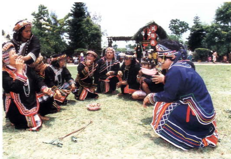
假日文化廣場活動——布農族「祈禱」舞