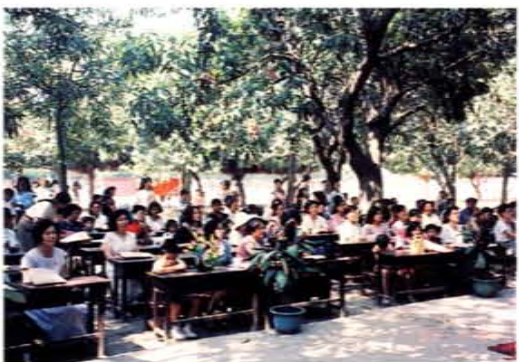
辦理親子親師活動

習園地；也是左營地區市民終身學習的資源中心。這所自然的、兒童的、社區的、學習的、生活的、溫馨的、安全的學園——左營國小，於創校五十六年之後，又將踏入一個新的里程碑。