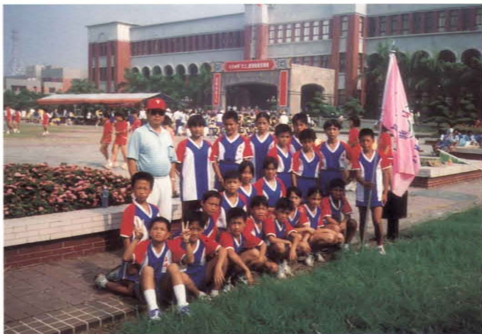
八十四年領導學生參加新竹縣越野接力賽獲女子組亞軍、男子組殿軍

他本著愛心、耐心，及基於人性本善、行善物化之理念，忠於職守、犧牲奉獻，以導正社會風氣為職志。看著學生茁壯成長，他更加堅信自己的執著，且更熱心從事社教工作，以挽救賽夏本土文化，並樂此不疲。其敬業精神，誠屬難得。他不但是位良師，也是文化尖兵。