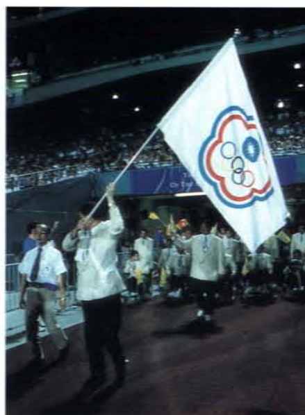
參加一九九六亞特蘭大殘障奧運秘書長賴復寰舉會旗入場