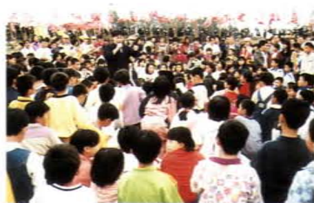
雲林鄉下，專注聽詩的小朋友們

每年二十三場，現已辦至五十二場，邀請國內文學界著名人士，利用高雄最重要之文化中心至善廳場地舉辦演講，並在有線電視轉播，發揚民族文化，促進社會倫理建設。