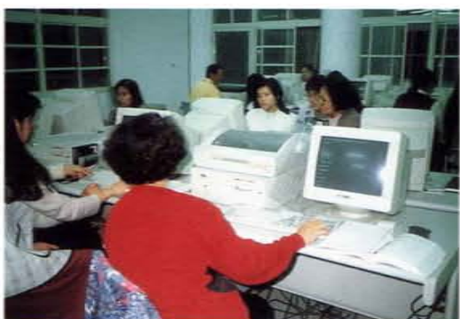
「市民學苑」電腦班上課情形

習園地；也是左營地區市民終身學習的資源中心。這所自然的、兒童的、社區的、學習的、生活的、溫馨的、安全的學園——左營國小，於創校五十六年之後，又將踏入一個新的里程碑。