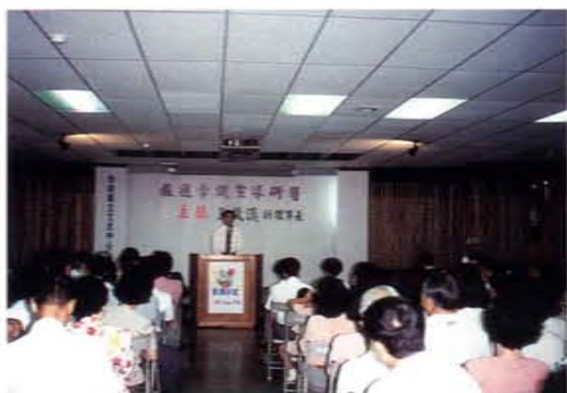
旅遊常識宣導研習在台南縣立文化中心舉行