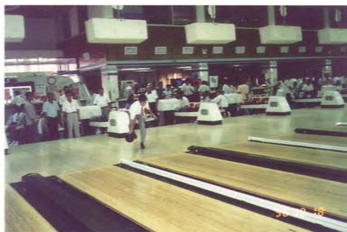
在鄉長盃保齡球賽開賽