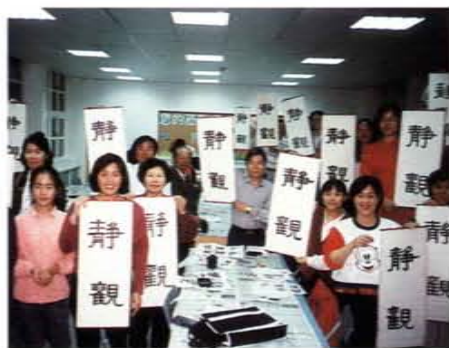
三義鄉筆墨紙硯播種營學員及其作品

「燃燒自己、照亮別人」是葉錦忠先生推動社教工作的最好寫照。在目前功利主義充斥、價值觀念紛歧的多元社會裡，其無我無私獻身社教的精神，可做為教育人員的楷模。