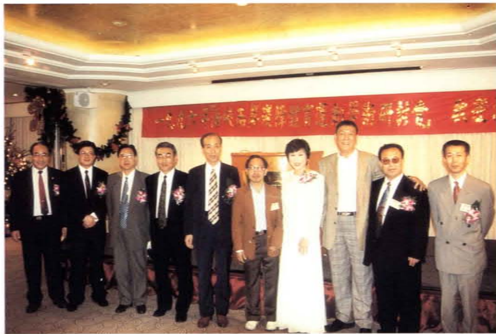
一九九六海峽兩岸殘障體育運動學術研討會歡迎酒會