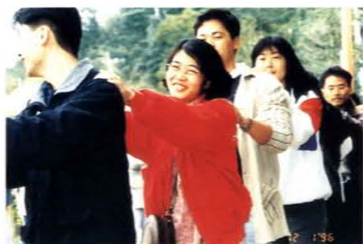
「健康・甜蜜・快樂遊」聯誼活動