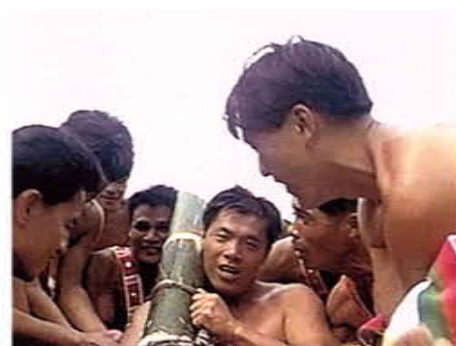
阿美族的豐年祭上一位贏得比賽取水給口渴長輩喝的年輕人 接受夥伴族擁歡呼

內容包括劇情、單元目標、討論及參考資料，其中「討論」部分係將各集劇情發展過程中發生的事物、問題及因應措施，採問答方式深入淺出地探討，協助主持人視不同場合與觀賞人的需要採擇運用，以達成促成觀賞人思考、增進了解、力行改進的目標。