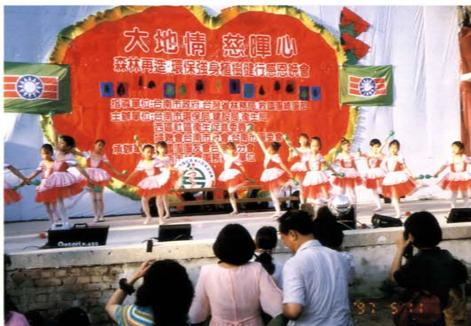
「大地情·慈暉心」森林再造環保強身植樹健行感恩晚會