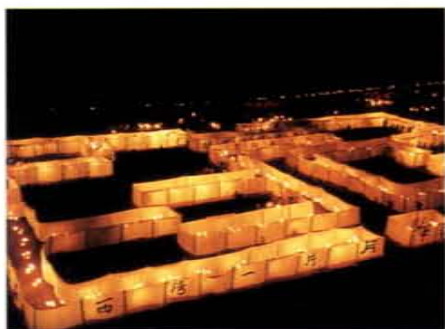
以詩排成迷宮，使高雄西子灣重現中秋風華