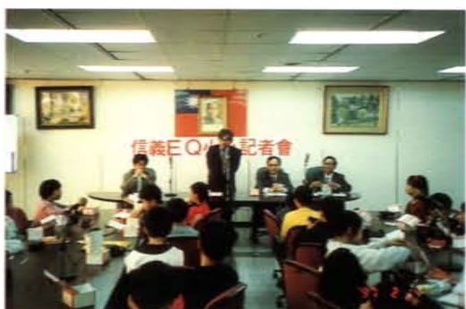
與高市信義國小合辦「信義EQ廣播營」小記者訪問高市教育局羅文基局長（中立者）