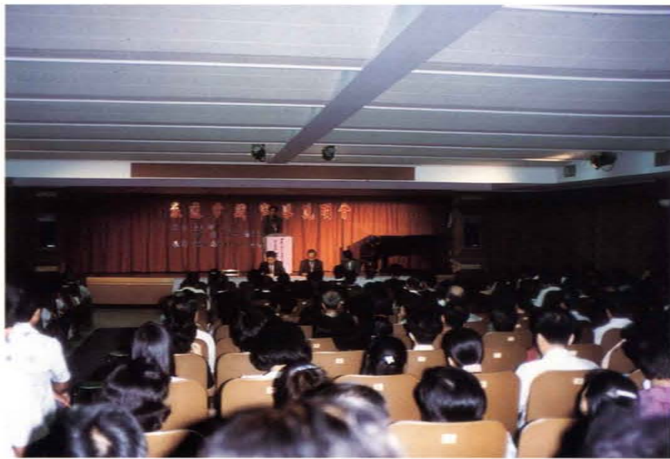
旅遊常識宣導說明會在宜蘭縣立文化中心舉行