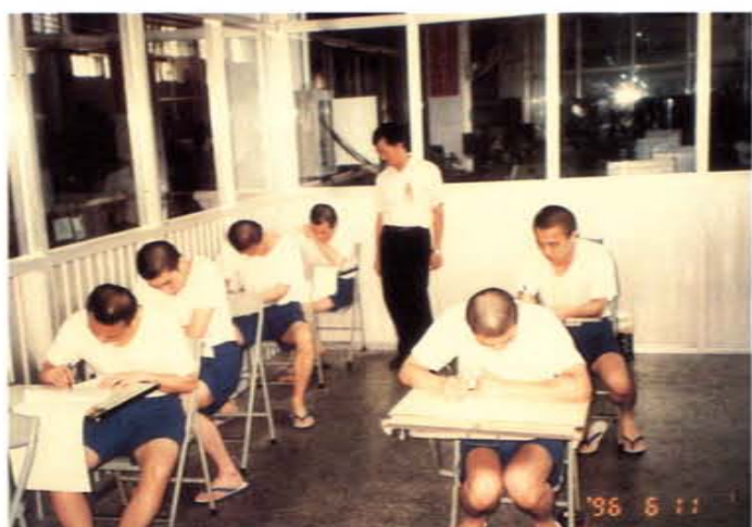
技能檢定筆試情形