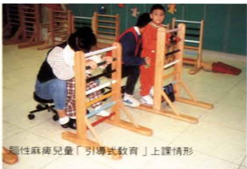
腦性麻痺兒童「引導式教育」上課情形

牙利，在歐洲普遍應用之「引導式教育」，訓練腦性麻痺兒童。將復健與特殊教育融合於生活化的訓練中，使腦性麻痺兒童在動作、認知與語言發展上都有明顯的進步，並於八十六年一月舉辦引導式教育研習會，將此種方法推廣介紹給全省訓練腦性麻痺的殘障教養機構。