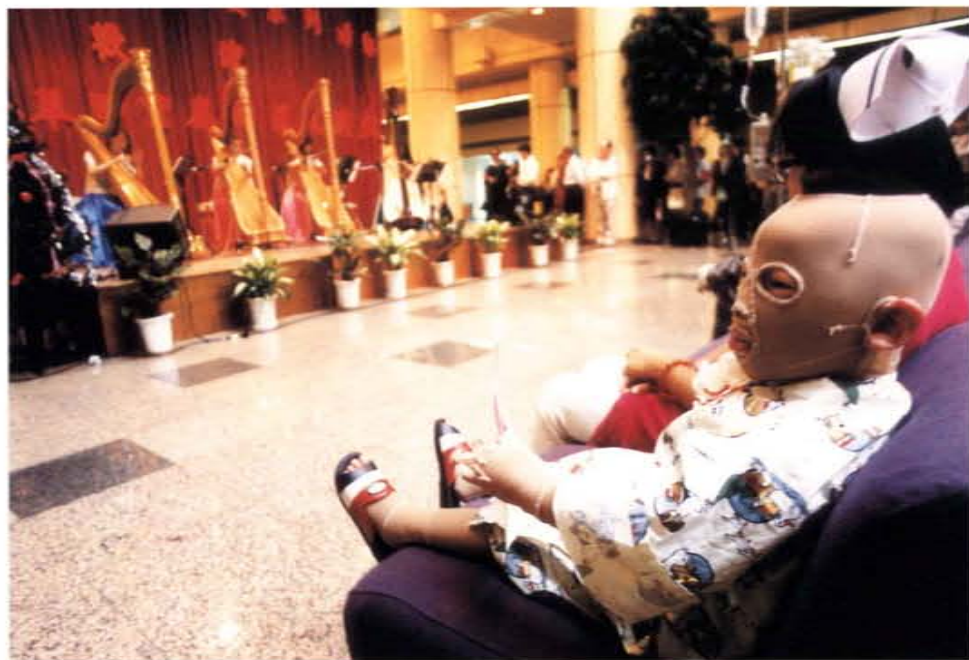
八十三年耶誕節邀請「台北豎琴四重奏」演出，圖為一位被火紋身的小朋友坐賞耶誕樂章

共關係室實地接觸國內的藝文團體，發現國內適合演出的場地有限，許多藝術科系的莘莘學子及殘障朋友所組成的藝文團體，演出機會不多，若醫院的公共場地能夠充分利用，不但能增加他們的演出經驗，又可以鼓勵他們投入社會公益，達到藝術生活化的目的。