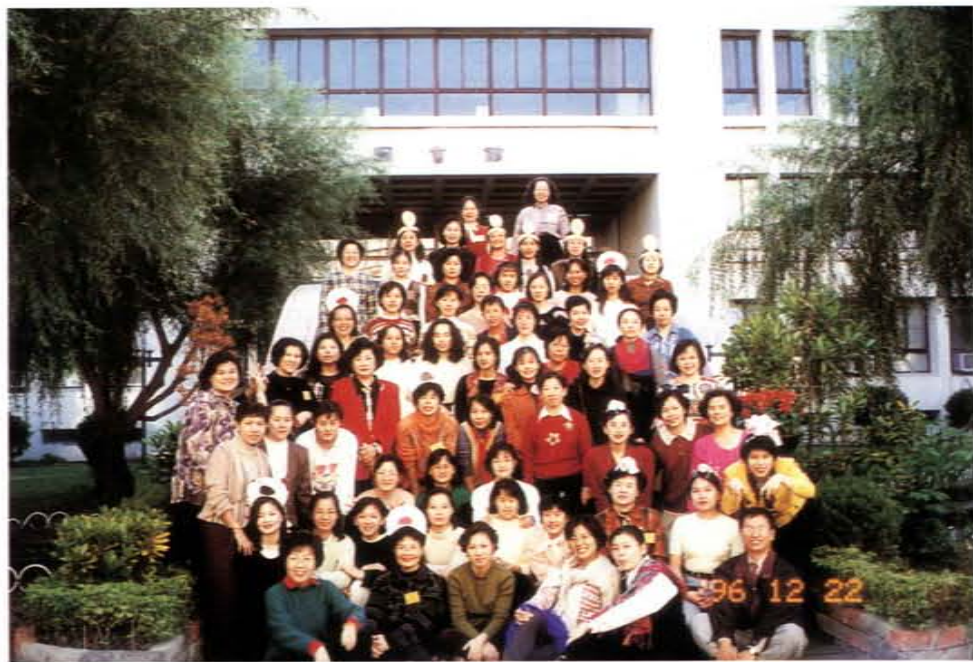
「醫護人員創造力訓練研習營」全體學員

科技更是現今民衆的最愛，該校應用現有的資源辦理科技教育，在北投及萬華區辦理電腦應用基礎班、進階班等電腦研習課程，供民衆學習。