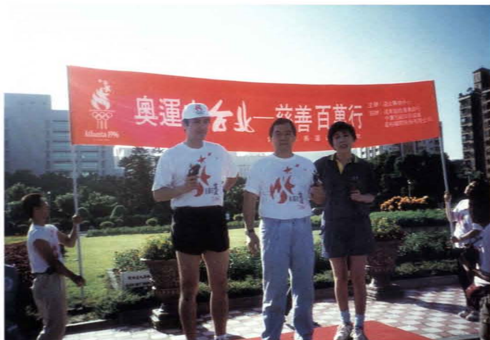
奧運台北——慈善百萬行募款活動在國父紀念館舉行