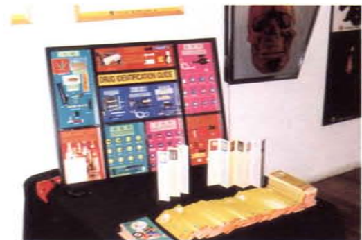
反毒運動展覽現場