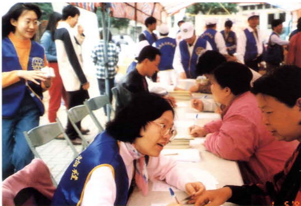
捐血活動獲得民眾熱烈地參與