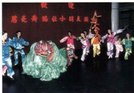
八十四年元宵節邀請台北碧亮舞蹈社小朋友演出