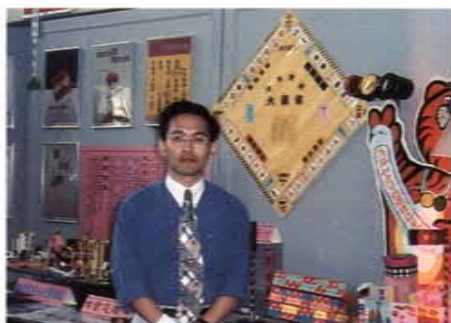
在「全省交通安全教材教具競賽優秀作品展」會場

四、致力國民補習教育、造福失學民衆：他有感於雙親失學之苦，乃本著回饋與奉獻之心，擔任學校補校