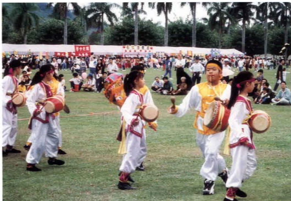
學校花鼓隊受邀表演

秉承著優良的傳統，高雄市左營國民小學自八十三年起積極投入社區家庭教育和社區成人教育，八十五年起又實施開放教育，是兒童快樂的學