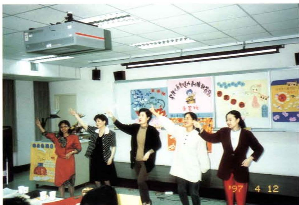
活潑生動的「醫護人員創造力訓練研習營」

除此之外，國立臺北護理學院本著回饋社會，造福鄉里的理念，配合澎湖地區的需求，開辦學分班。澎湖係離島偏遠地區，交通不便，護理人員進修機會匱乏，故該校毫不猶疑，在不敷成本的情況下，仍毅然決然，飄洋過海，在澎湖開辦護理專業人員進修教育班，秉持服務的精神，該校