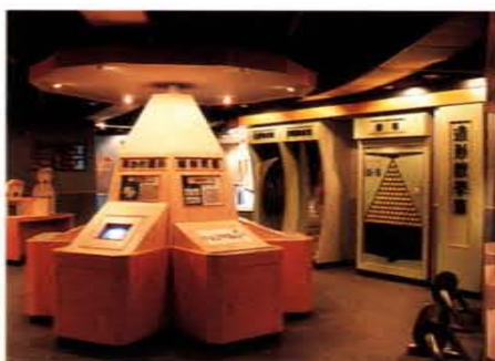
「造形數學篇」配合實體模型與電腦動畫及軟體結合展出

十一、出版科學教育書刊及教學錄影帶，加強教學輔導與推廣大眾科學教育。其中有「科學研習」月刊，為中小學師生自然科學課程的優良補充教材；另有科學漫畫、星座故事、