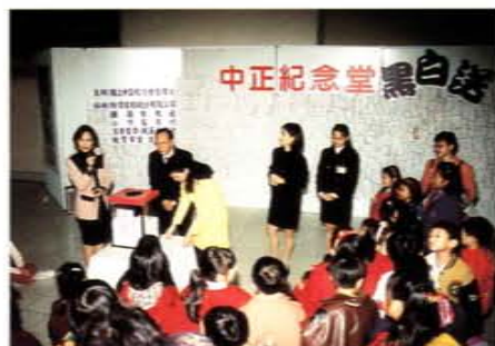
主持「中正紀念堂黑白透」抽獎活動