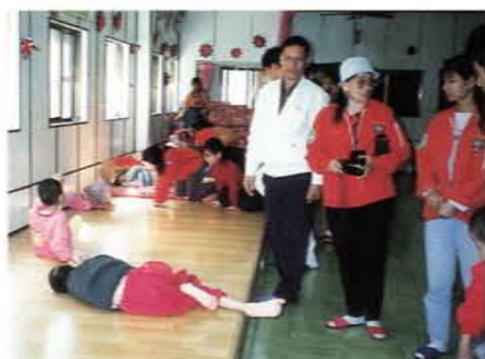
訪問台南鹽光殘障育幼中心