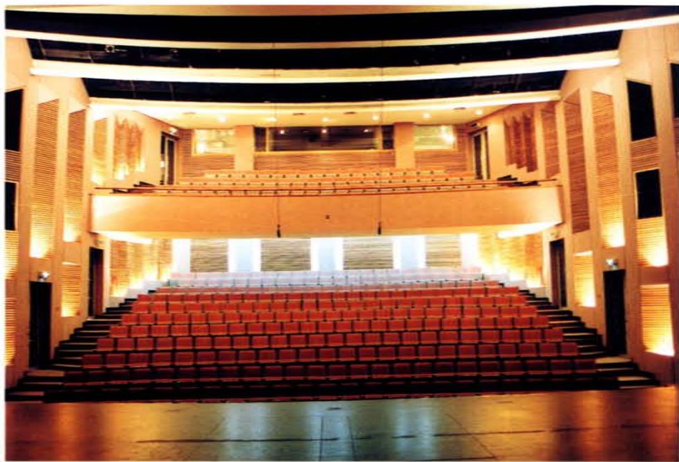
設備完善的演藝廳