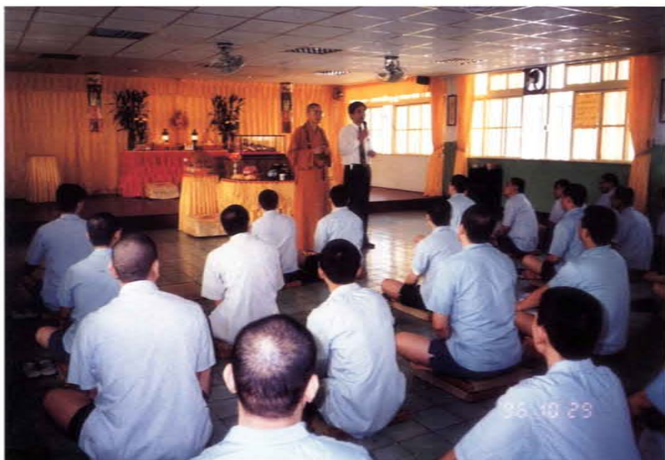
在台北看守所為重刑犯開導是非因果

八十一年十一月，召集成立「中華佛教音樂推廣協會」，擔任理事長迄今。推廣佛教音樂，弘揚正信佛教