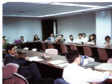
舉辦「交通事故傷害研討會」

九、民國八十五年四月六日舉辦「原住民健康研討會」並出版「原住民健康問題之現況及未來展望」論文集。