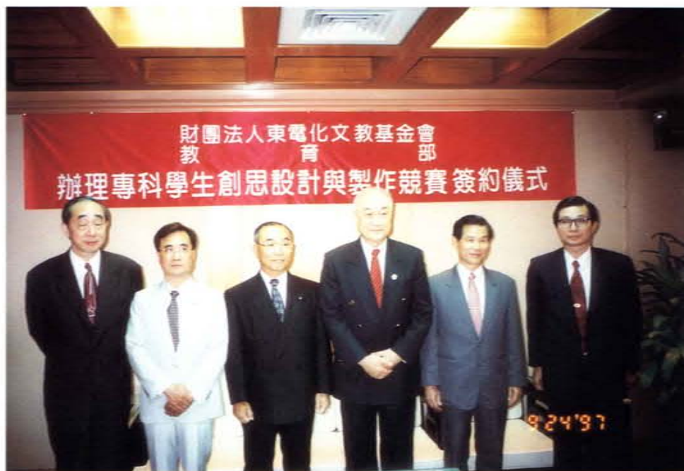
專科學生創思設計與製作競賽簽約儀式。（右三為教育部吳京部長）

隨著經濟的發展，國民所得的提高，以及因應科技化社會潮流對科技人才之迫切需求，經由基金會贊助者台灣東電化股份有限公司董事長高杉春正先生之建議，改革擴充基金營運領域，而將原「獎學基金」於八十三