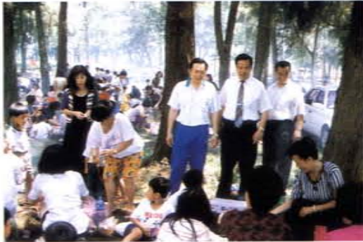
「親子烤肉」現場王議長（立者右二）與洪鄉長（立者右三）與民共炊