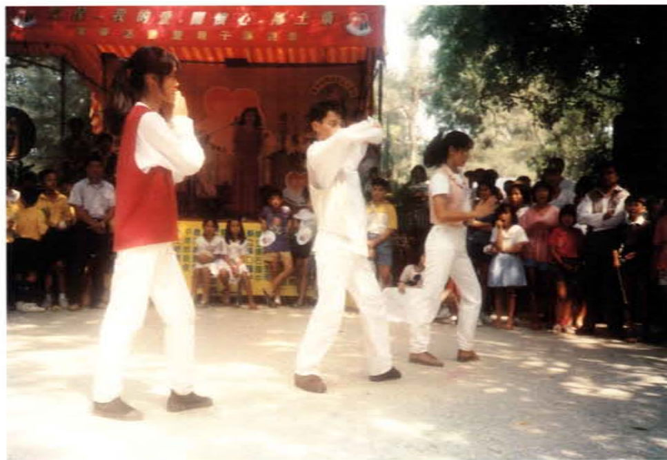
舉辦「我的愛·關懷心·鄉土情」活動

六、結合資訊化專業單位，推動遠距教學實驗，與成大、清大進行校際互選，計約八百位學生參與。