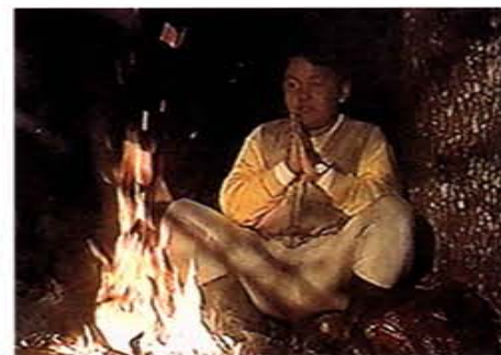
獨自在深山接受體能鍛鍊、毅力考驗和野外求生的布農族少年

內容包括劇情、單元目標、討論及參考資料，其中「討論」部分係將各集劇情發展過程中發生的事物、問題及因應措施，採問答方式深入淺出地探討，協助主持人視不同場合與觀賞人的需要採擇運用，以達成促成觀賞人思考、增進了解、力行改進的目標。