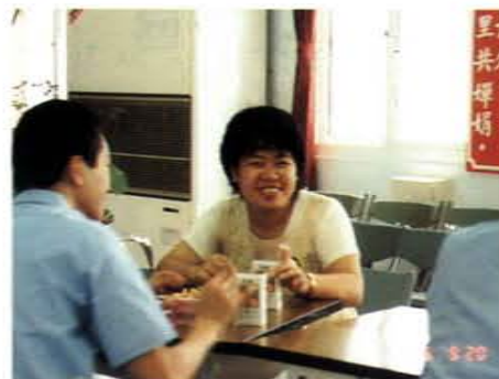
秋節時於台中看守所戒毒班懇親會與受刑人同樂

伍、結合社會資源：於八十六年一月與中國醫藥學院全德醫療諮詢社合辦台中看守所義診活動，為收容人診斷與治療皮膚與傷科方面之疾病，為中部監所創舉，其他監所亦頗表讚許及歡迎，正陸續洽談中。