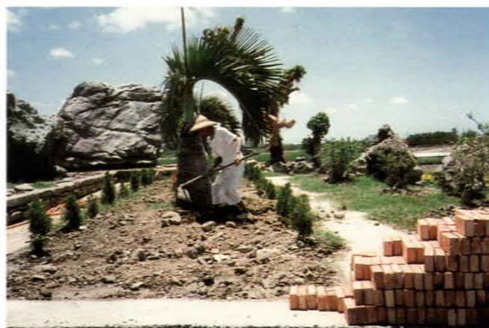
社區公園由村民植樹