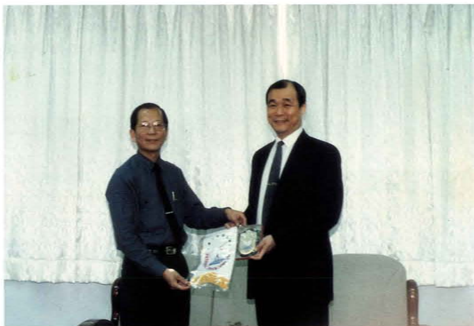
提倡馬祖地區空中教育，獲空大陳義揚校長（右）頒獎表揚

五、地區解嚴及戰地政務制度終止後，秉讀書人任重道遠之精神，挺身整合呼籲軍民團結，化解對立及誤會，對凝聚軍民共識貢獻良多。爾後