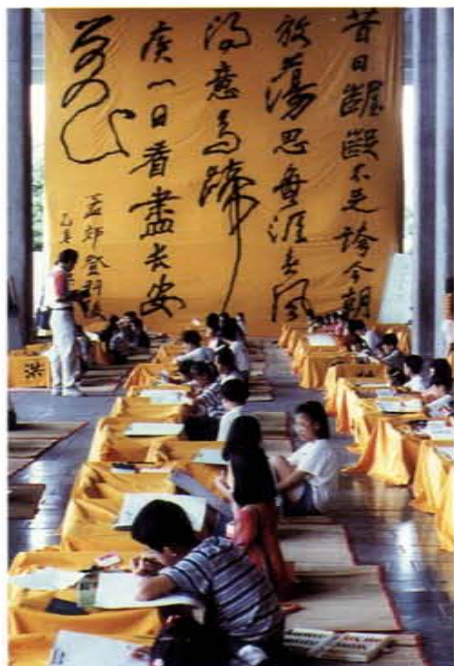
寫作才是兒童學詩的唯一方法——小朋友的古典詩會考