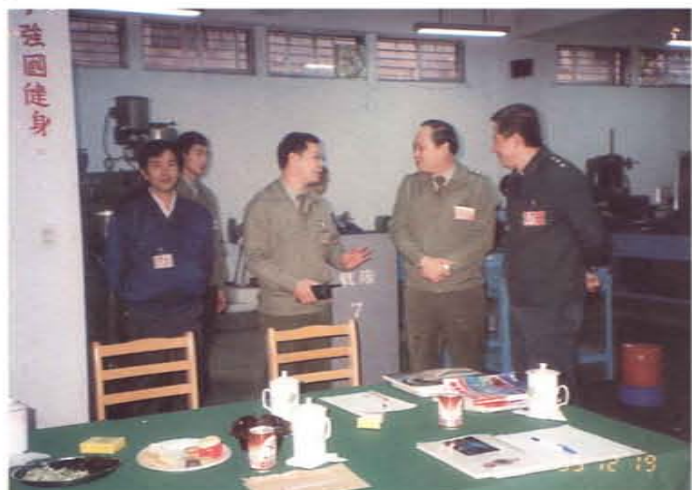
上級人員參觀職訓中心學員上課情形之二