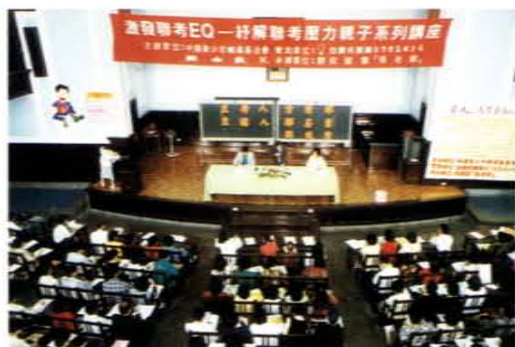
激發聯考EQ——紓解聯考壓力親子系列講座