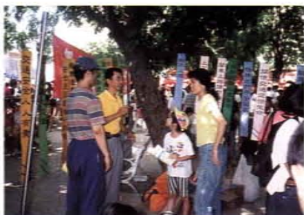
交通安全宣導活動之二

教學工作，利用夜間指導失學民衆識字，一音一字，一筆一畫，教他們唸，教他們寫，並將日常生活基本知能，融入自編教材中，使之學以致用。在其風趣生動，認真耐心的教導下，學生們已能寫一手端正的字，說一口流利的「台灣國語」。