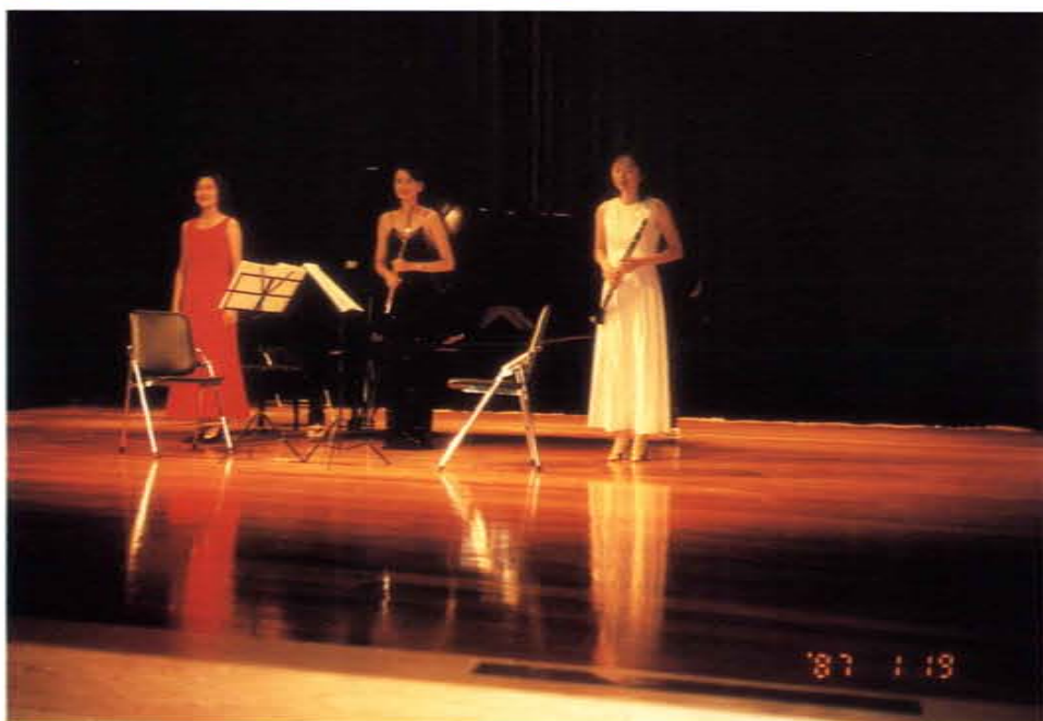
藝文活動之二音樂會

國立中正大學成人及推廣教育中心積極推動成人教育研究工作、辦理推廣活動並接受諮詢服務，嘉惠雲嘉地區廣大民衆，在終身學習社會的時代，扮演重要的角色，該中心正規劃籌建推廣教育大樓，以提供雲嘉地區民衆更舒適之學習空間。