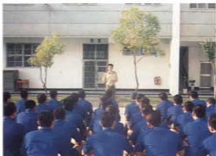
擔任教官教誨受刑人

身在軍中仍不忘關懷社會、付出愛心，身為慈濟委員，六年多來每月定期捐款濟助貧困，並經常利用短暫的休假日參與各種公益活動，諸如環境保護、賑災義賣、關懷老人、骨髓捐贈、捐血救人等活動，不勝枚舉，足跡遍佈全省各個偏遠角落，其善心