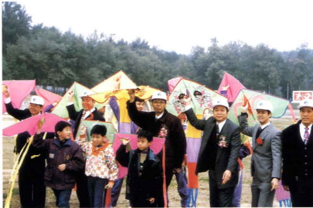
「假日文化廣場」施放風箏（右三為洪鄉長，右四為陳縣長）