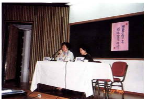
兒童、青少年性傷害工作坊