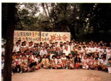
帶領高雄市兒童合唱團與北京大學附小民歌合唱團聯誼