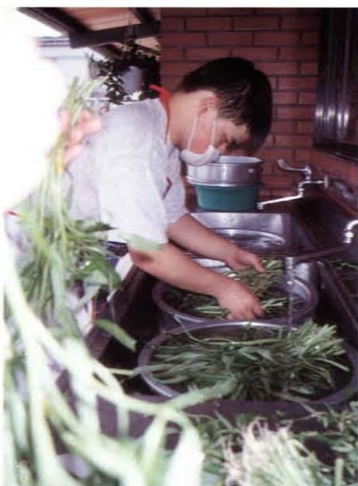
智障青年職業訓練——餐飲訓練