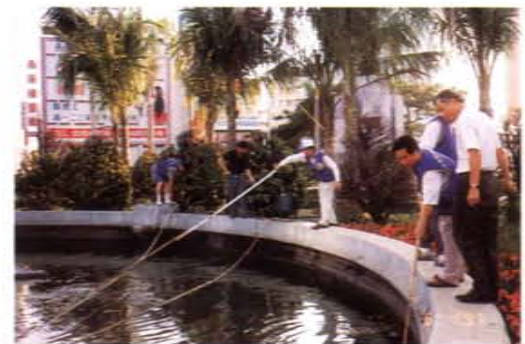
至所認養的火車站圓環舉行清潔工作