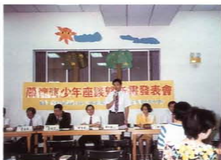
策辦「大直社區關懷青少年座談會暨新書發表會」