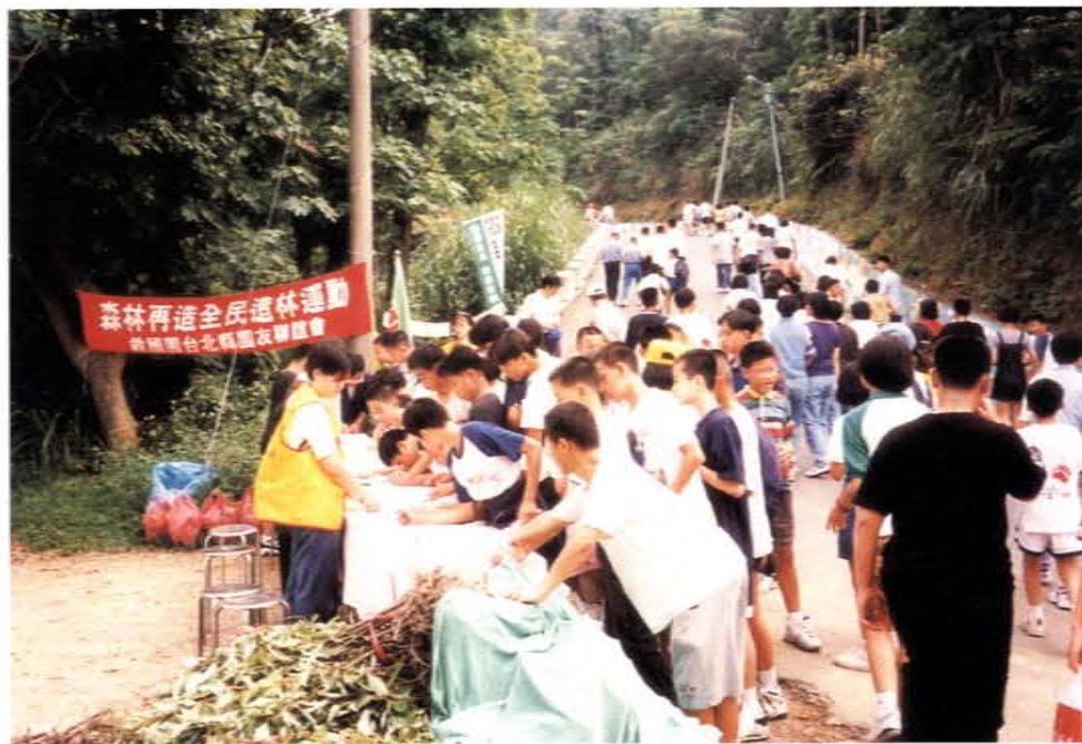
「森林再造全民造林運動」由台北縣團友聯誼會主辦

自然環境，結合省立博物館、中華昆蟲學會等單位共同推動「再造蝴蝶王國」全民保育運動，激起國人熱烈迴響。續於本年響應政府「全民造林運動行動年」號召，聯合台灣省林務局共同推出「森林再造」全民造林運動，建立國人愛林、護林、育林之共識，並付諸實際行動，對森林再造、環