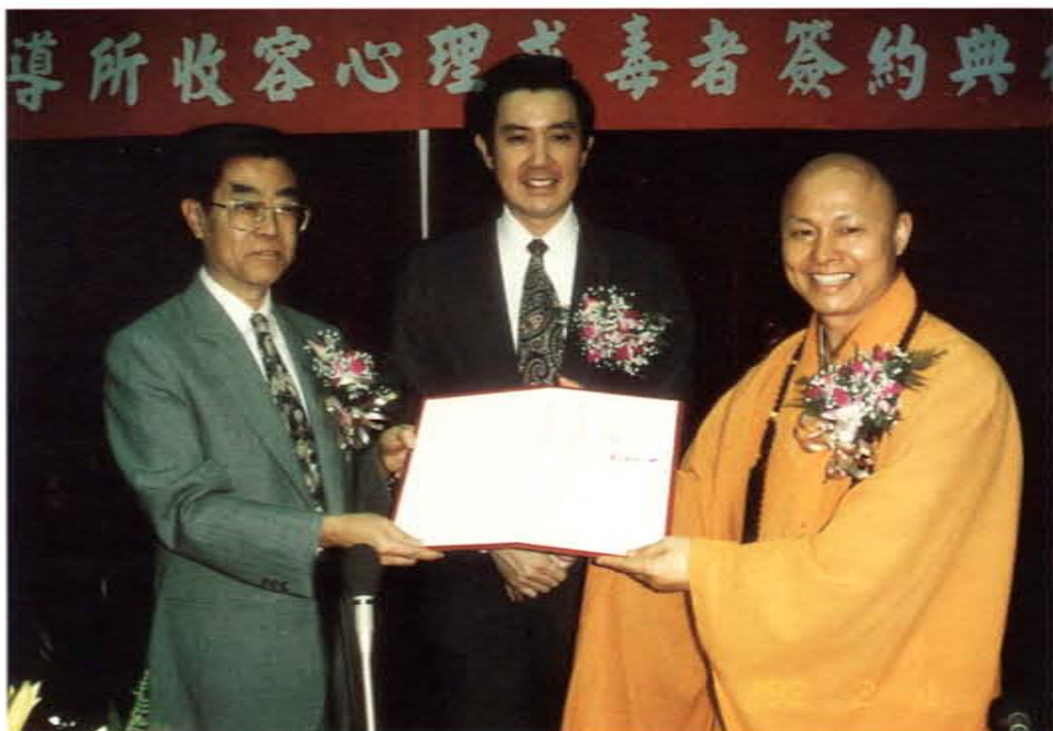
與法務部簽約成立「戒毒者中途之家」