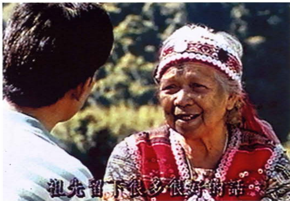
泰雅人的信仰以祖靈為中心，一位長輩期盼下一代能記住祖先的話從中得到啟示和教導