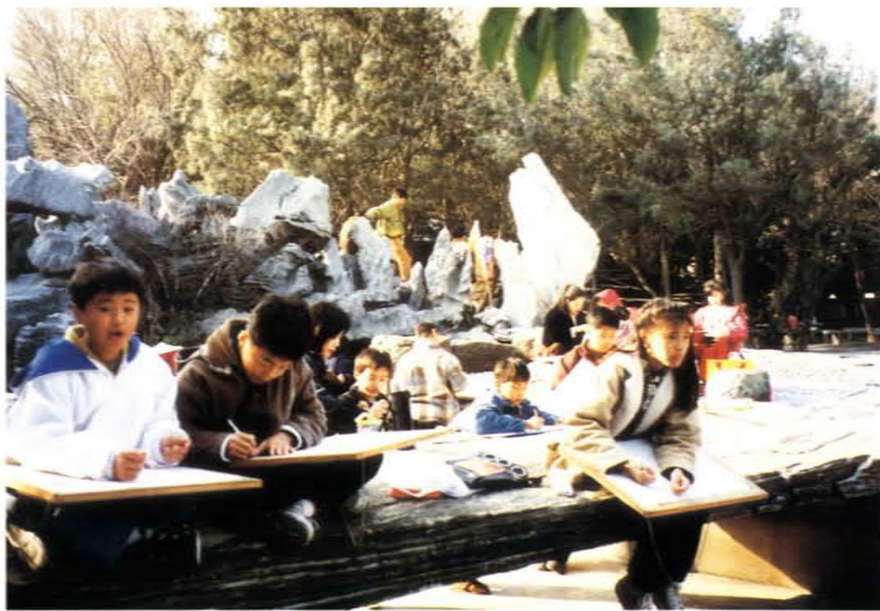
假日水彩寫生比賽