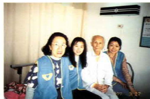
「婦女學苑」學員的社區服務

理學院辦理社會教育雖未及二年，但回饋頗佳，今後該校將再努力，與社會需求相結合，辦理更好、更完善的社會教育。