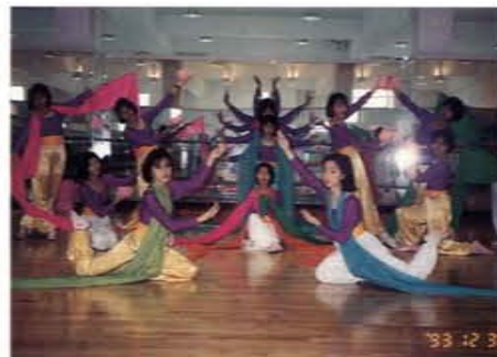
帶領學生參加慶祝元旦民俗才藝競賽