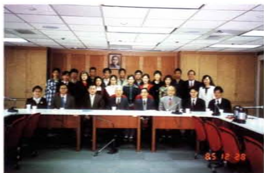
接待八十五年參加國際科學展覽之學生代表