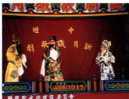
台灣省第五屆客家戲劇比賽實況