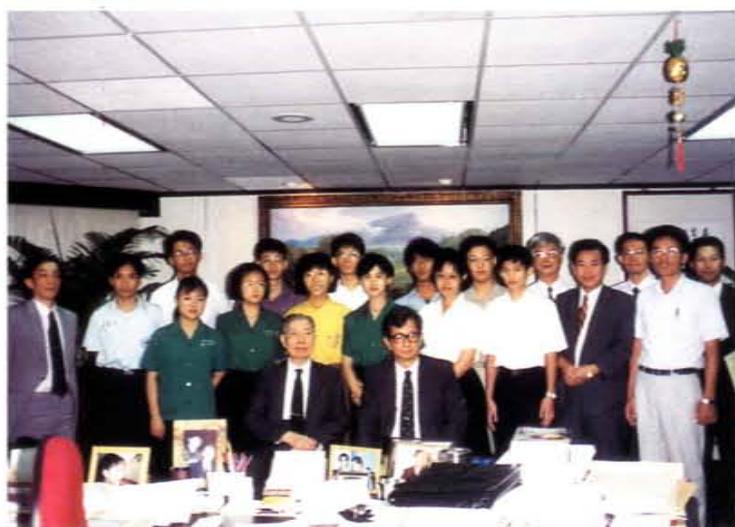
八十二年參加國際科學展覽之學生代表拜訪李國鼎科技發展基金會 (坐者左為李國鼎資政，右為李遠哲博士)