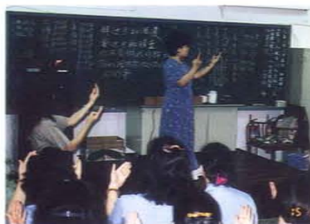
每週於台中看守所教授手語歌

肆、為台中監獄規劃每日起床號及晚安曲，視時段選播輕快或柔美歌曲及旋律，週一至週日各有千秋，一掃鐵窗子人冰冷的制式印象。