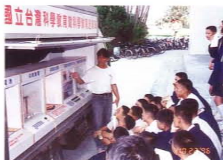
科學教育巡迴車平衡城鄉教育資源