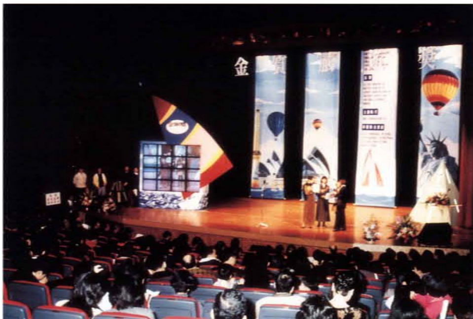
「全質旅遊獎」頒獎典禮