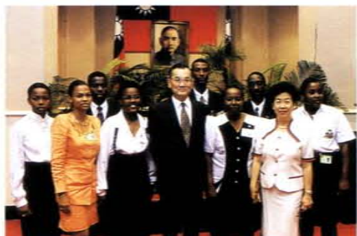
八十四年國際青年育樂營，由李鍾柱主任陪同海地代表團員拜會行政院連戰院長