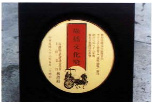
獲行政院文建會廣播文化獎

與高師大、心路文教基金會高雄服務處合製特殊教育節目，分別獲得行政院新聞局、文建會及地方政府、民衆之獎勵、支持與肯定。