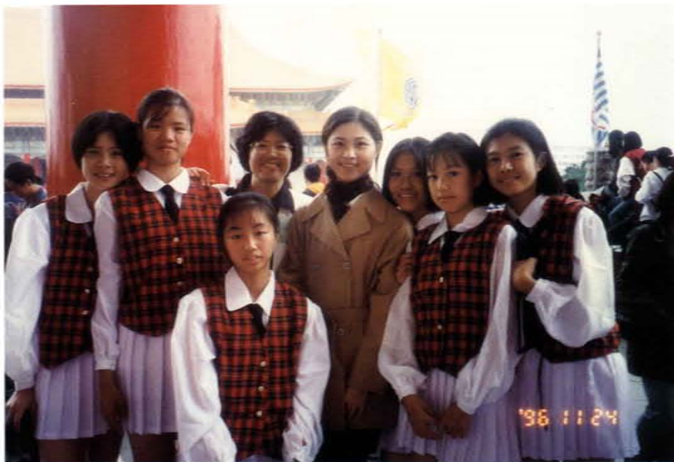
擔任金門高中樂儀旗隊指導老師參加一九九六國際樂儀旗觀摩賽

蔡老師獻身教育事業二十餘載，認真負責，犧牲奉獻，無怨無悔。她積極投入各項社教工作，對於匡正社會風氣盡心盡力，績效卓著，從不邀功，誠為默默奉獻之心靈改革者，並為社會之表率。