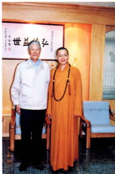
響應李總統心靈改革運動，呈上全民讀經企畫書