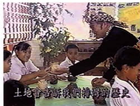
重視藝術的排灣族其頭目正教導小孩學習製作陶壺