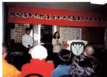
淨化社會文教基金會六週年慶暨才藝成果展