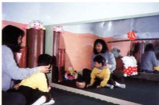
物理治療師為殘障兒童做復健